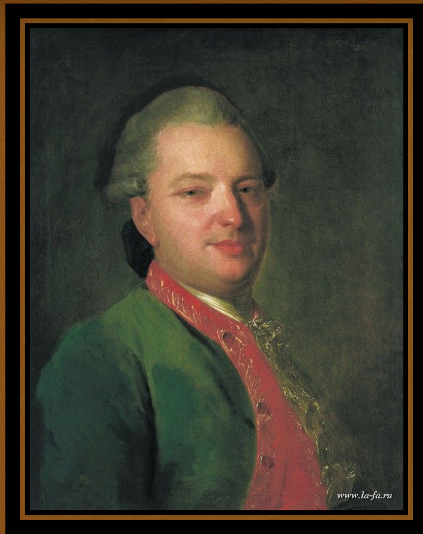
Федор Степанович Рокотов Портрет В. И. Майкова (Около 1765)