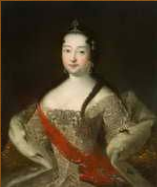
Портрет царевны Анны Петровны