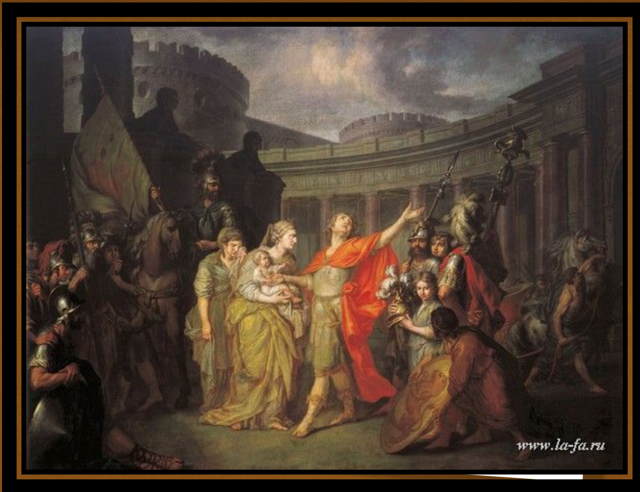
АНТОН ПАВЛОВИЧ ЛОСЕНКО Прощание Гектора с Андромахой (1773)