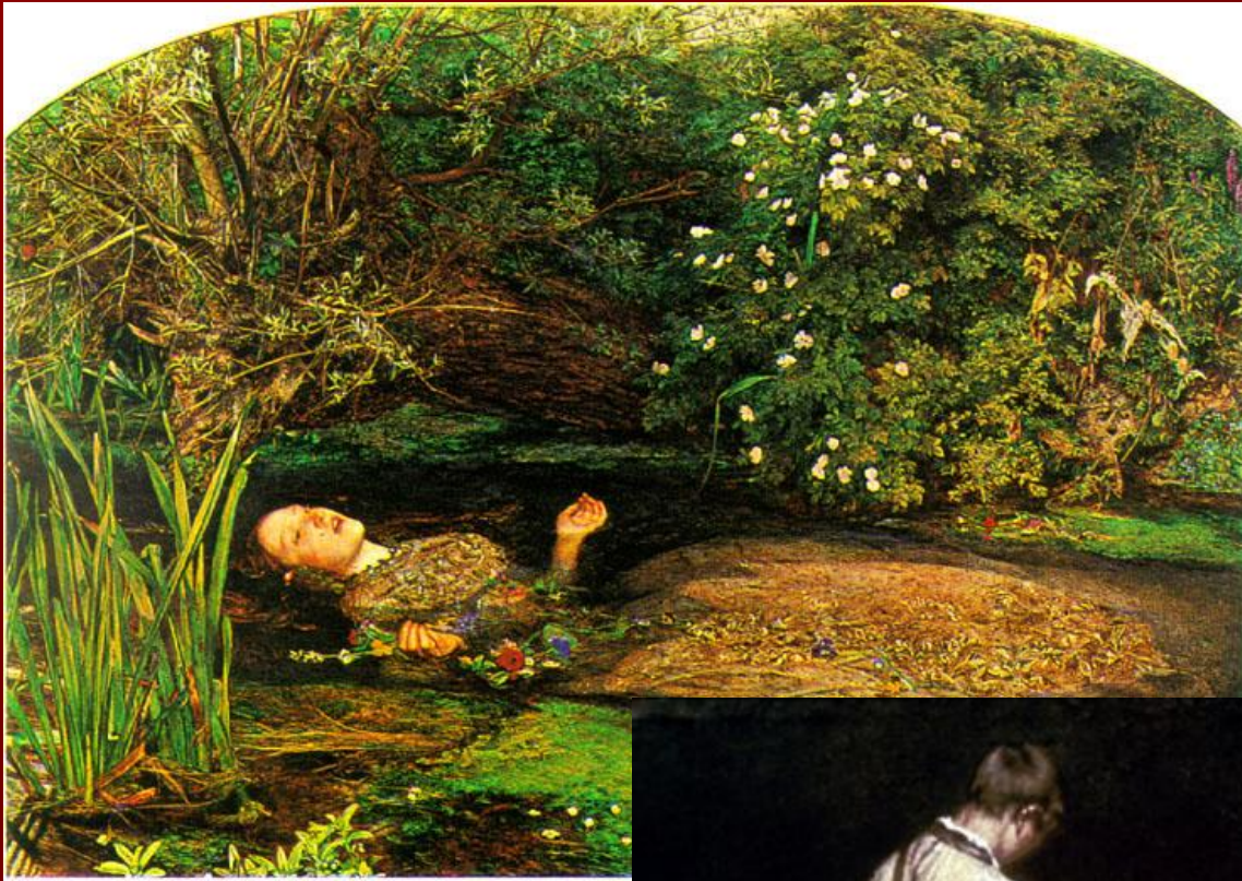
Д. Миллес «Офелия»