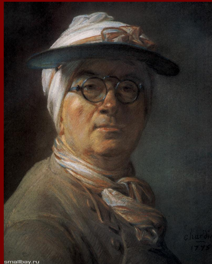
Ж. Шарден Автопортрет с козырьком