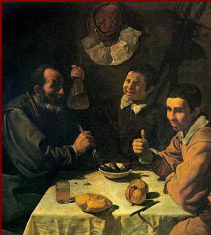
Д. Веласкес «Завтрак»