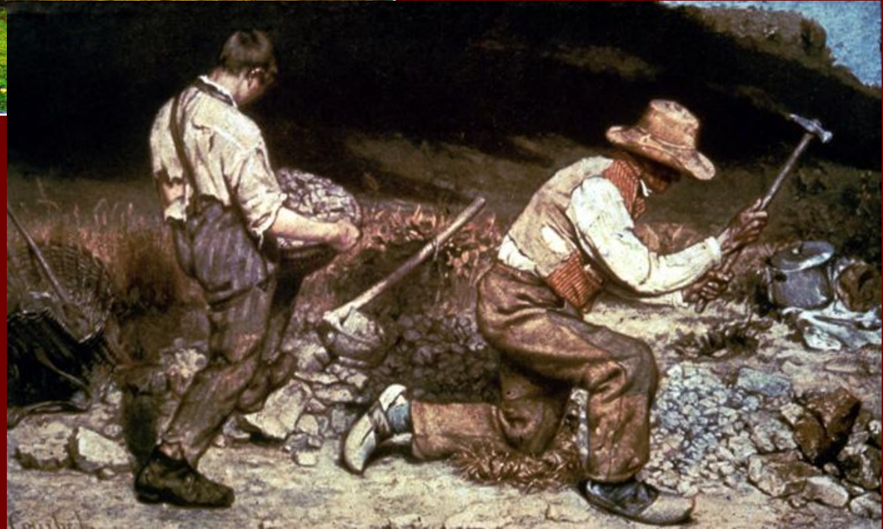
Г. Курбе «Дробильщики камня»