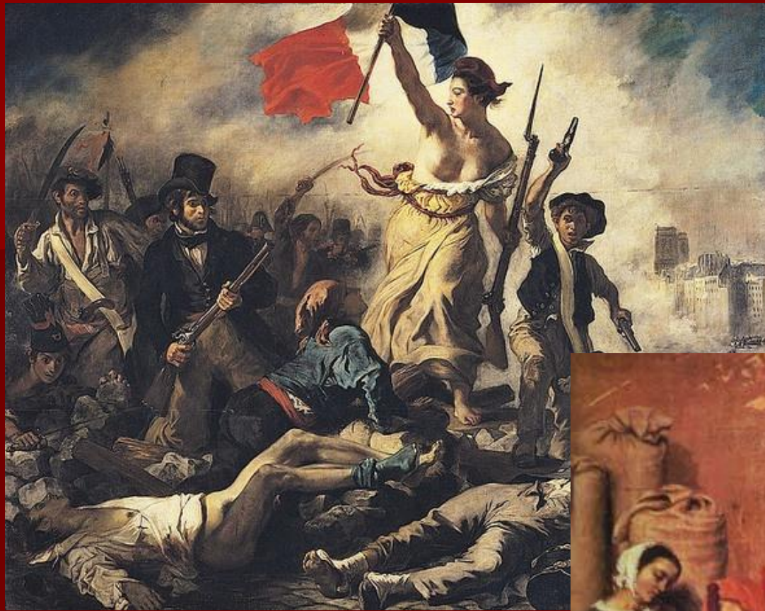
Э. Делакруа «Свобода, ведущая народ»