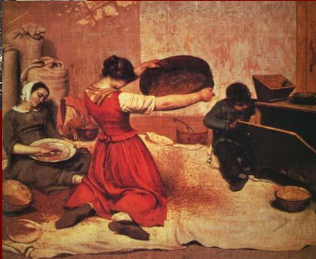
Г. Курбе «Веяльщицы»