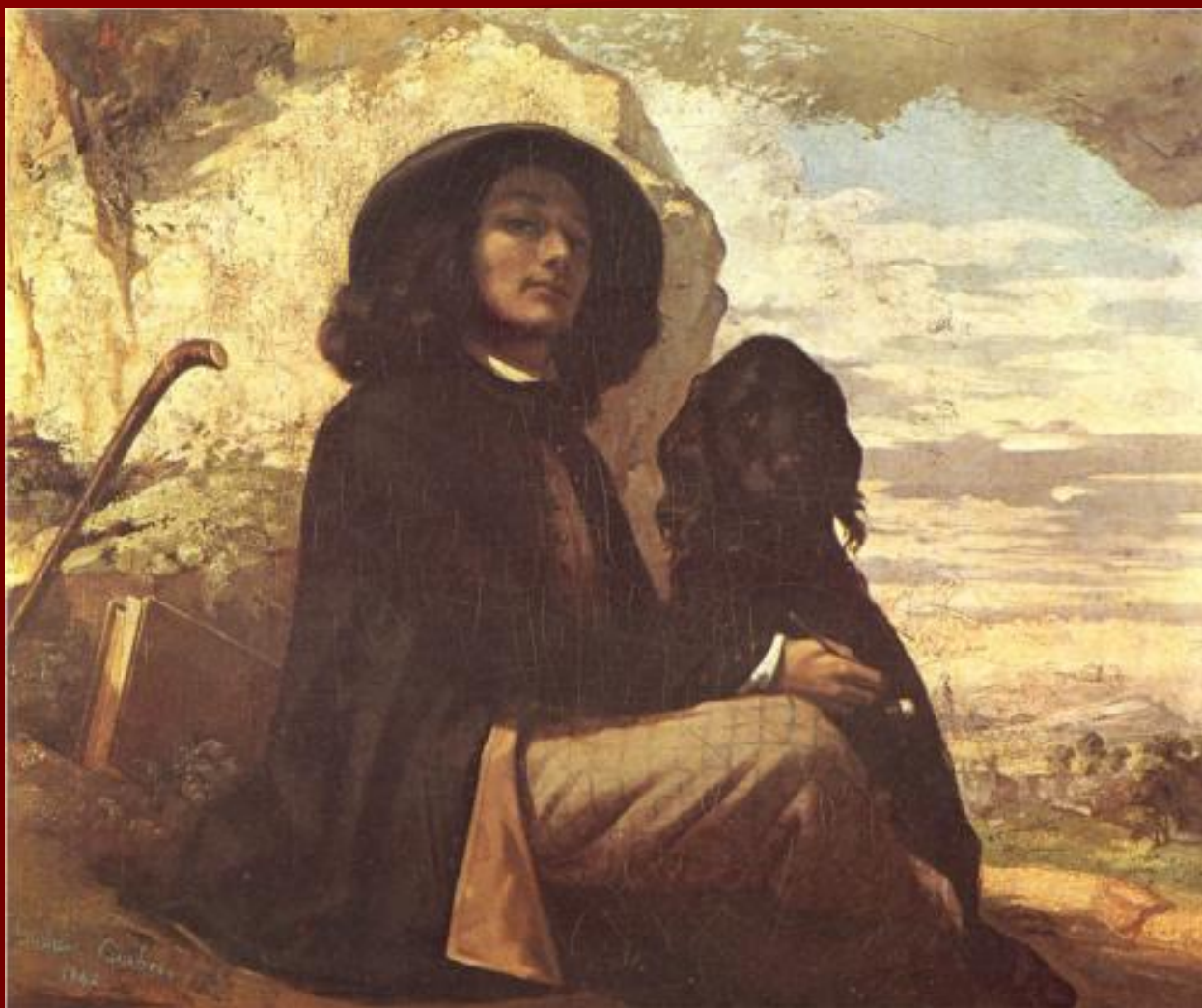
Автопортрет с черной собакой