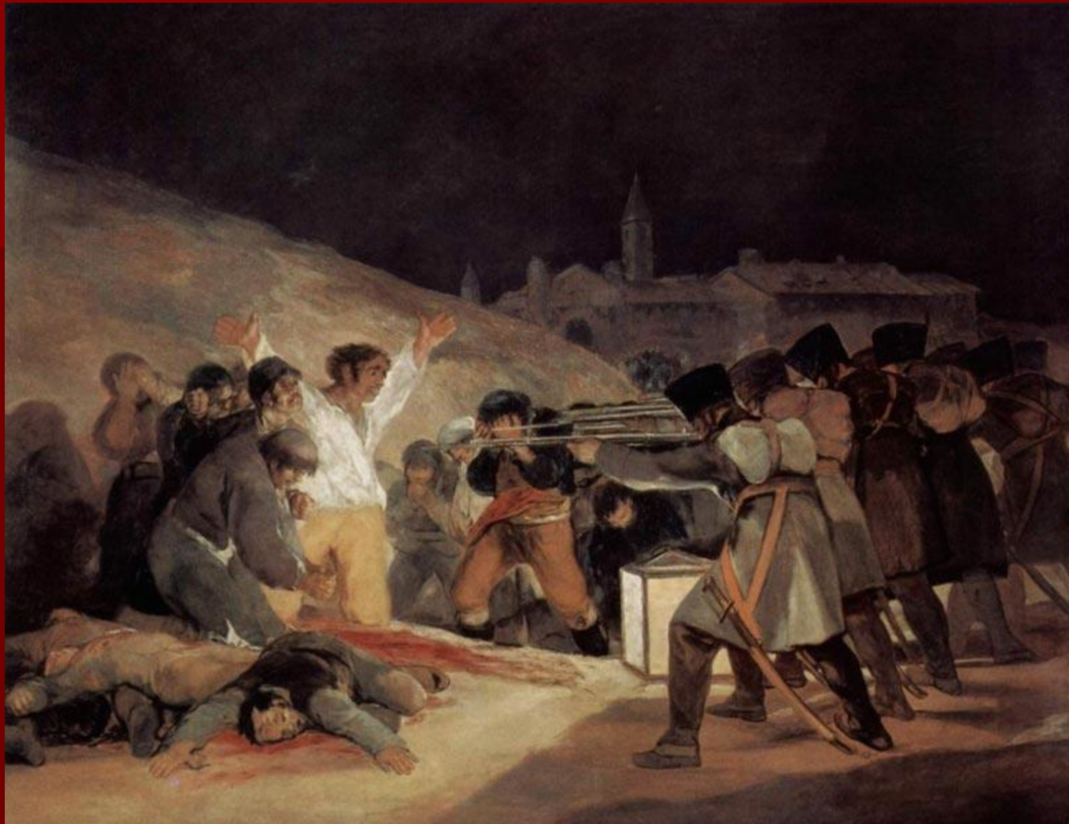
Ф. Гойя «Расстрел повстанцев в ночь на 3 мая 1808 года»