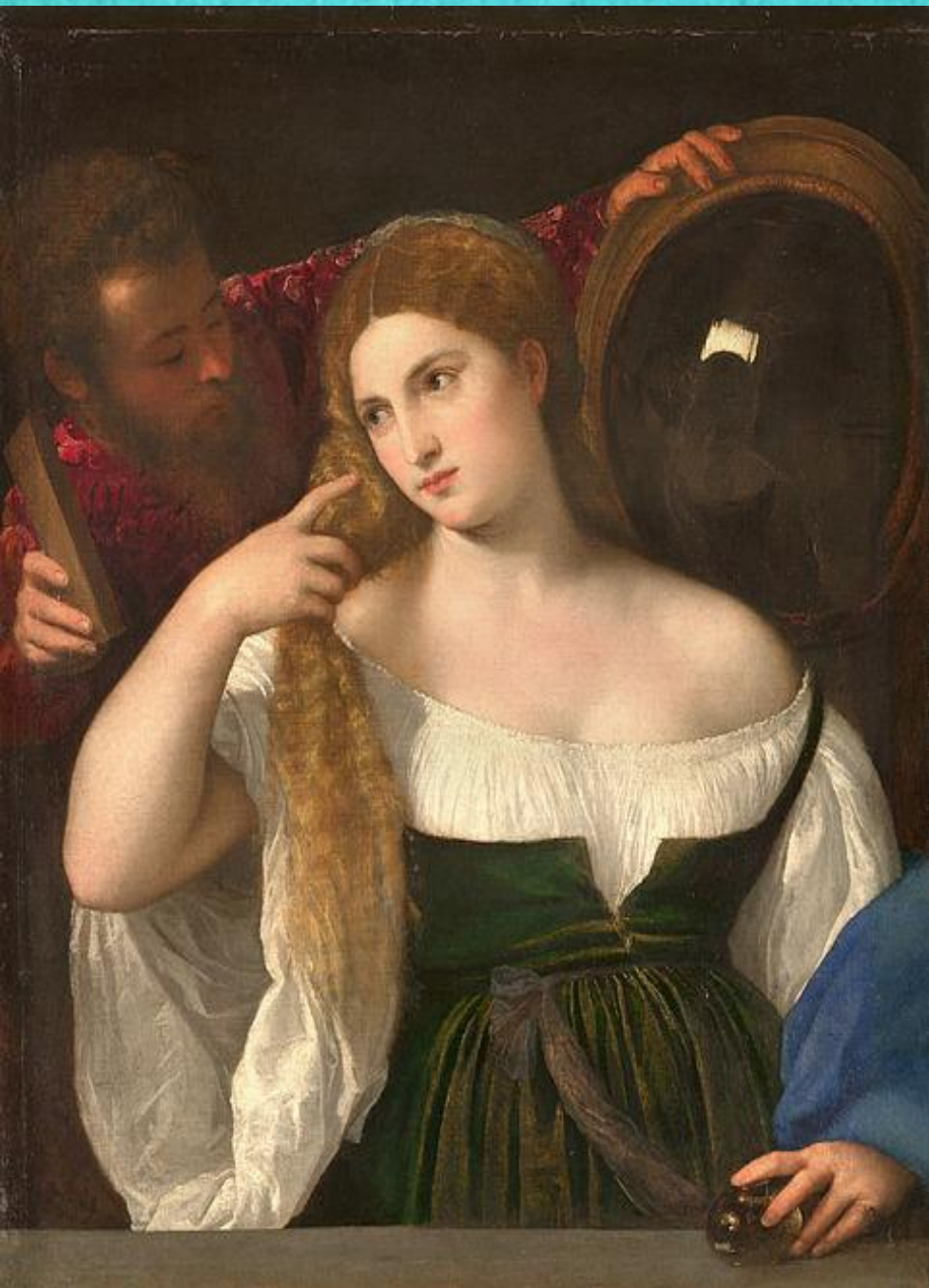
Женщина перед зеркалом, 1515 Лувр, Париж