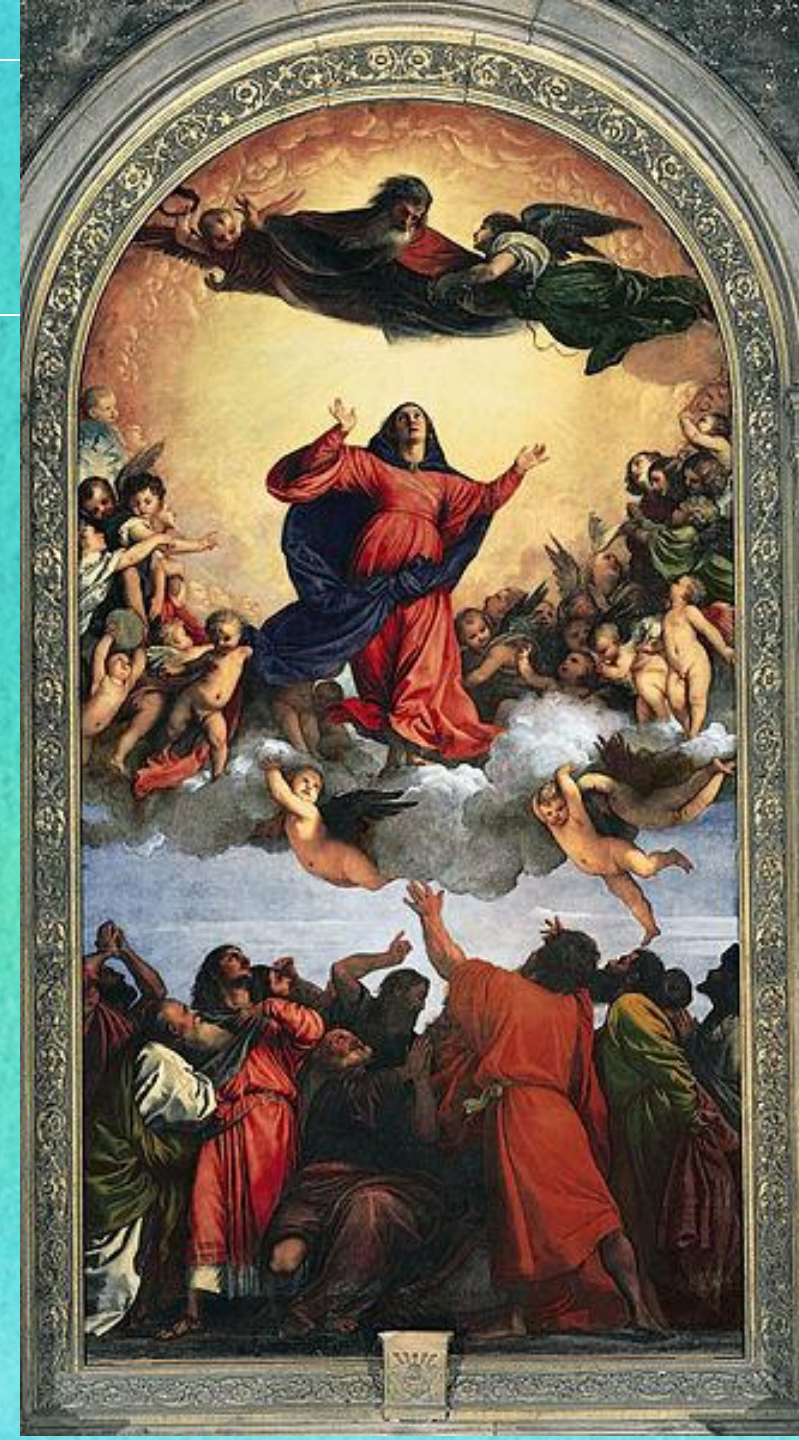
Вознесение Богоматери, 1516-1518