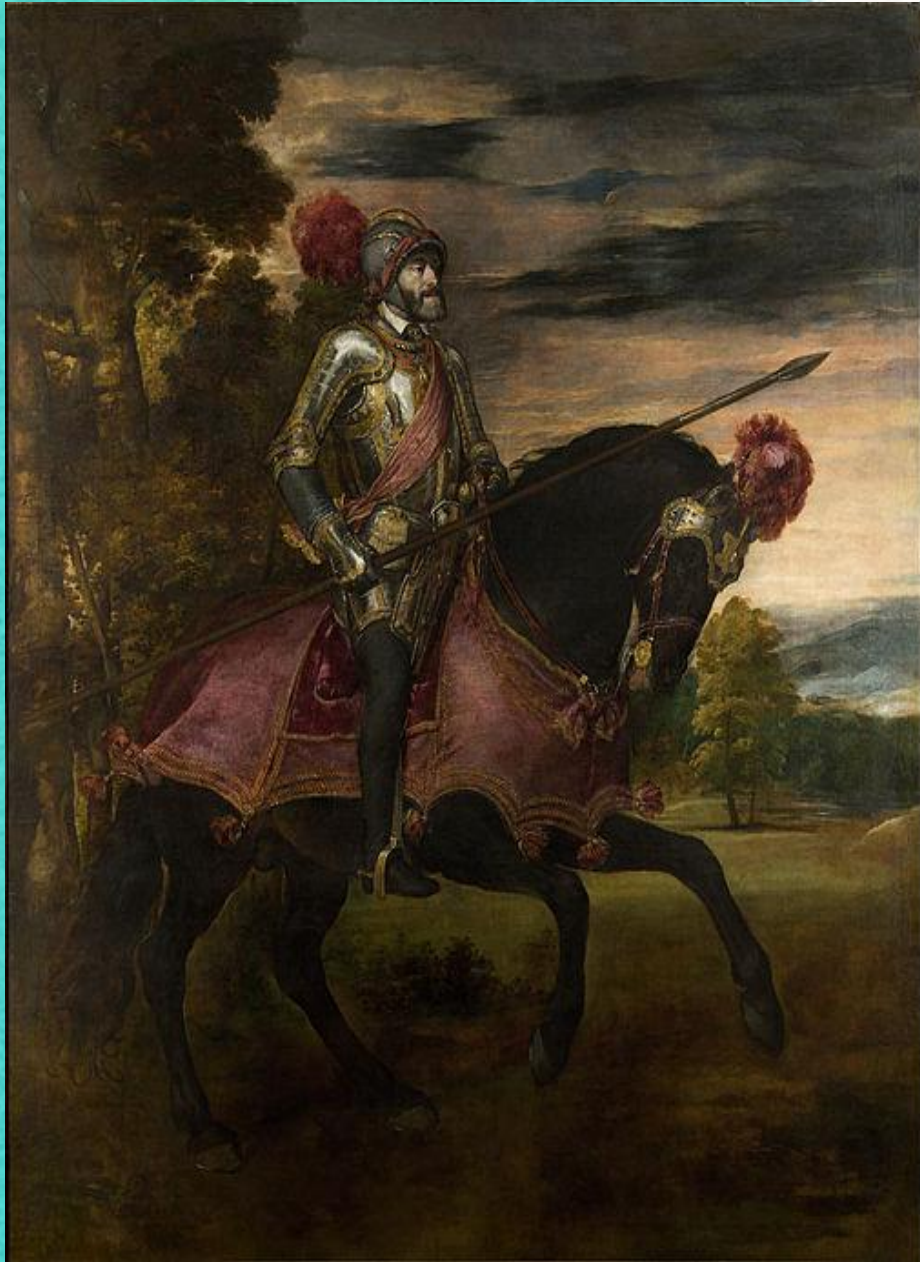
Конный портрет Карла V, 1548

Конец 1530-х—1540-е гг. — время расцвета портретного искусства Тициана. С удивительной прозорливостью изображал художник современников, запечатлевая самые различные, порой противоречивые черты их характеров: уверенность в себе, гордость и достоинство, подозрительность, лицемерие, лживость и т.д. Наряду с одиночными он создавал и групповые портреты, беспощадно вскрывая скрытую сущность взаимоотношений изображенных, драматизм ситуации. С редким искусством Тициан находил для каждого портрета наилучшее композиционное решение, выбирал характерные для модели позу, выражение лица, движение, жест.