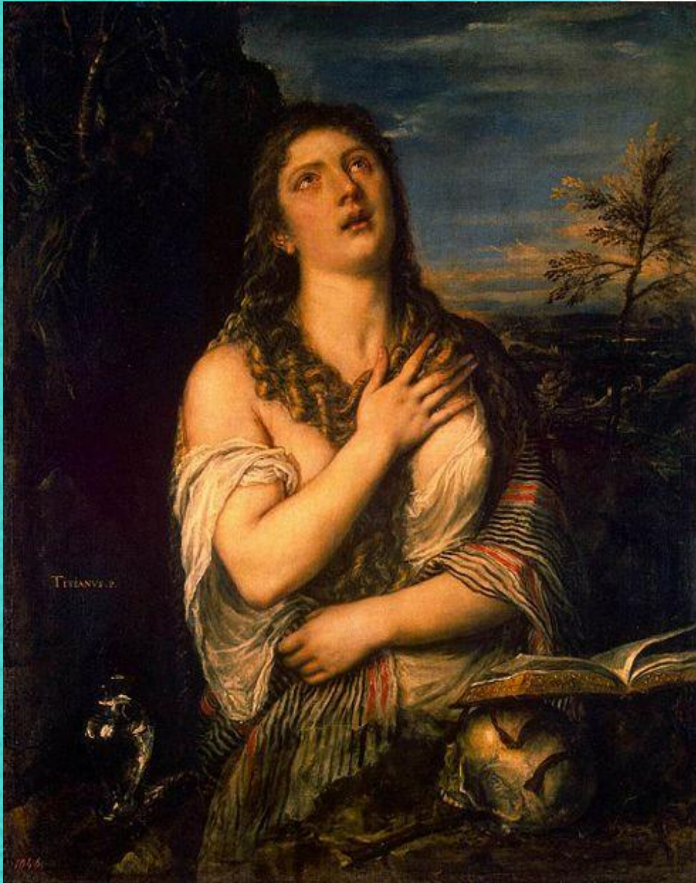
Кающаяся Мария Магдалина, 1560-е

Он создаёт замечательные женские образы в «Кающейся Магдалине» (около 1533), «Венере Урбинской» (до 1538).