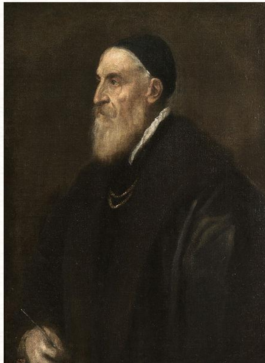
Автопортрет, около 1567 Музей Прадо, Мадрид

Тициа́н Вече́ллио — итальянский живописец эпохи Возрождения. Имя Тициана стоит в одном ряду с такими художниками Возрождения, как Микеланджело, Леонардо да Винчи и Рафаэль. Тициан писал картины на библейские и мифологические сюжеты, прославился он и как портретист. Ему делали заказы короли и римские папы, кардиналы, герцоги и князья. Тициану не было и тридцати лет, когда его признали лучшим живописцем Венеции.