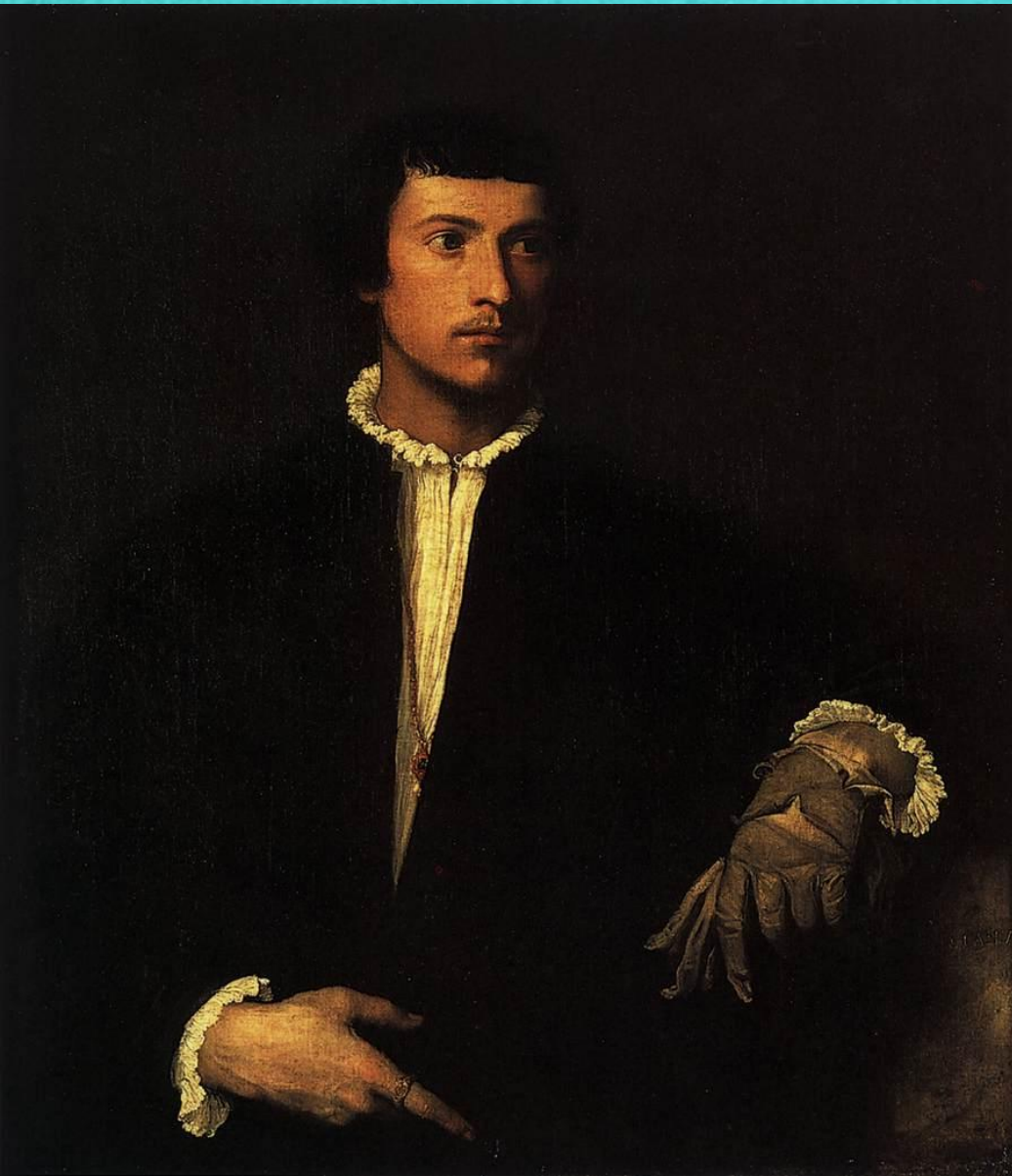
Мужчина с перчаткой, 1523