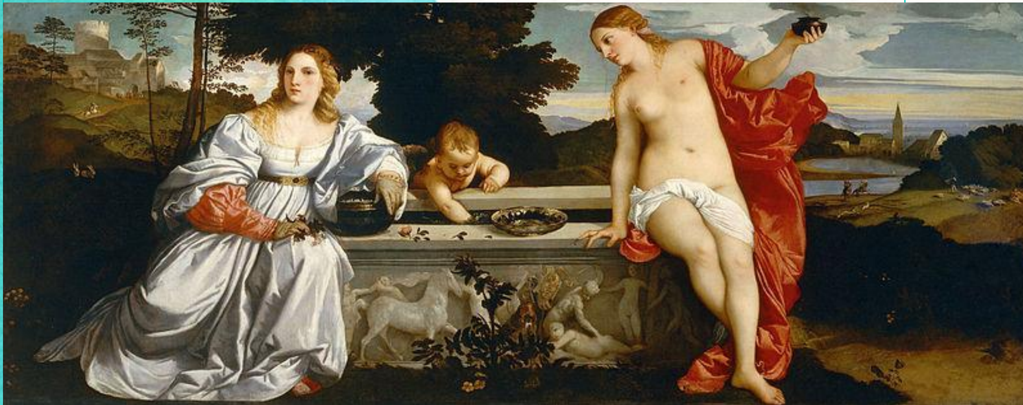
Любовь земная и Любовь небесная, 1514 Галерея Боргезе, Рим