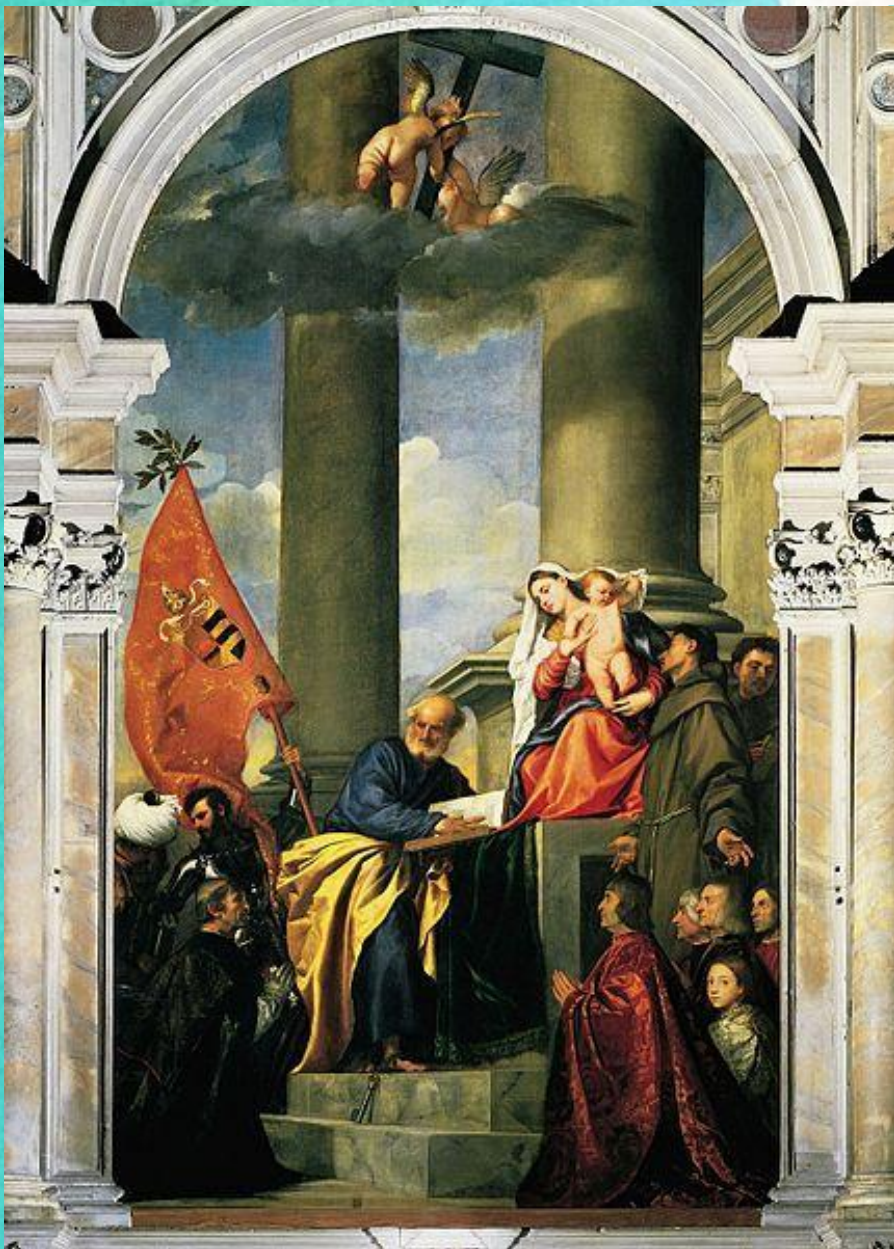
Мадонна Пезаро, 1526