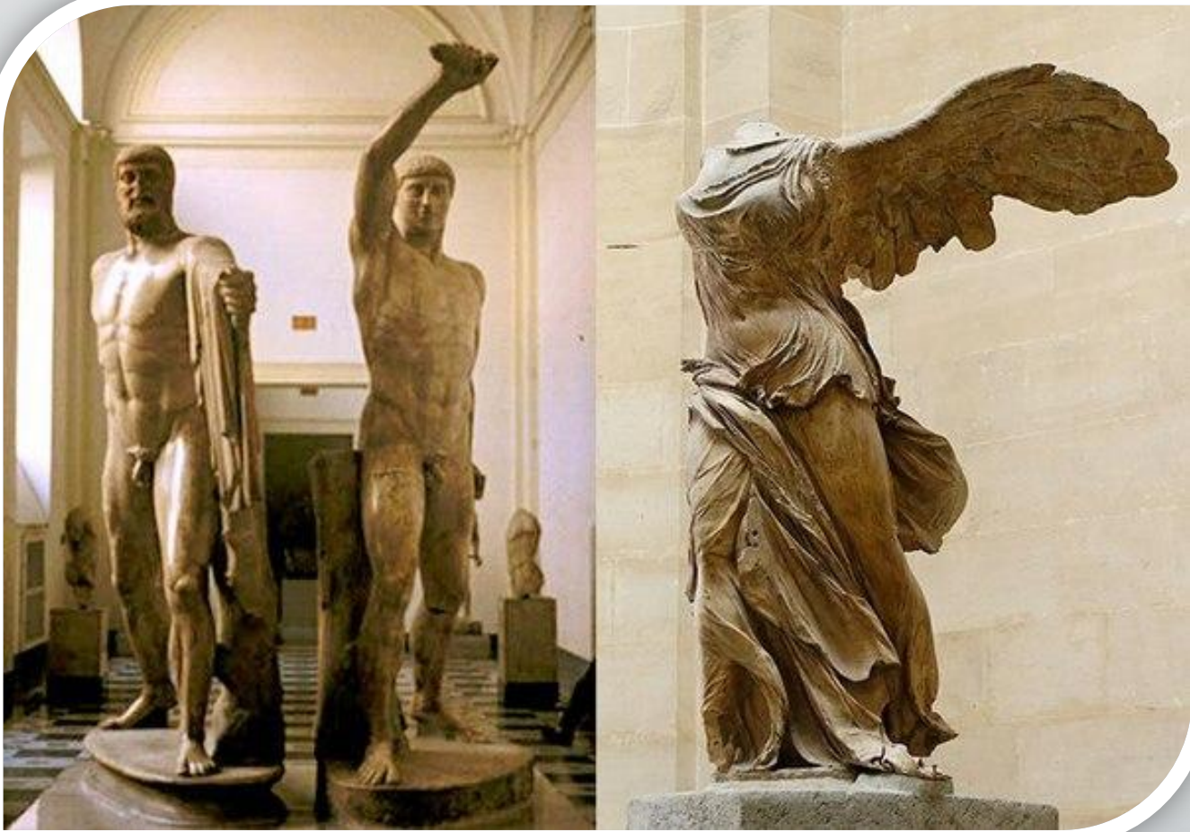
Тираноборцы – слева. Ника Самофракийская – справа

Борис Михайлович Иофан, которому принадлежит самый первый макет этого памятника, отталкиваясь от камерных и в чём-то даже очень частных скульптур античности (композиция «Рабочего и колхозницы» была буквально «собрана» им из «Ники Самофракийской» и статуи «Тираноубийцы», изображавшей двух конкретных исторических персонажей) сумел придать композиции тот характер максимальной абстракции, в которой каждый из зрителей может уловить что-то своё и близкое. Мужчина, женщина, ветер в лицо, жест, напоминающий взмах распахнутых крыльев, – поистине сюжет достоин то ли романтической поэмы, то ли древнего мифа. Наверное, именно таким и должен был видеться нашим предкам новый мир, который, как им казалось, они начинали строить. Наверное, именно так они предполагали над ним господствовать и парить.