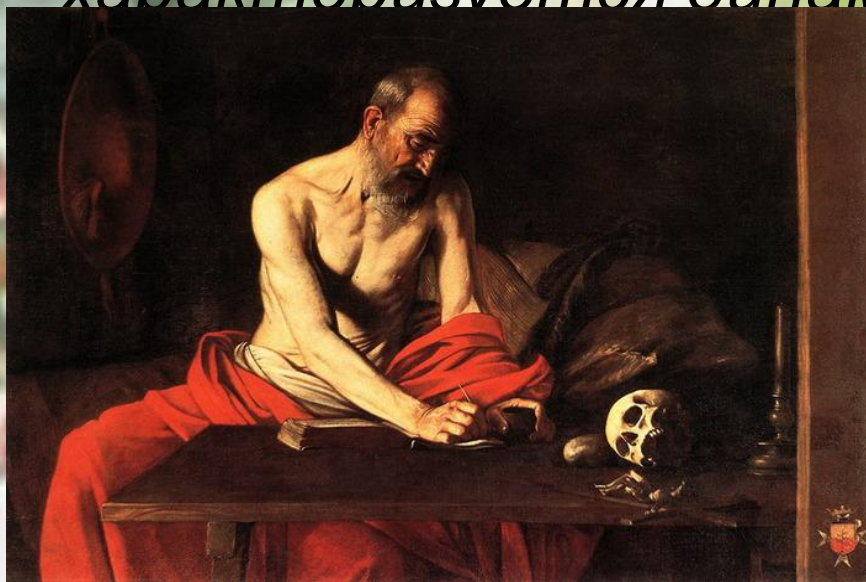
Караваджо. Святой Иероним

Стиль барокко в живописи характеризуется динамизмом композиций, «плоскостью» и пышностью форм, аристократичностью и незаурядностью сюжетов. Самые характерные черты барокко — броская цветистость и динамичность; яркий пример — творчество Рубенса . Стиль барокко в живописи характеризуется динамизмом