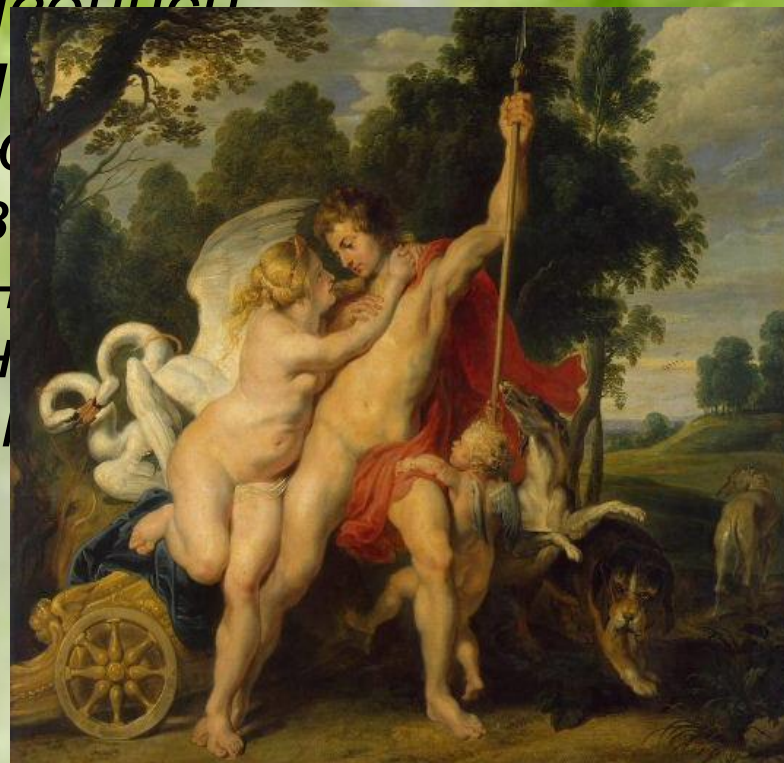
Рубенс. Венера и Адонис.