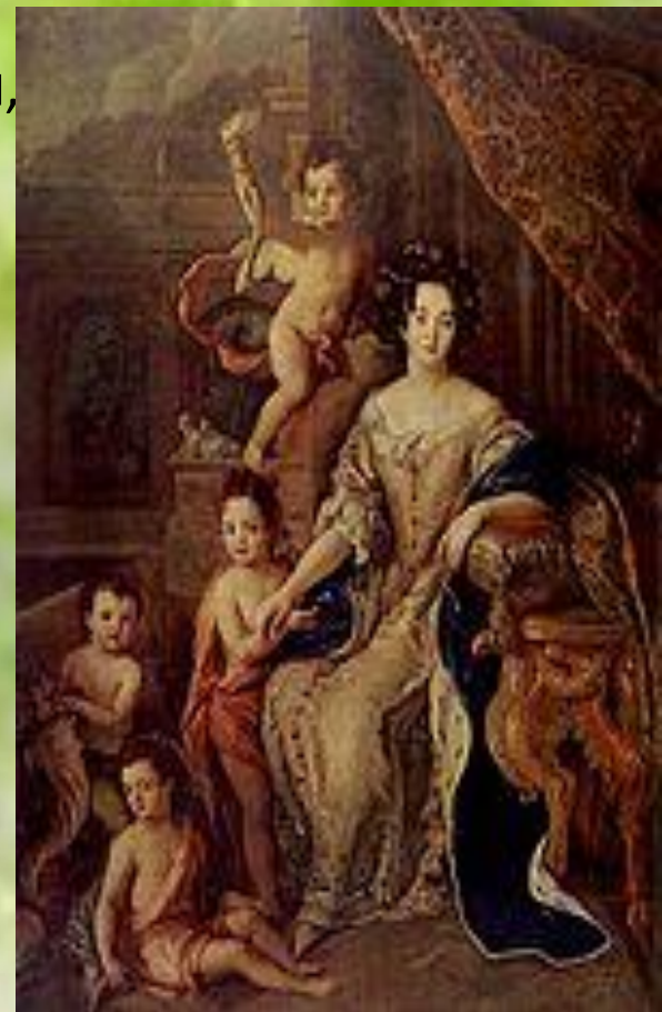
Мадам де Монтеспан , женщина эпохи барокко

дикости, вульгарности и сумасбродства. Для