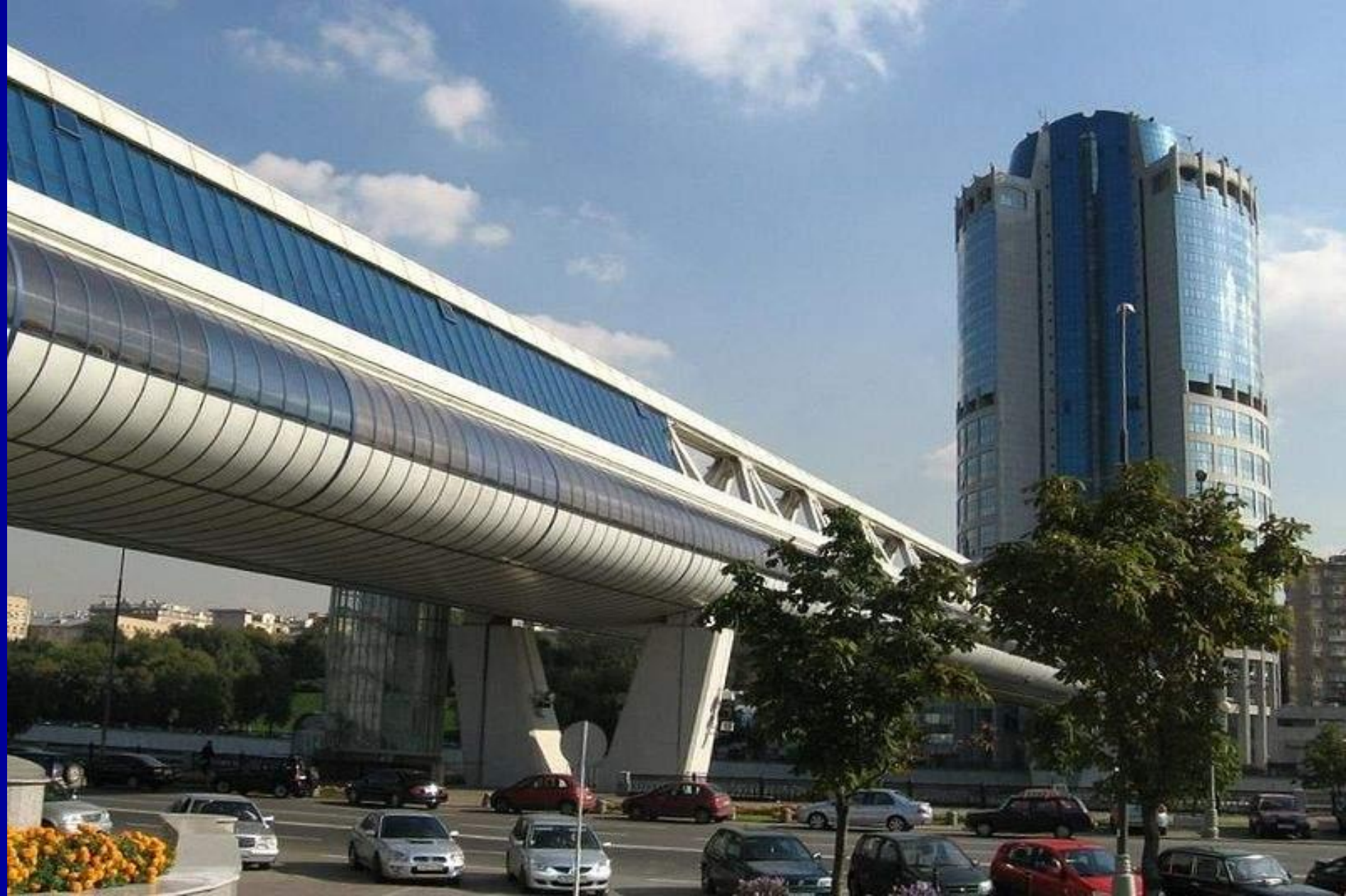
Башня 2000 -34-этажное офисное здание, расположена на правом берегу Москвы-реки. Башня, высотой: 104 м соединена с ММДЦ торгово-пешеходным мостом.