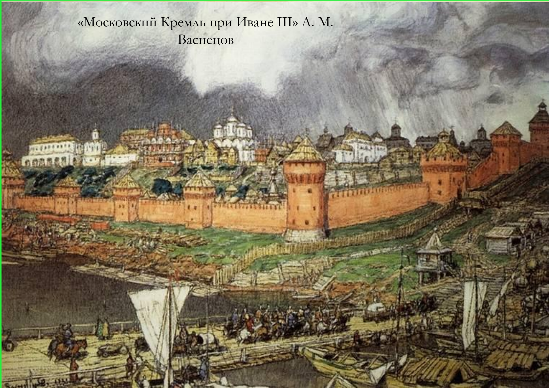
«Московский Кремль при Иване III» А. М. Васнецов