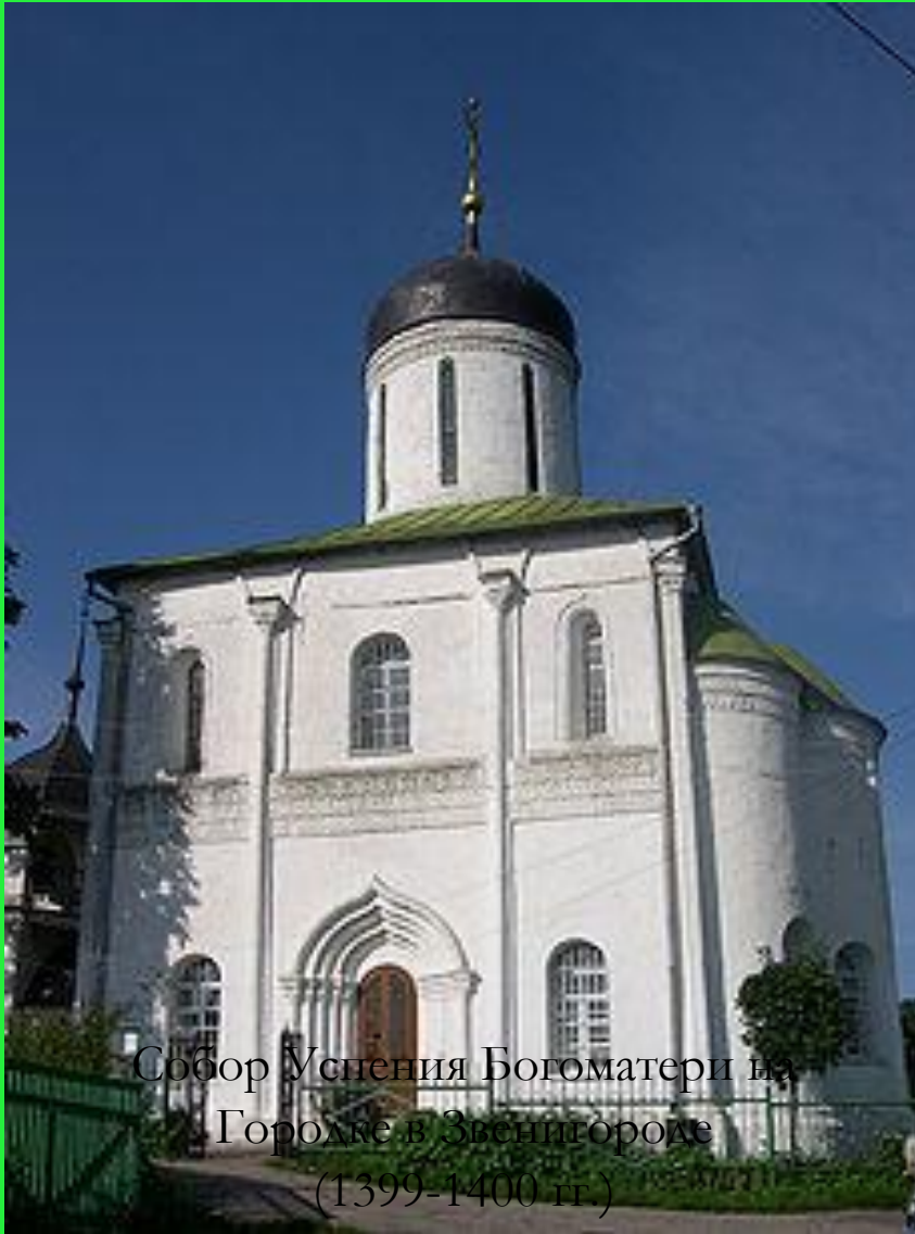
Собор Успения Богоматери на Городке в Звенигороде (1399-1400 гг.)