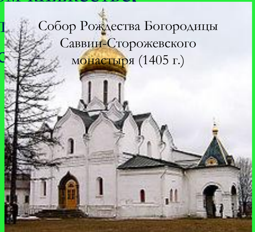
Собор Рождества Богородицы Саввин-Сторожевского монастыря (1405 г.)