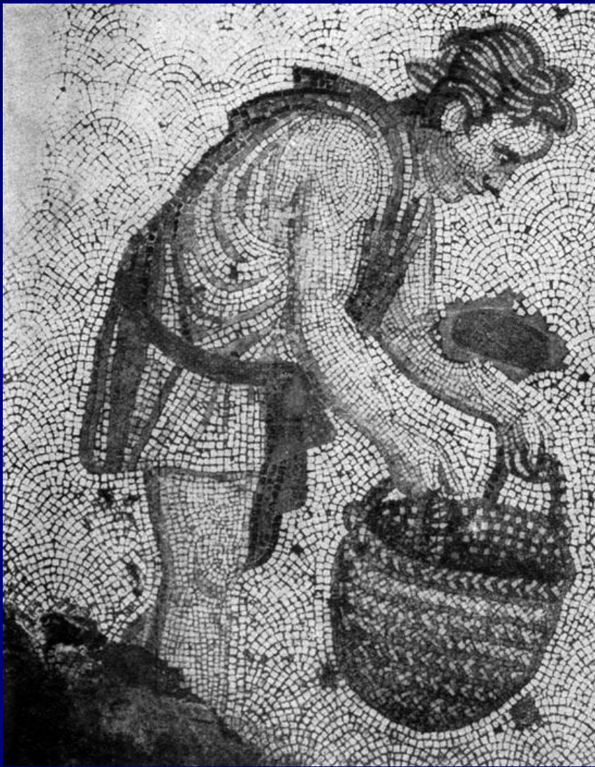
Фрагмент мозаичного пола Большого дворца императоров в Константинополе. 5 в.