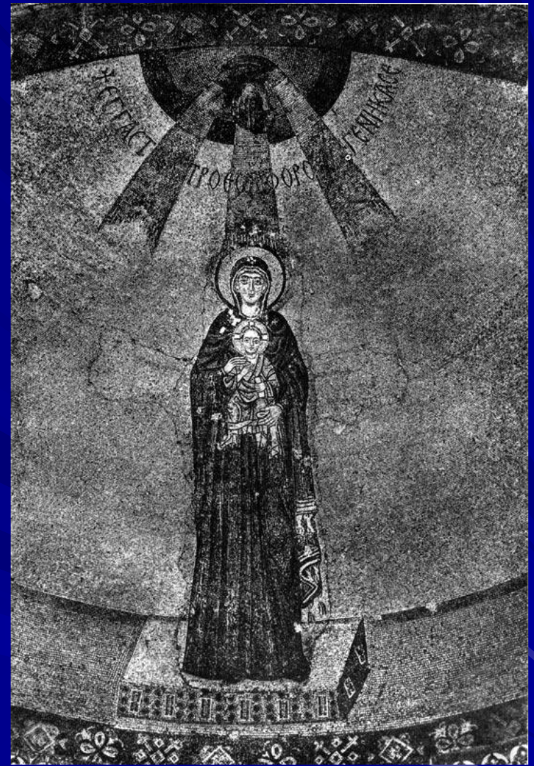
Богоматерь с младенцем. Мозаика абсиды церкви Успения в Никее. Вскоре после 787 г.