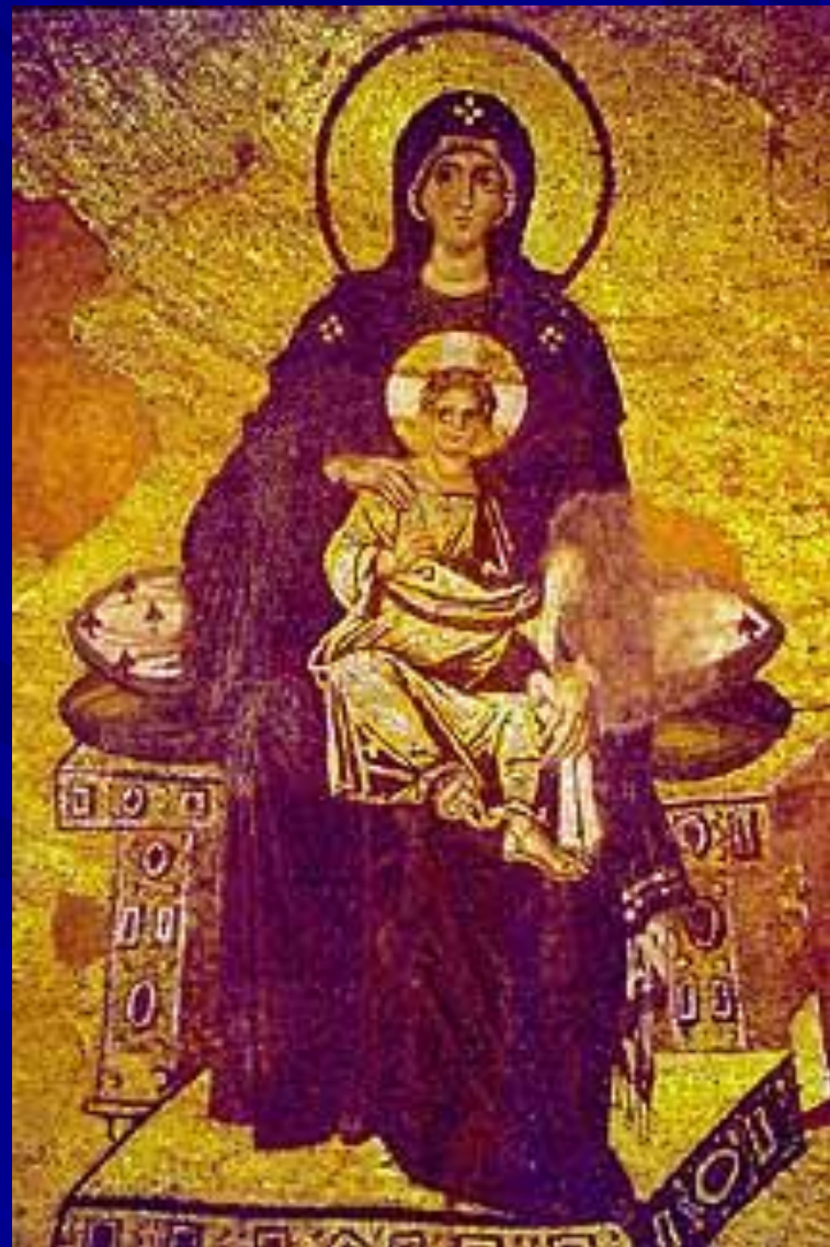
Богоматерь с младенцем. Мозаика. Собор Св.Софии в Константинополе