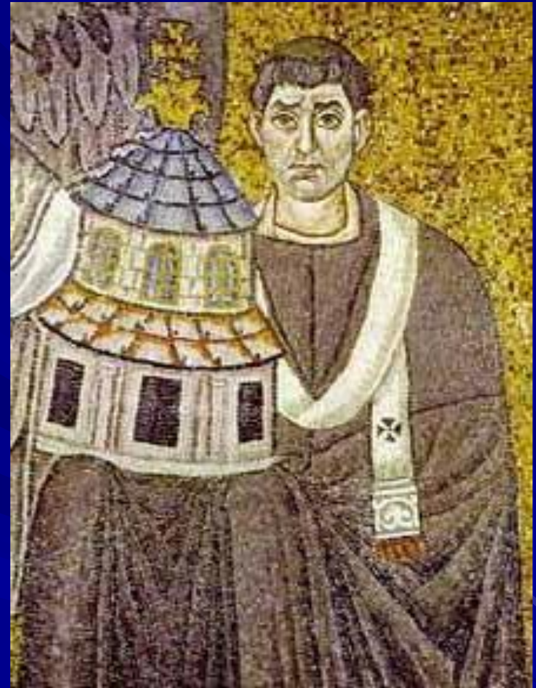
S. Vitale, Ravenna Apse mosaic Detail