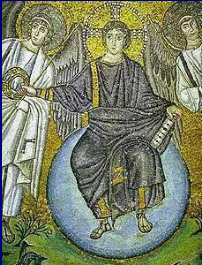
S. Vitale, Ravenna Apse mosaic Detail