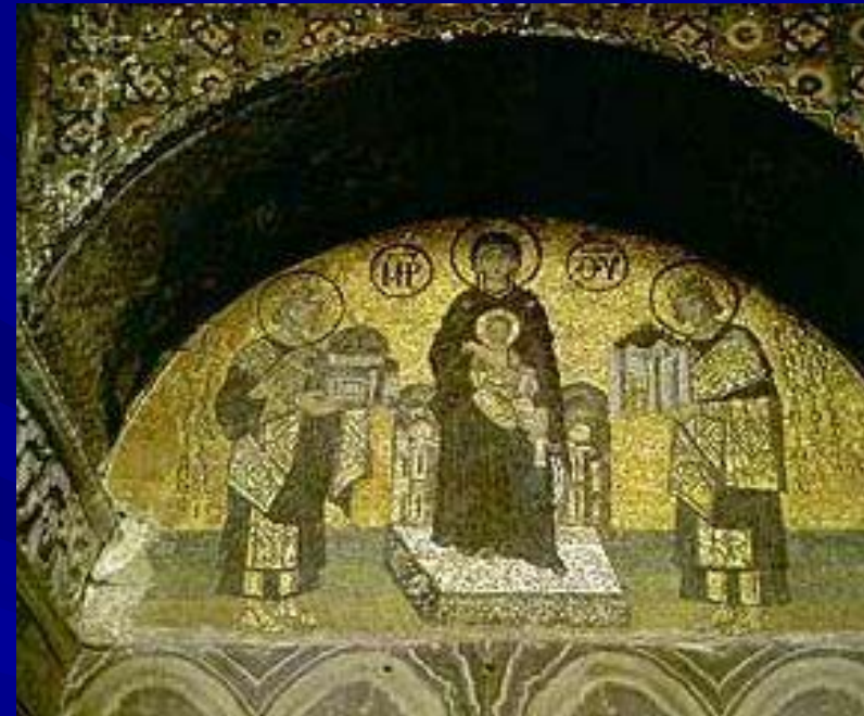
Приношение даров Константином и Юстинианом Мозаика в южном вестибюле Святой Софии Константинополь 11 век