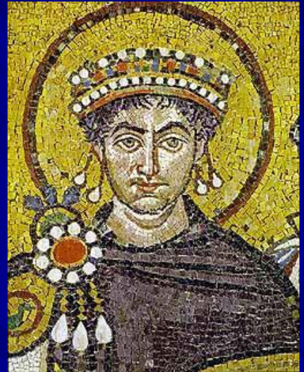
Justinian, detail of mosaic S. Vitale, Ravenna