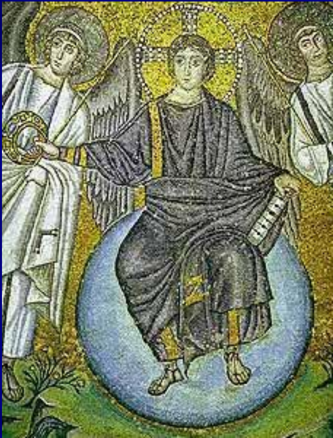
S. Vitale, Ravenna Apse mosaic Detail