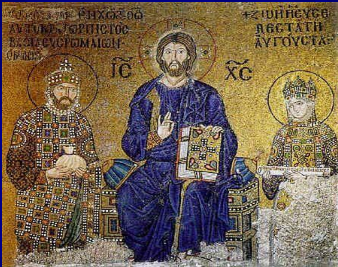
Приношение даров императором Константином IX Мономахом и императрицей Зоей