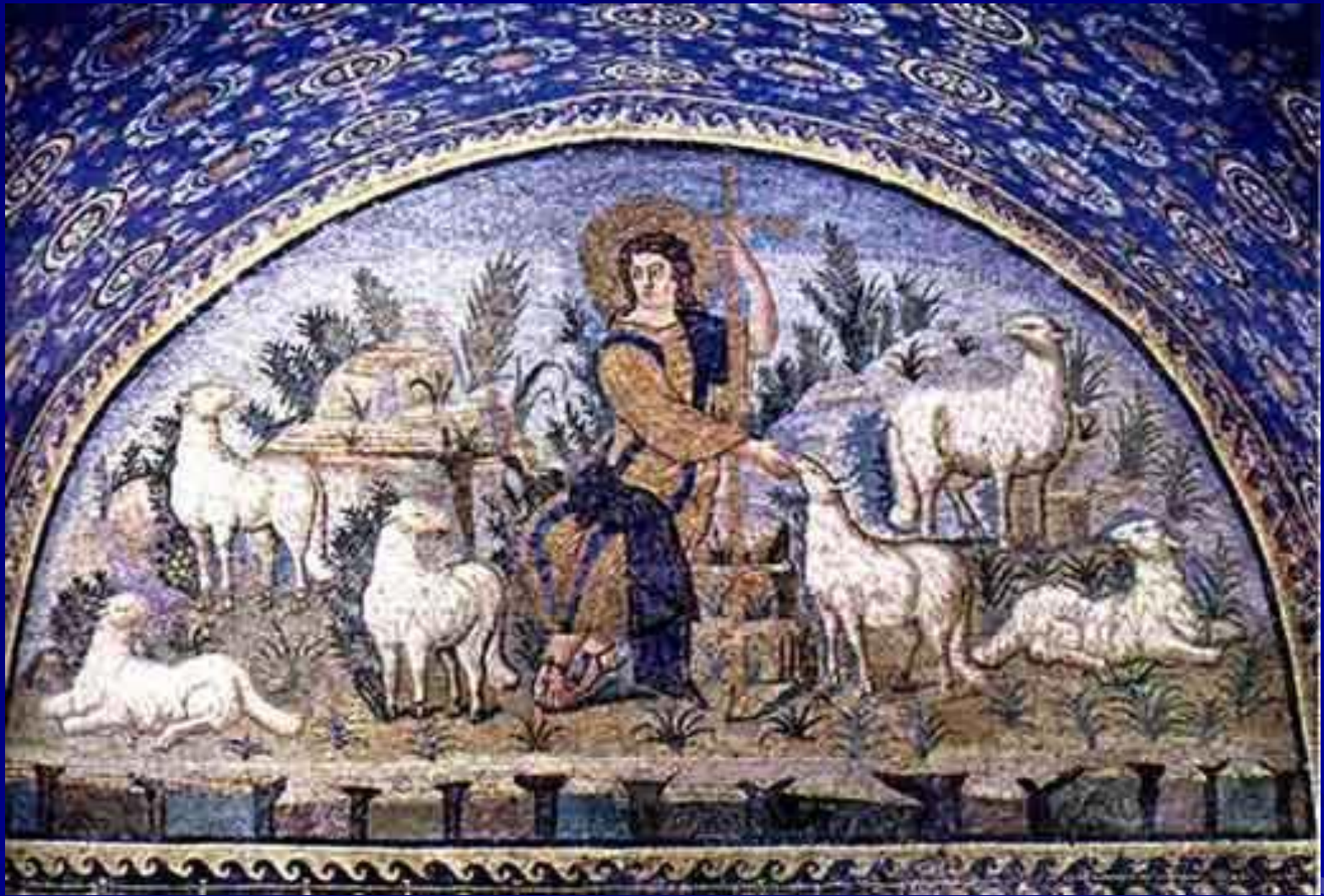
Добрый пастырь. Мавзолей Галлы Плацидии. Равенна