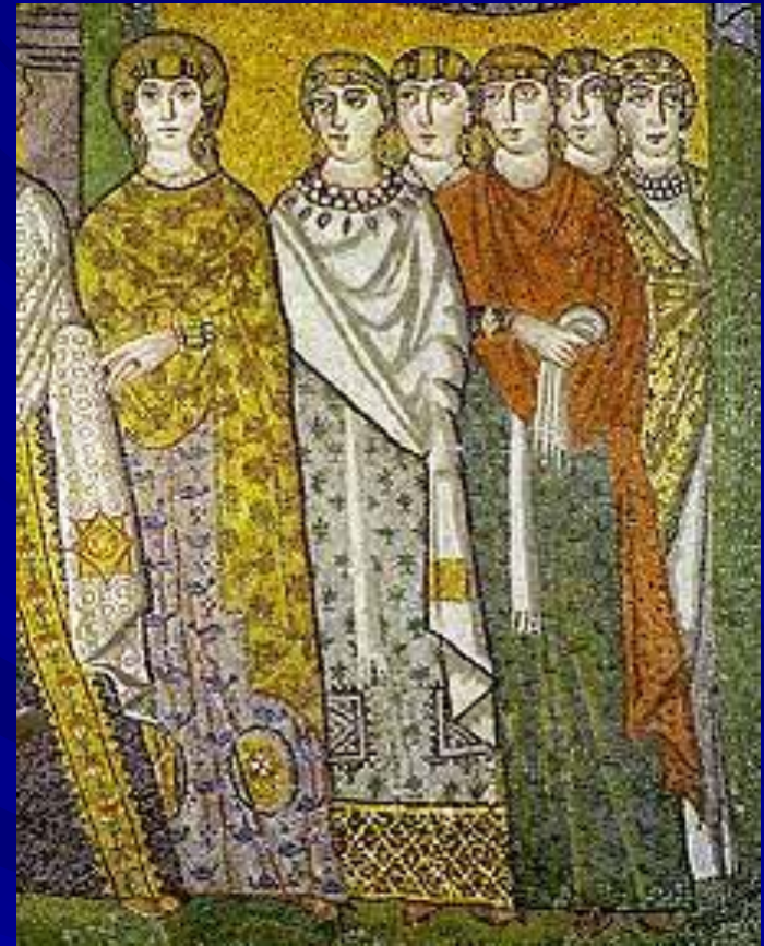
Theodora with courtiers Detail S. Vitale, Ravenna