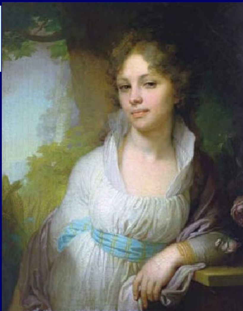
В.Боровиковский. Портрет Марии Лопухиной