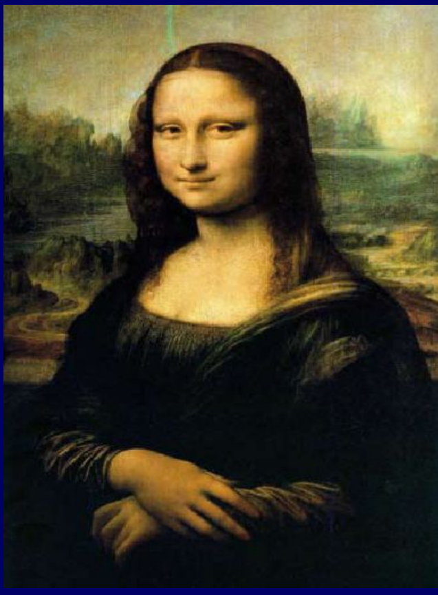
Л. да Винчи «Джоконда»

Федор Степанович Рокотов (1735 -1808) — русский художник, портретист, представитель стиля рококо .