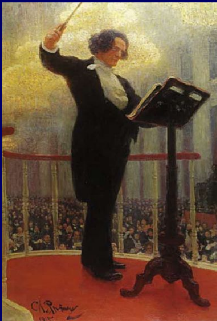
И.Репин. Портрет Антона Рубинштейна