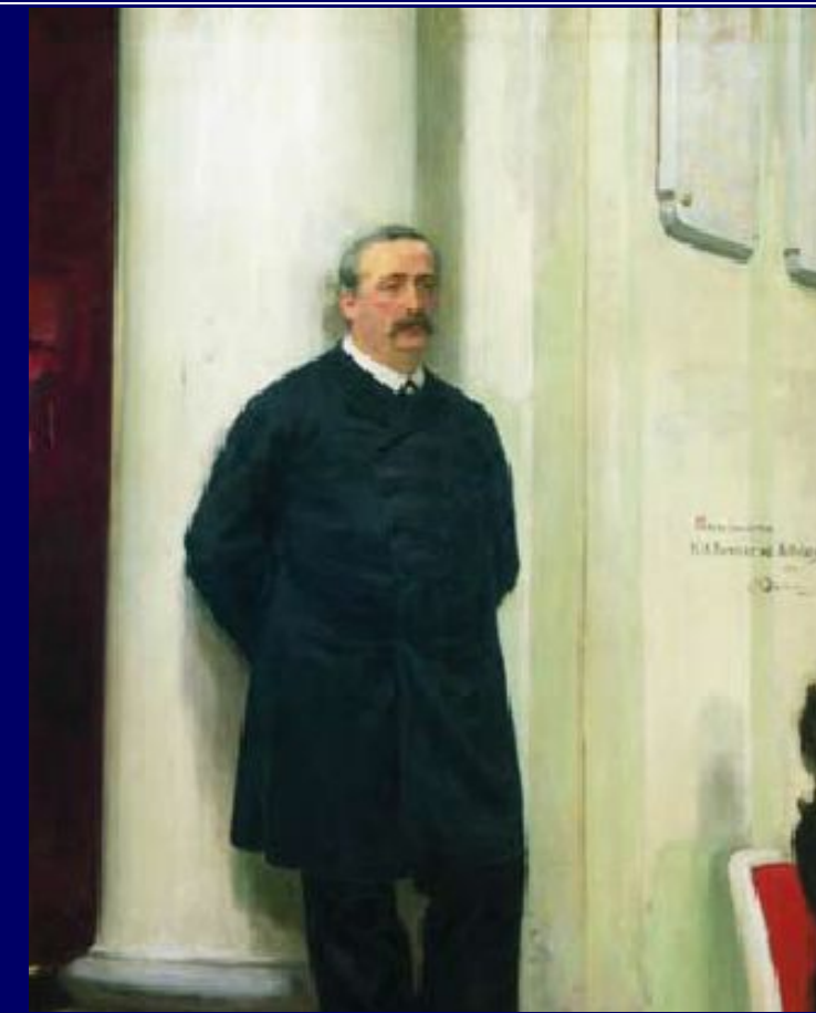
И.Репин. Портрет А.Бородина