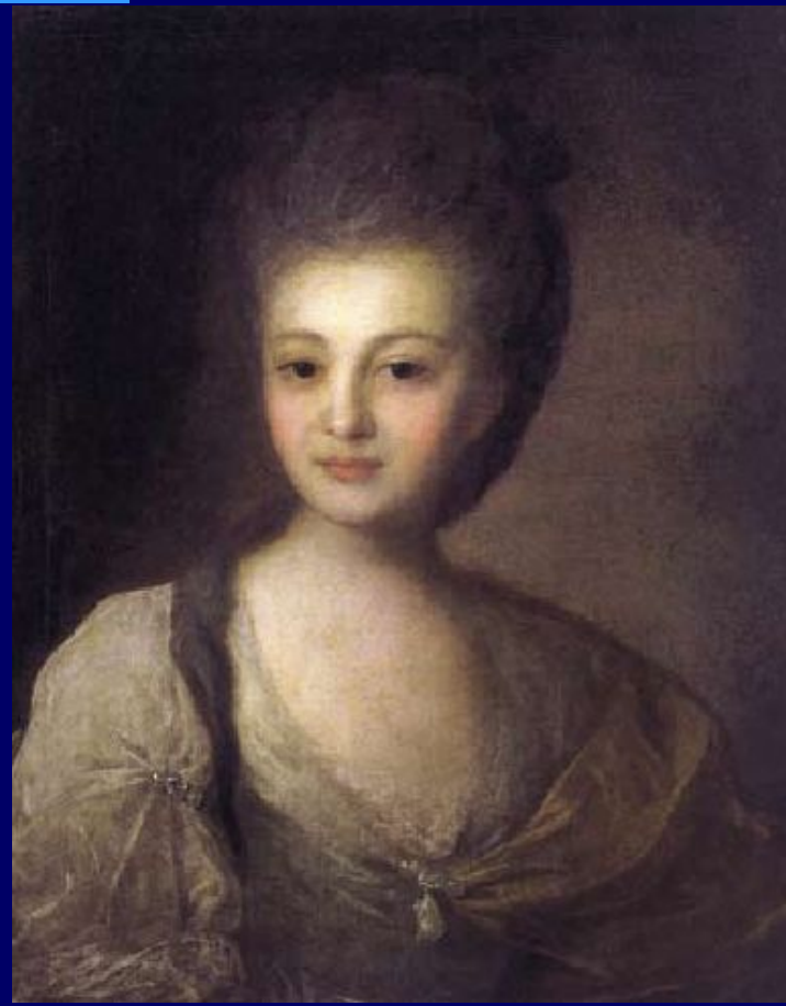
Портрет А.Струйской (1772)