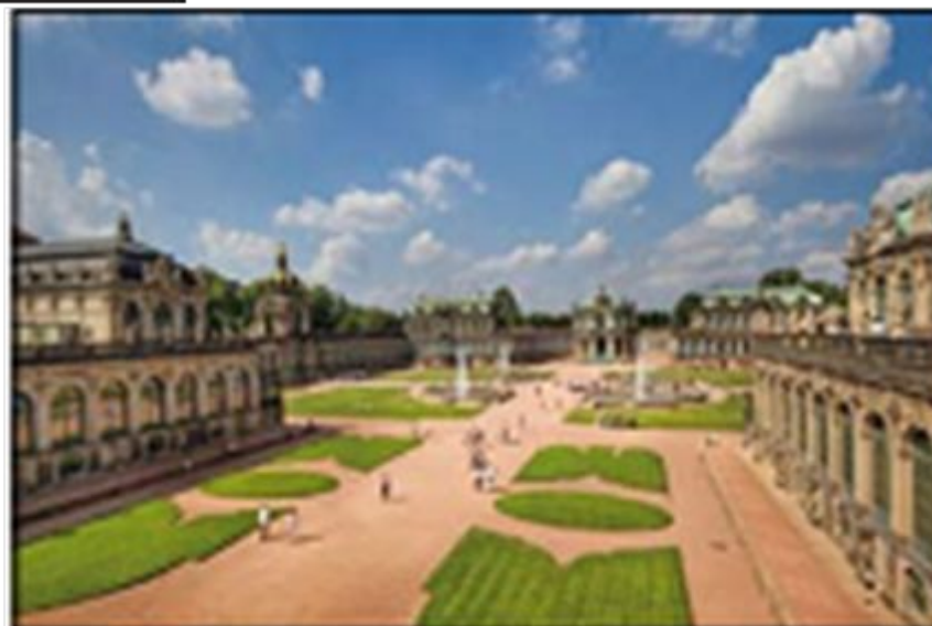
Национальная картинная галерея. Дрезден