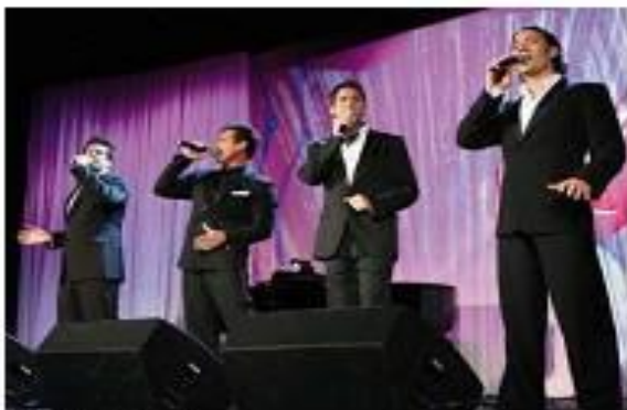
«El Diva». Кларетт «Детская юбка Вилли»