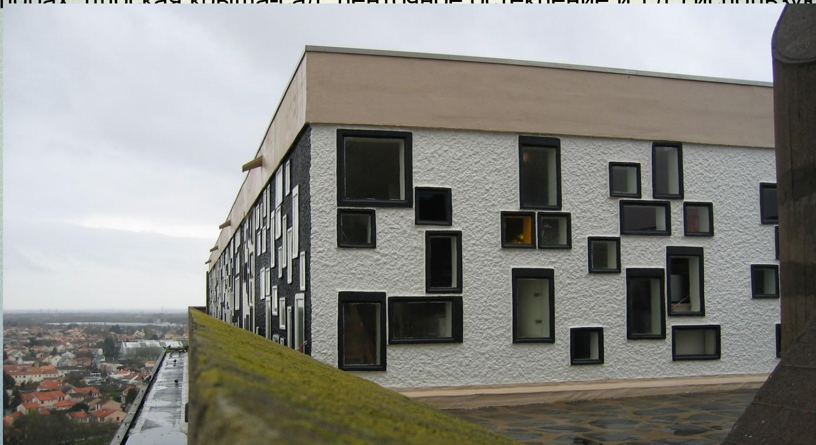
Нант-Резе, многоквартирный дом. Детский сад на крыше. Ле Корбюзье.

Этот поистине величайший архитектор современности насытил теорию функционализма идеологически и практически, его знаменитые принципы построения массового индустриального жилого дома (дом на опорах, плоская крыша-сад, пентхаусное остекление и т.д.) используются и