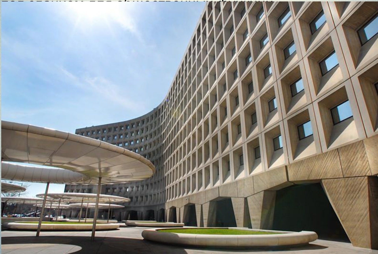
М.Брейер. Уивер билдинг в Вашингтоне, 1968. Здание типично офисной структуры.