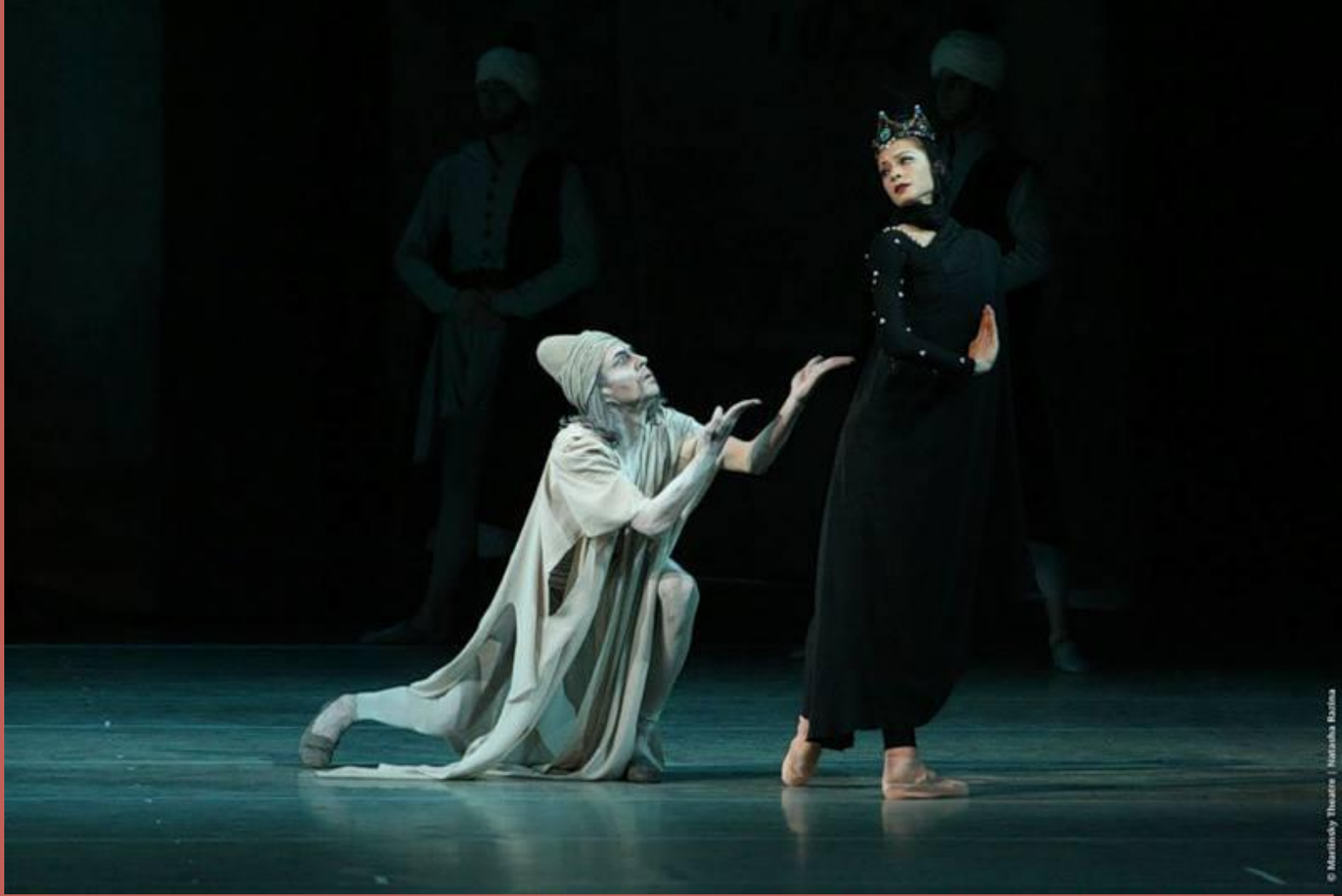
© Marinsky Theatre | Natalia Ruzha