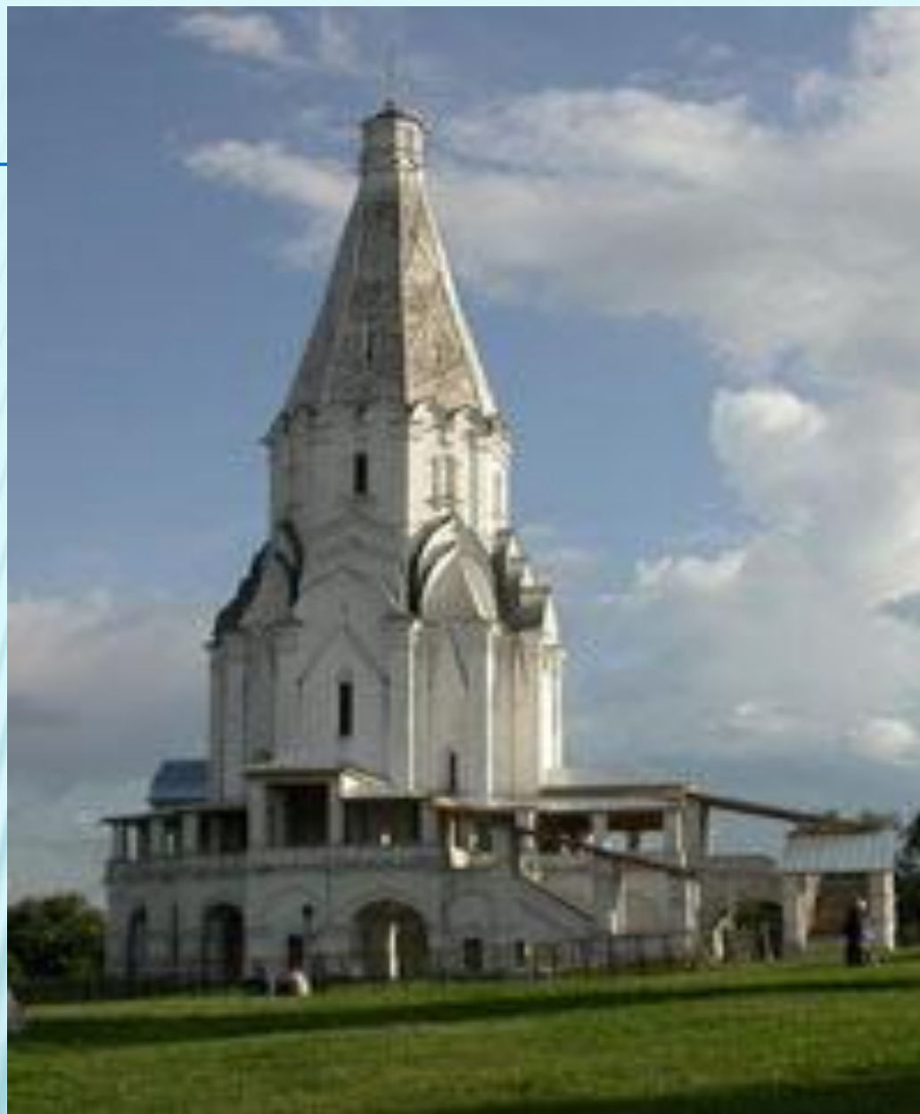
Храм Вознесения в Коломенском