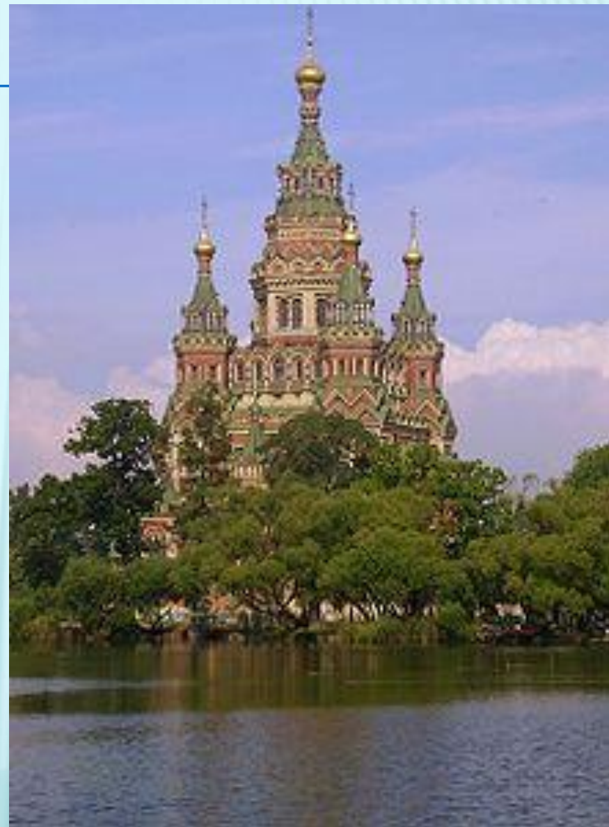
Собор Петра и Павла в Петергофе

происхождение шатрового каменного зодчества от аналогичного по форме шатрового деревянного , столь распространённого на Руси с древности до настоящего времени. «Летописец вкратце Русской земли» под 1532 годом говорит: «Князь великий Василей постави церковь камену Взнесение Господа нашего Исуса Христа вверх на деревяное дело». Это летописное сообщение прямо связывает происхождение шатра с деревянным зодчеством. Выше приводились доказательства раннего происхождения деревянных шатровых храмов и их распространённости. Но если в деревянных церквях шатёр вынужденно сменил купол по конструктивным причинам, то замена купола шатром в каменном строительстве не связана с проблемой конструкции. Причину возникновения каменных шатров следует видеть в желании придать храму определённый образ. С. В. Заграевский отмечает, что и в Москве, и тем более в провинции вытянутые силуэты деревянных шатровых церквей играли ведущую роль.