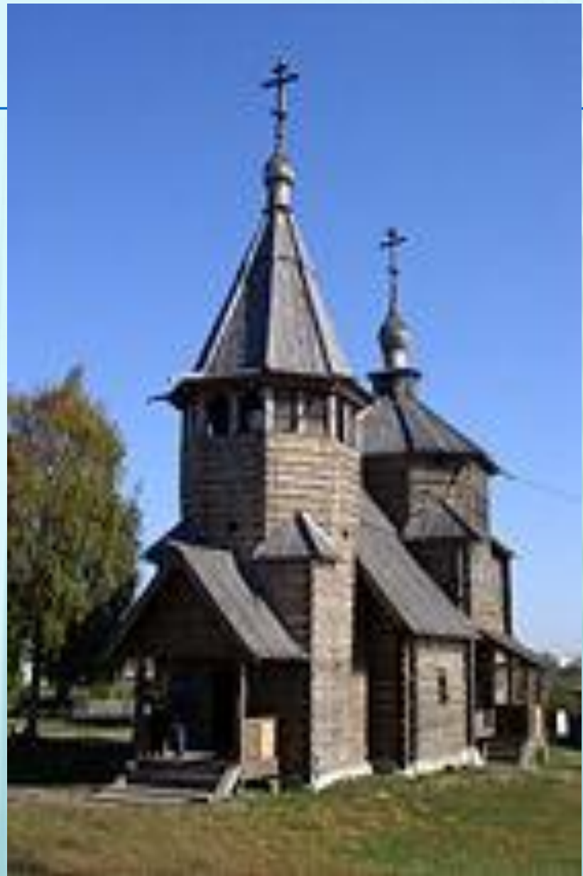
Воскресенская церковь из села Потакино

В шатровом зодчестве выделяли деревянные постройки и каменные. В русском деревянном зодчестве шатёр является распространенной, хотя далеко не единственной, формой завершения деревянных церквей. Так как с древнейших времен деревянное строительство на Руси было преобладающим, то большинство христианских храмов так же строилось из дерева. Типология церковной архитектуры перенималась Древней Русью из Византии. Однако в дереве чрезвычайно трудно передать форму купола — необходимого элемента храма византийского типа. Вероятно, именно техническими трудностями вызвана замена в деревянных храмах куполов шатровыми завершениями. Конструкция деревянного шатра проста, её устройство не вызывает серьёзных затруднений. Хотя самые ранние известные деревянные шатровые храмы относятся к XVI веку, есть основания думать, что и раньше в деревянном зодчестве была распространена форма шатра