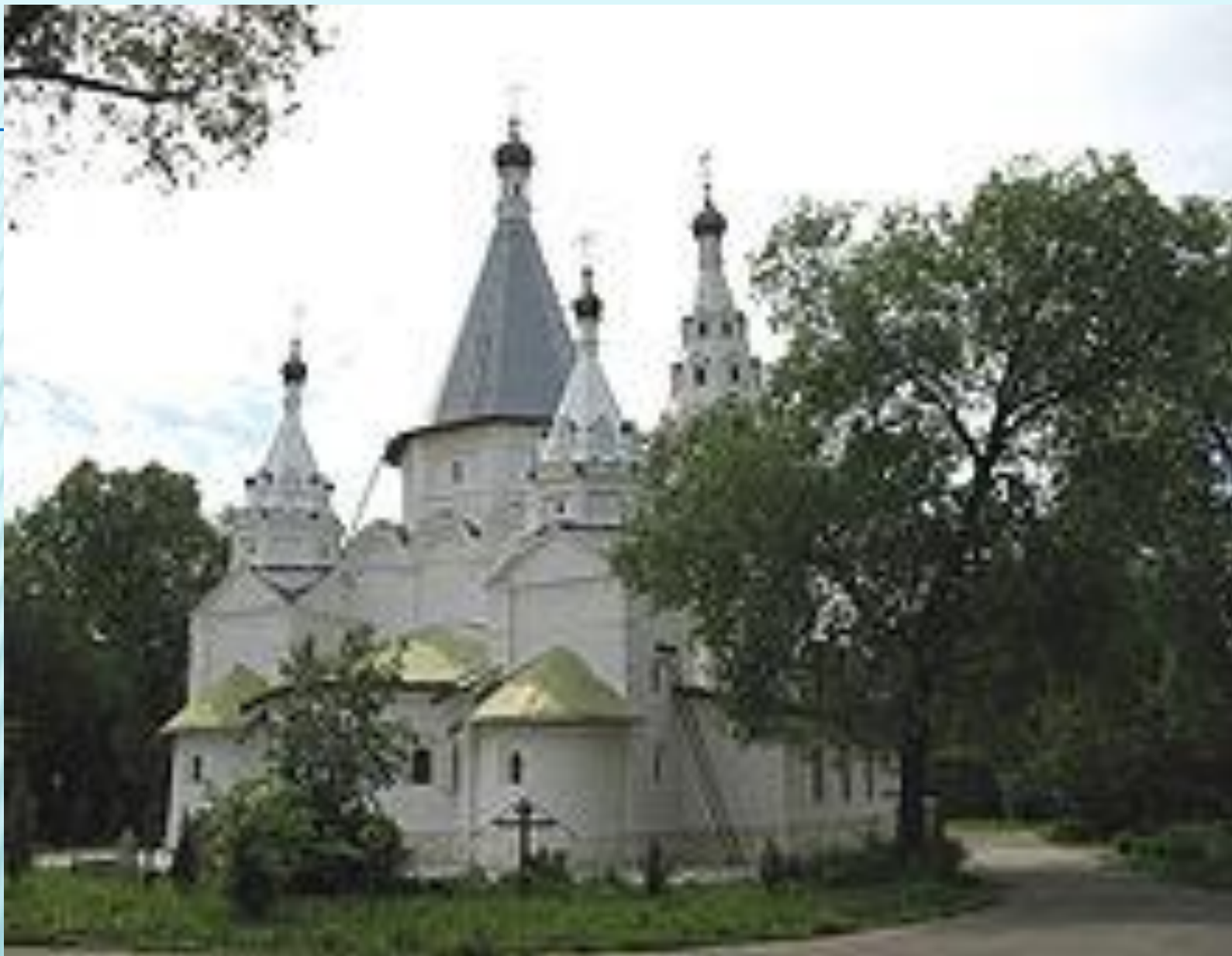
Церковь в Троицком-Голенищеве