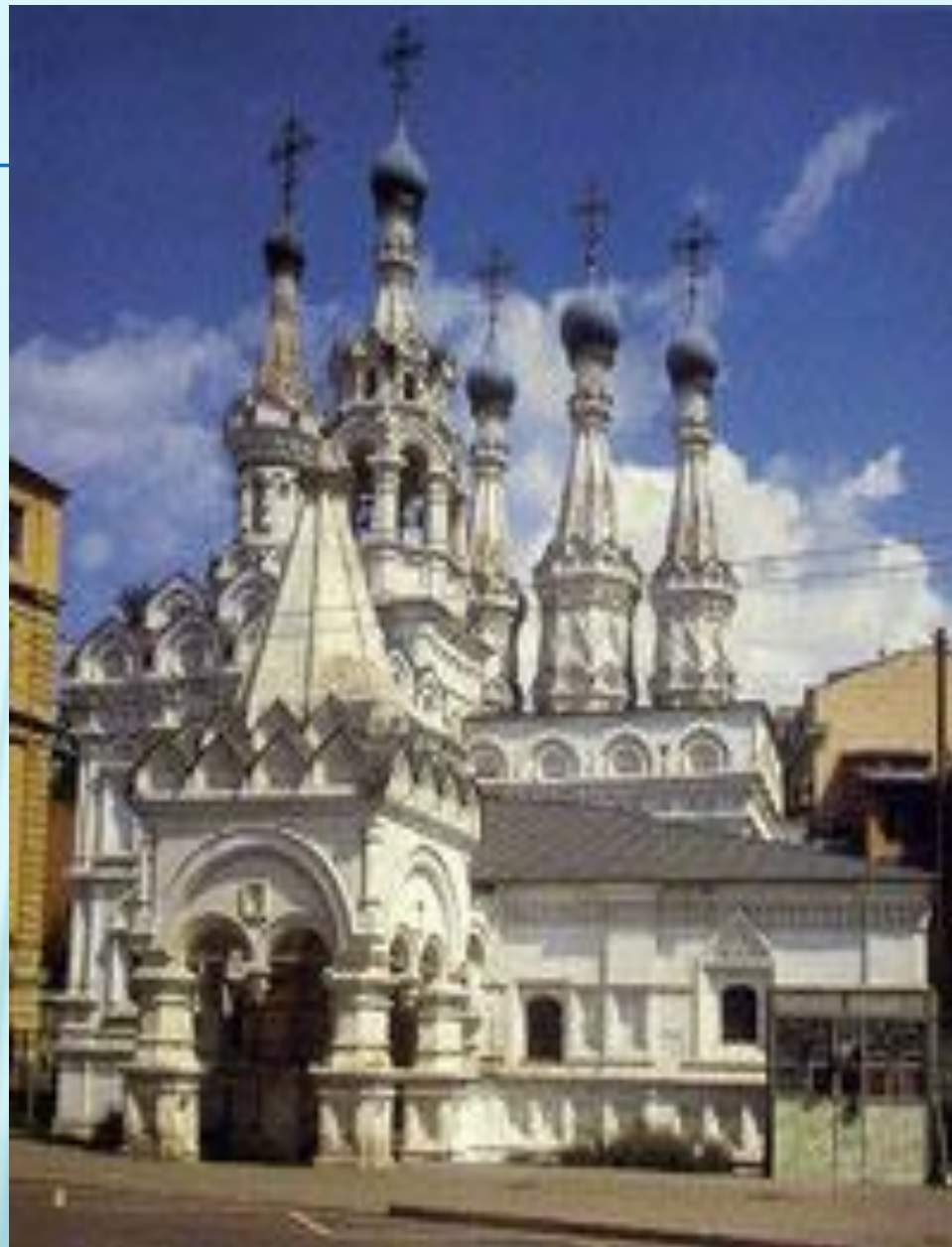
Церковь Рождества Богородицы в Путинках

Шатровое зодчество XVI–XVII вв., черпающее свое начало в традиционной русской деревянной архитектуре, является уникальным направлением русского зодчества, которому нет аналогов в искусстве других стран и народов. Шатровые храмы Московского государства – неповторимый вклад России в мировую культуру.