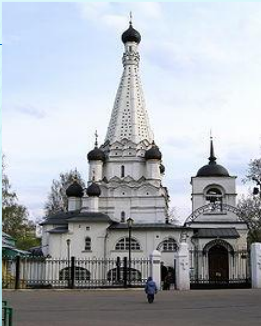
Церковь Покрова в Медведкове