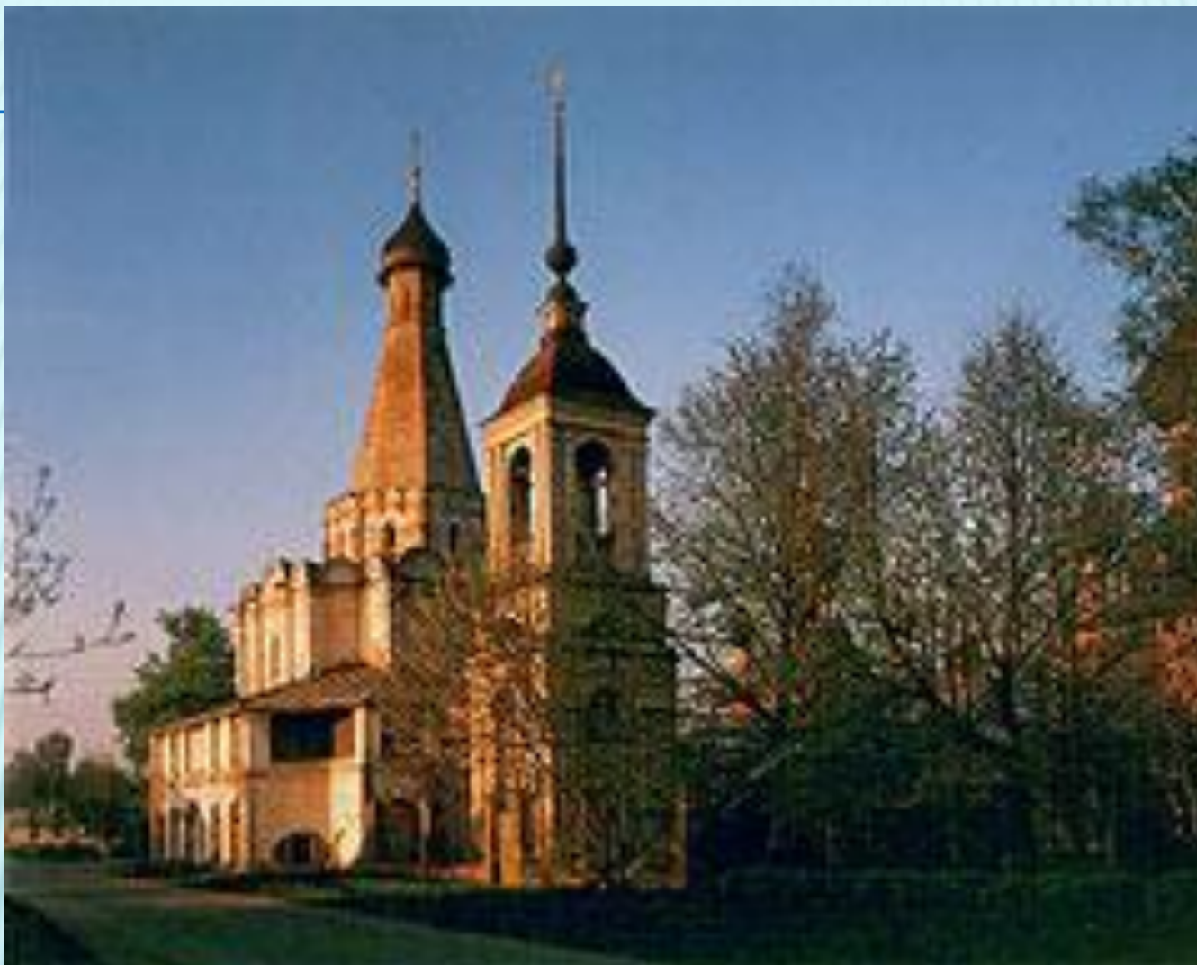
Церковь во имя митрополита Петра в Переславле Залесском