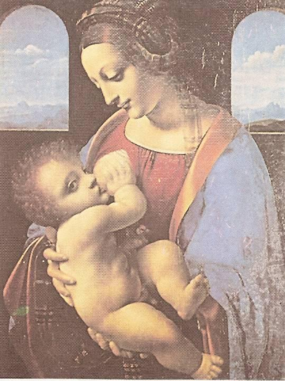
Мадонна Литта. Эрмитаж, Санкт- Петербург.