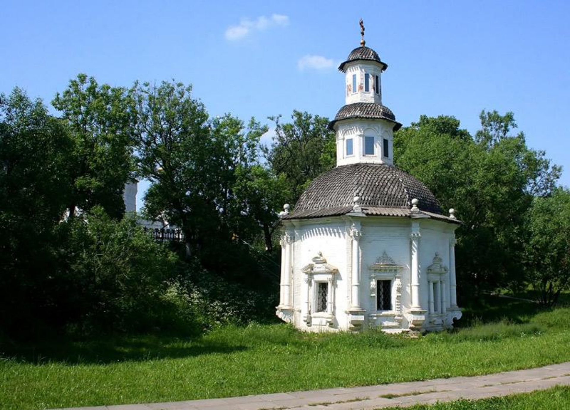
Часовня Пятницкого Колодца в Сергиевом Посаде Московской области.