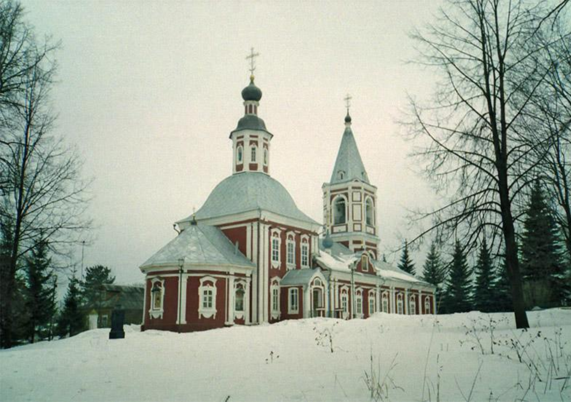
Церковь Илии Пророка в г. Сергиев Посад Московской области