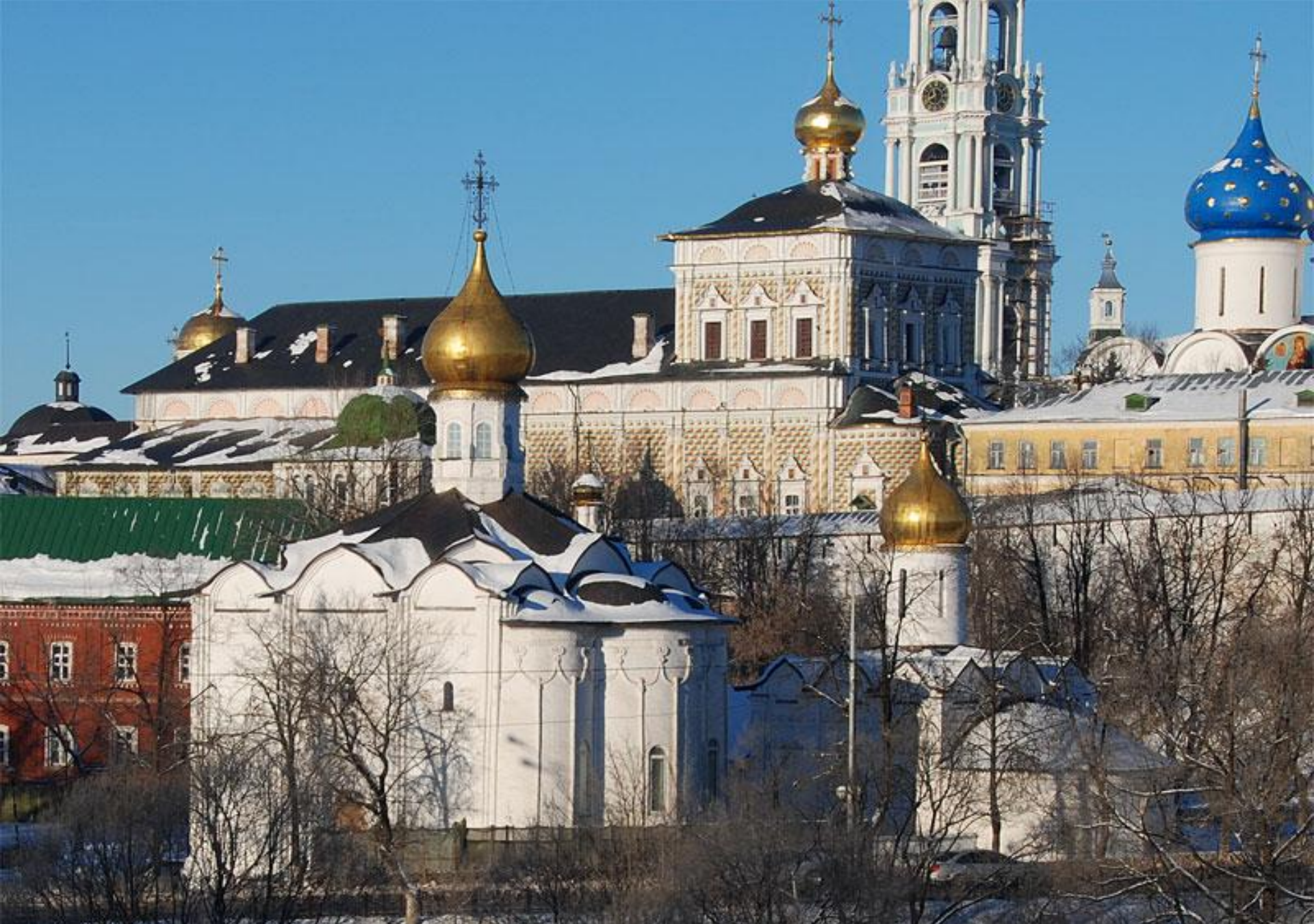
Введенская церковь на Подоле (слева) и Пятницкая церковь на Подоле (справа) в Санкт-Петербурге