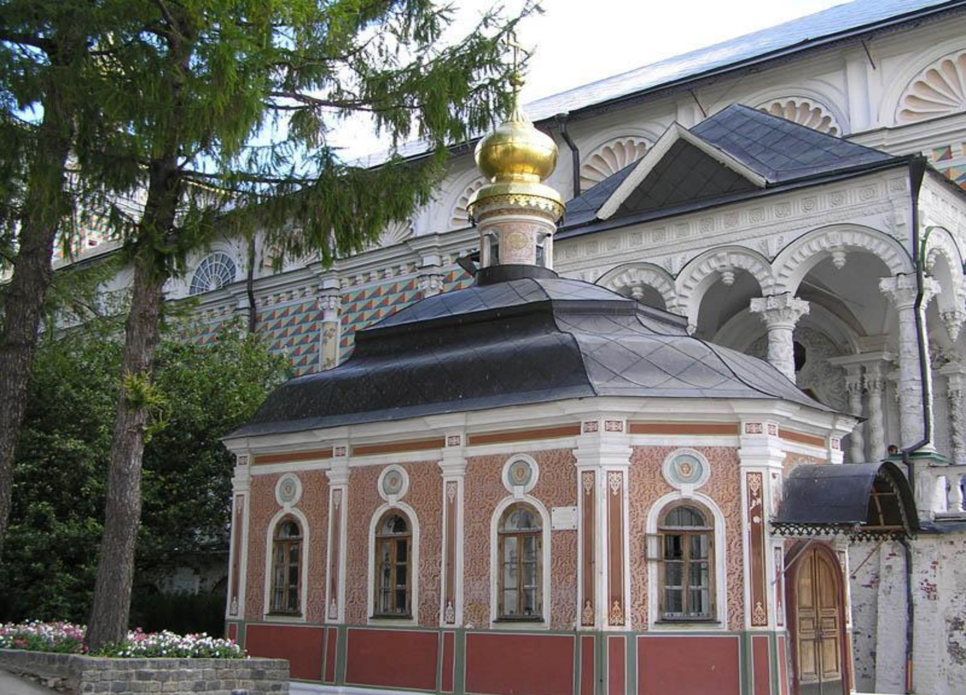
Михеевская церковь в Троице-Сергиевой лавре. На заднем плане Сергиевская