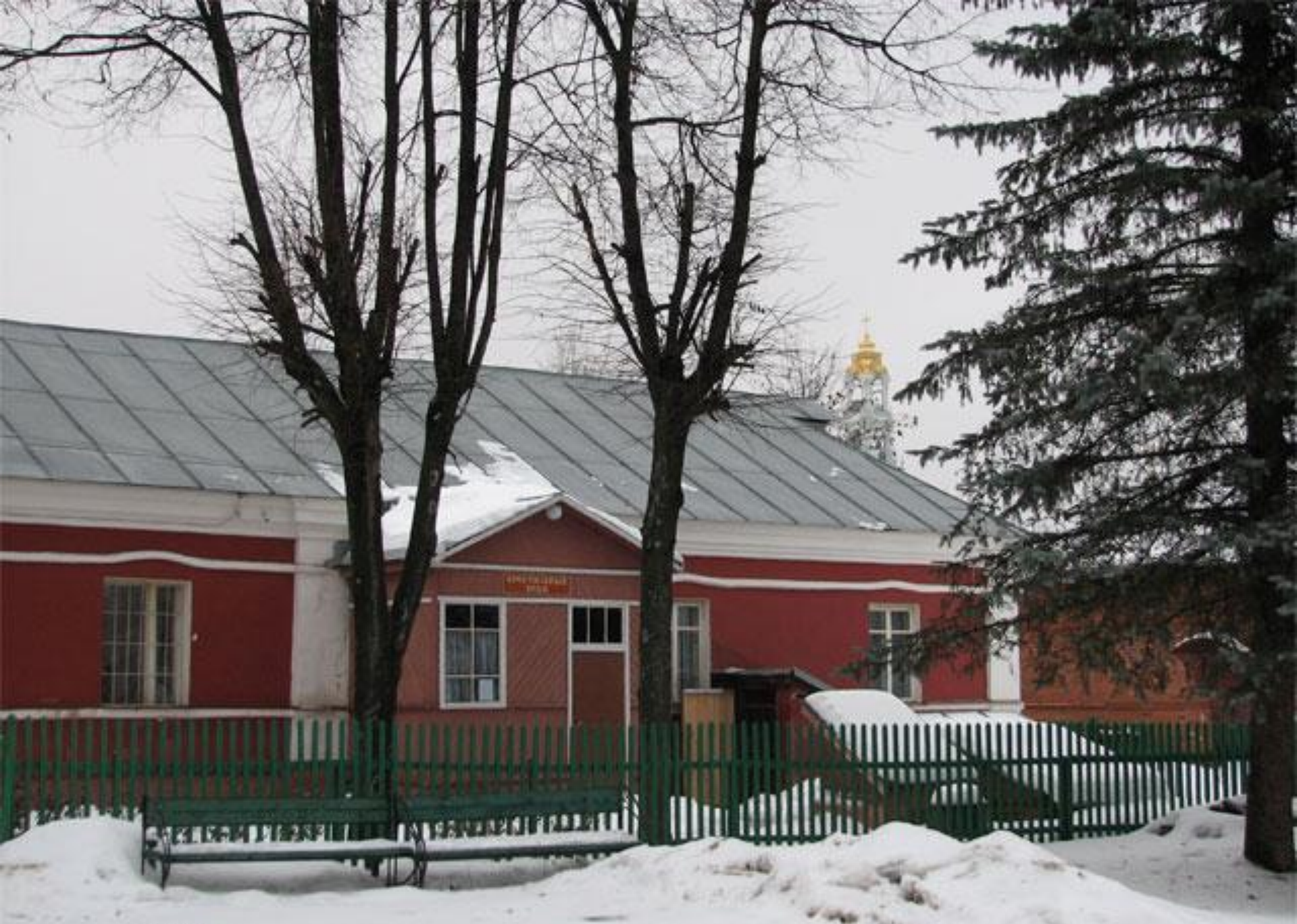
Дом причта Ильинской церкви Сергиева Посада, в котором помещается Казанский