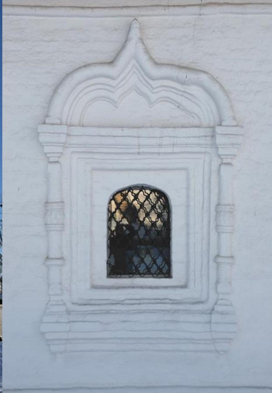
Окно Пятницкой церкви