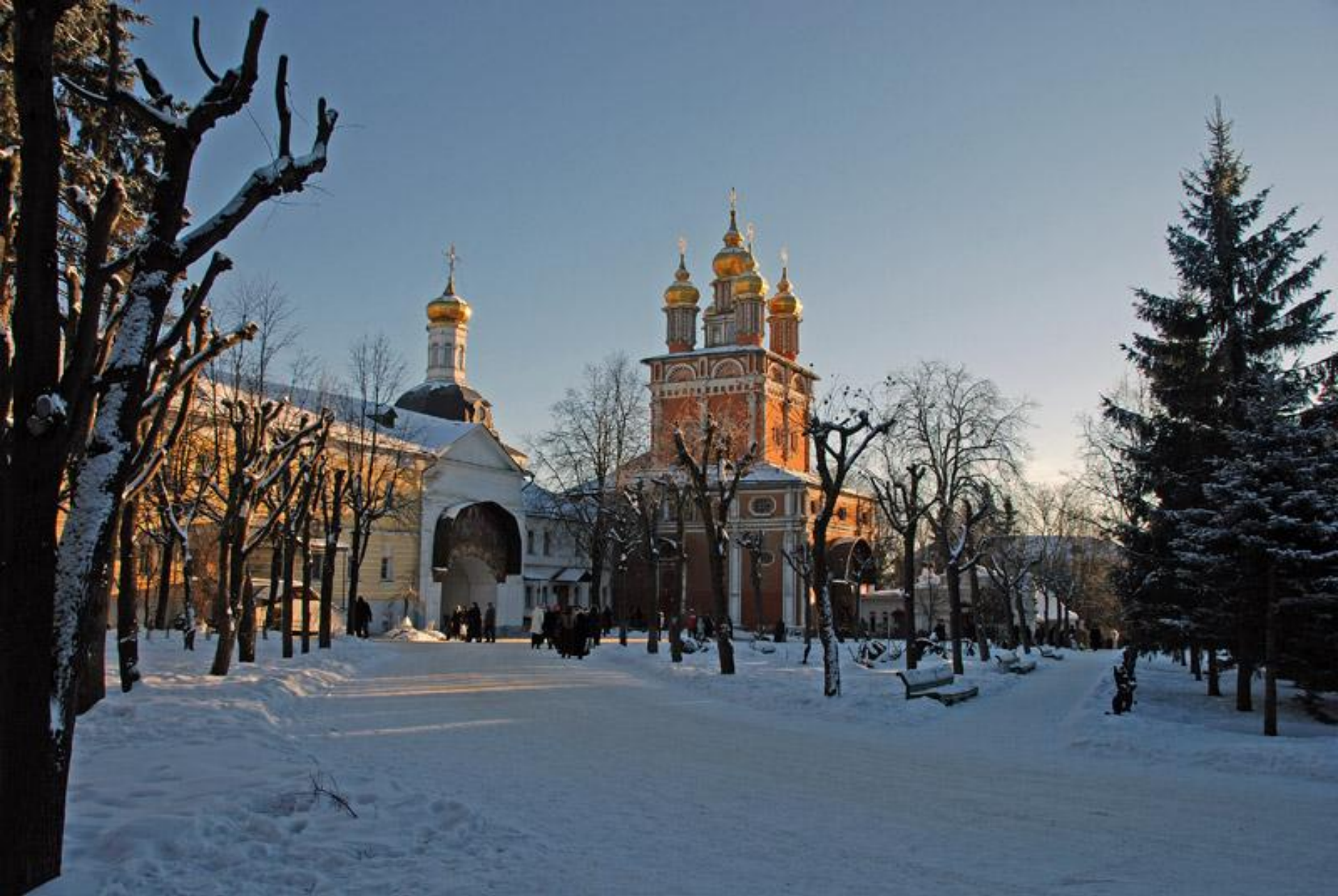
Троице-Сергиева лавра в Сергиевом Посаде Московской области. В центре надвратная Предтеченская церковь, слева от нее Успенские ворота монастыря.