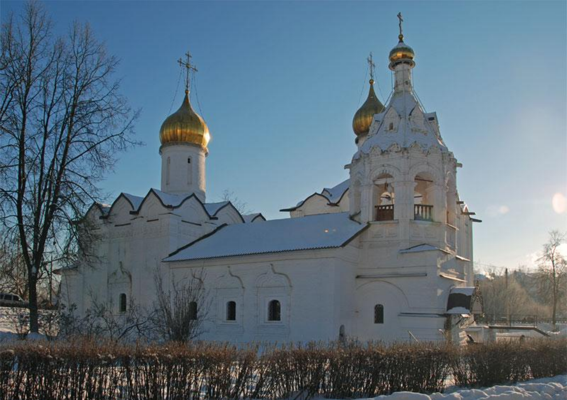
Пятницкая церковь на Подоле в Сергиевом Посаде Московской области. На заднем