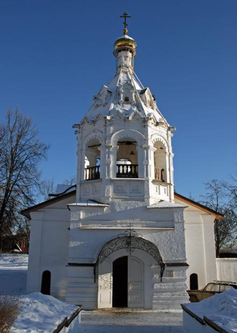
Колокольня Пятницкой церкви