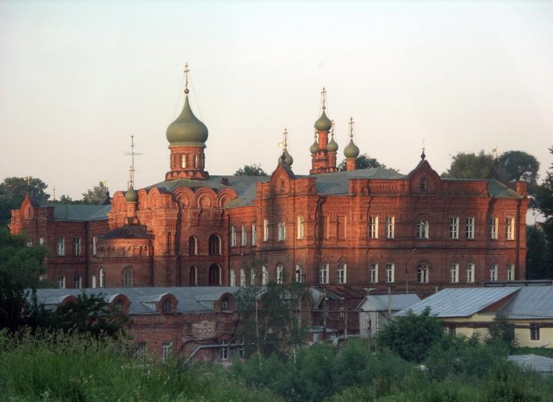
Церковь Иоанна Постовника при Московской духовной семинарии в Троице