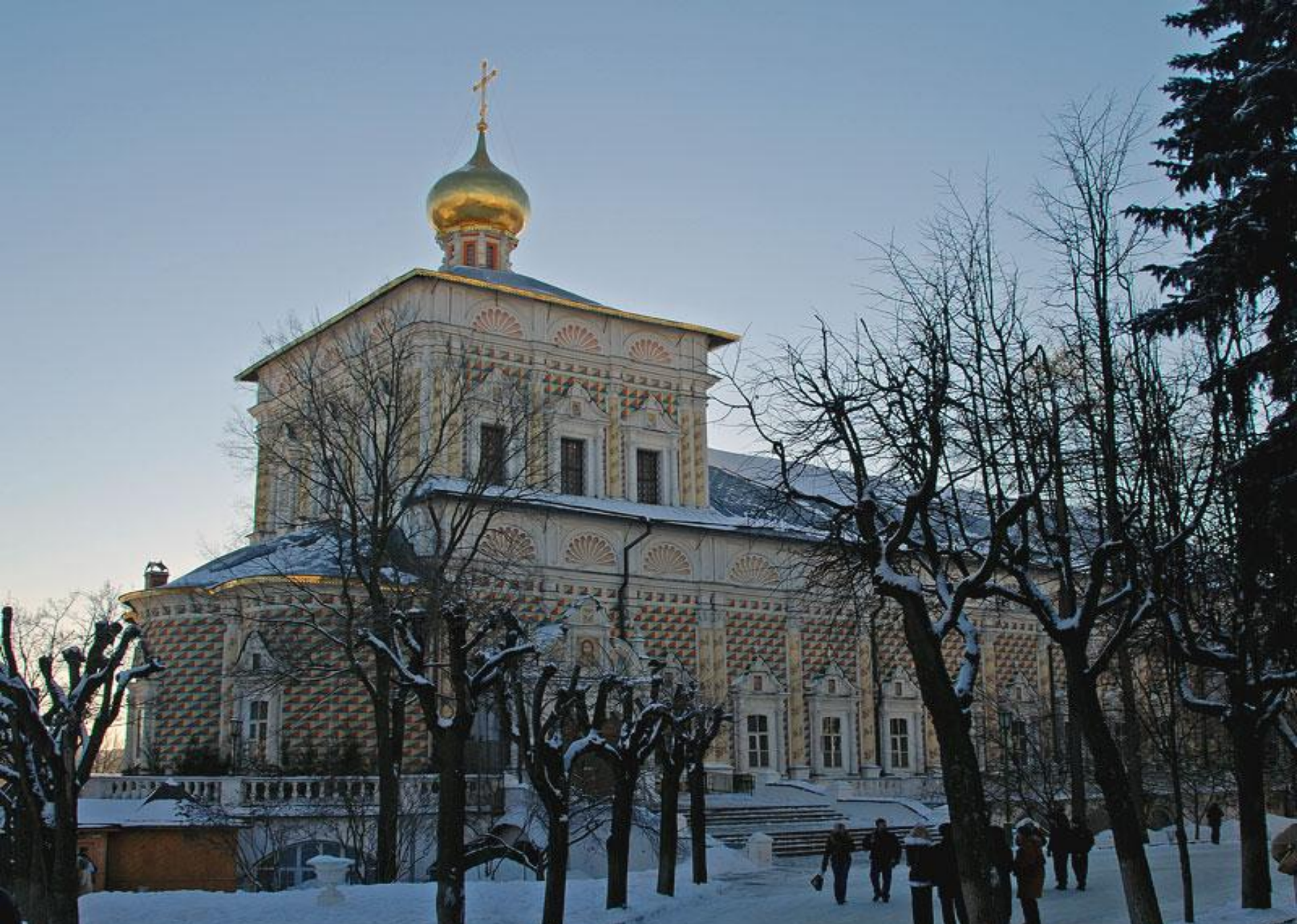
Сергиевская церковь с трапезными палатами в Троице-Сергиевой лавре. 4 января