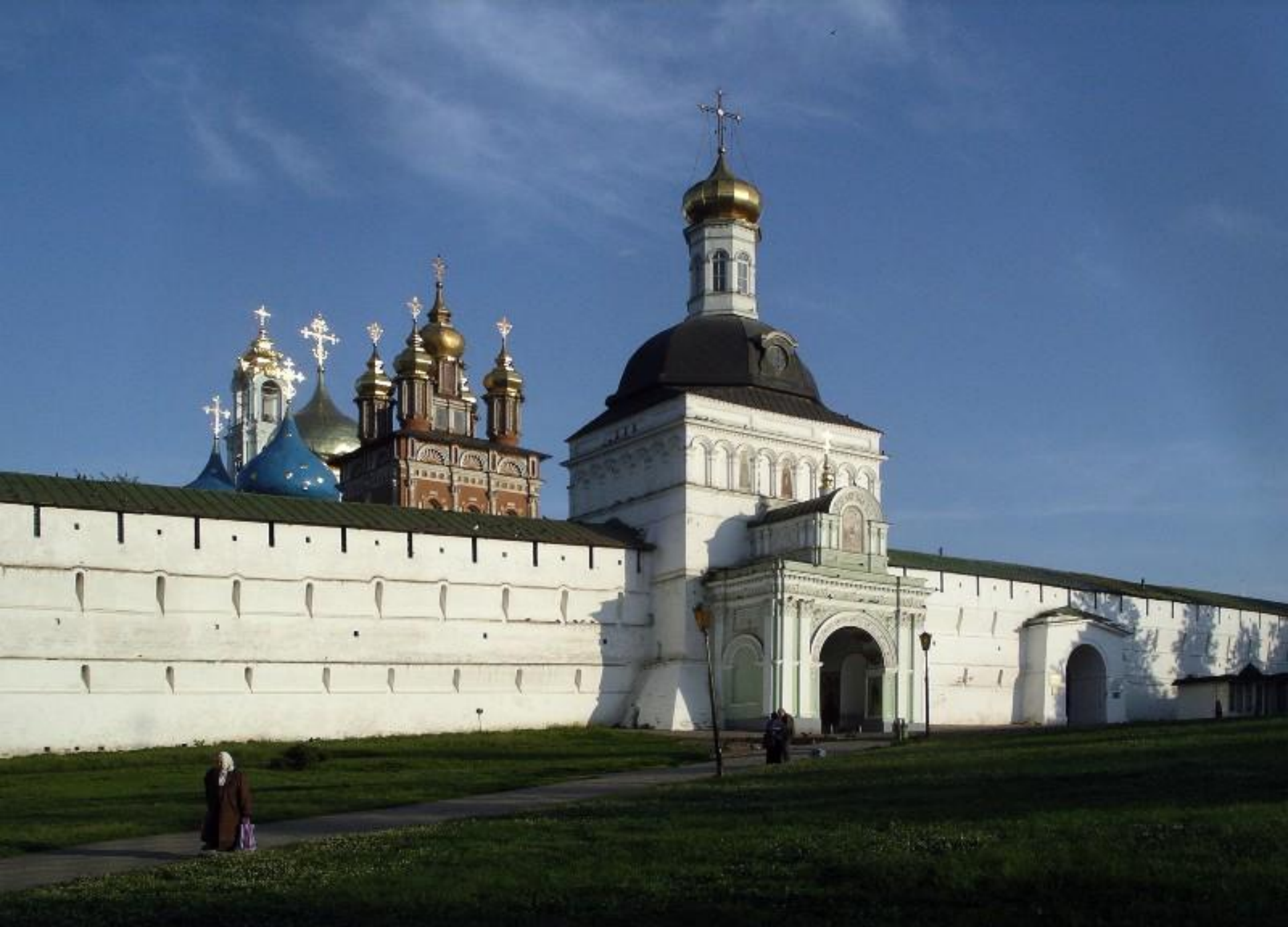
Троице-Сергиева лавра. Святые ворота, за оградой видна Предтеченская