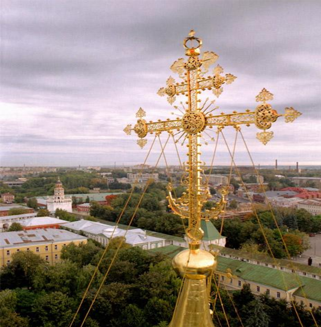
Крест на большом куполе Успенского собора Троице-