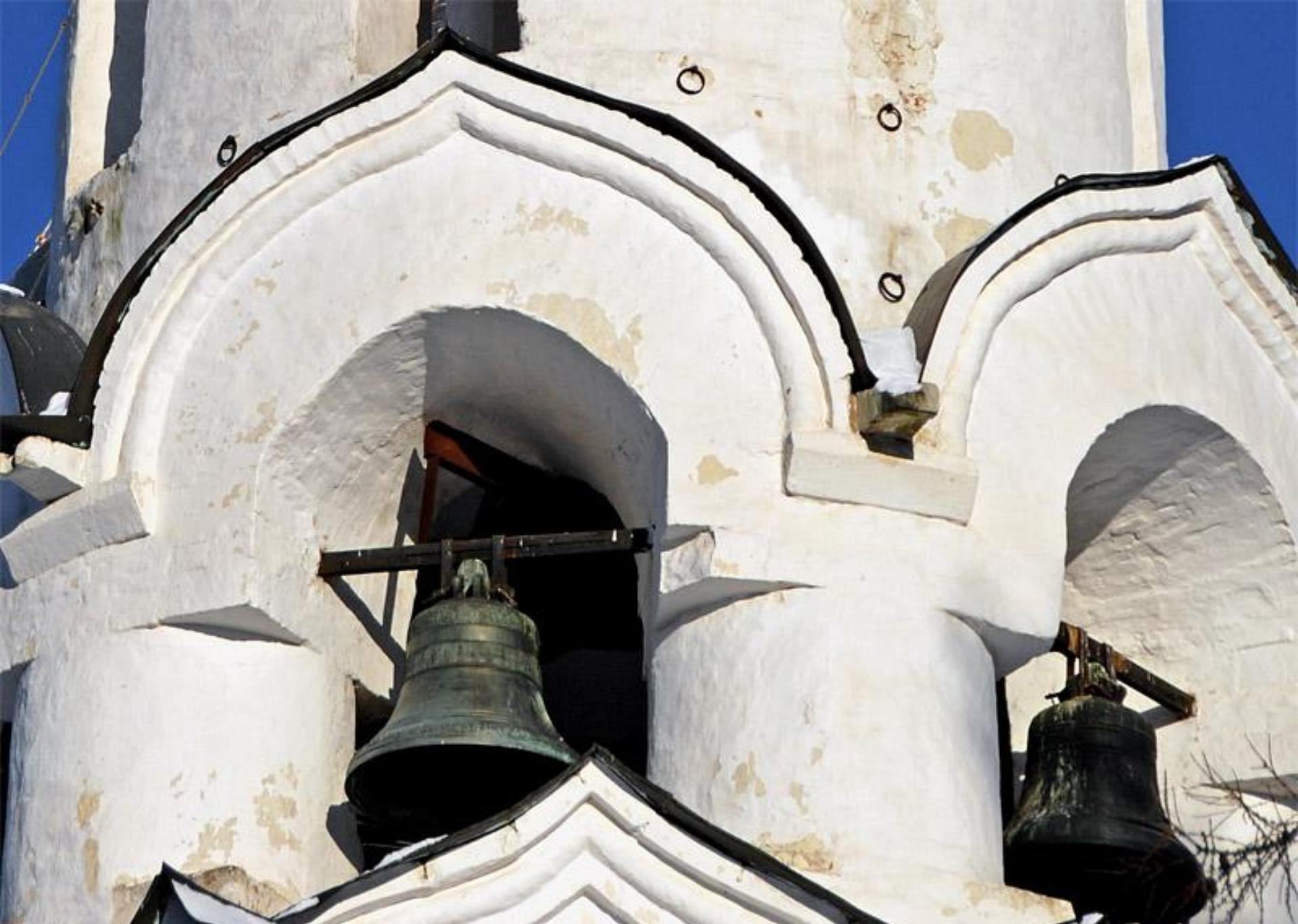
Ярус звона на главке Святодуховской церкви в Троице-Сергиевой лавре в