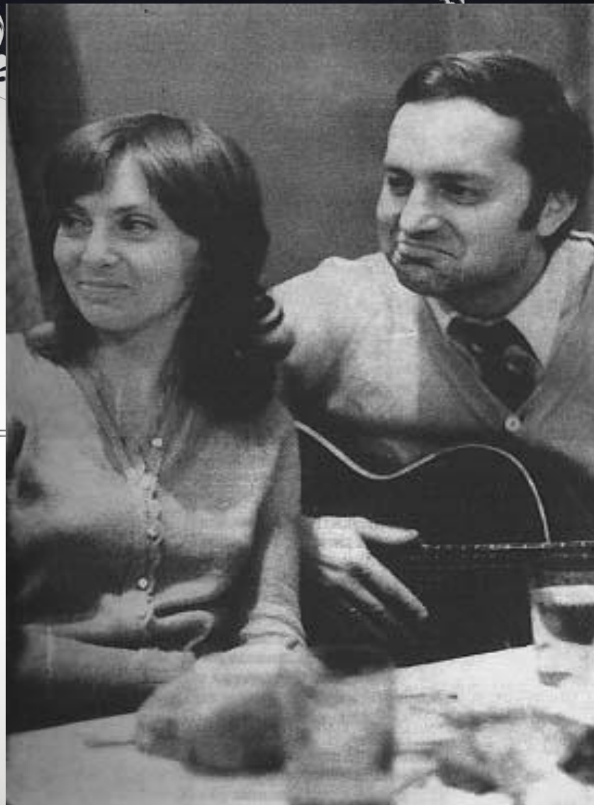
"Единомышленники" (80-е годы)

1980 Москва слезам не верит фильм композитор исполнитель