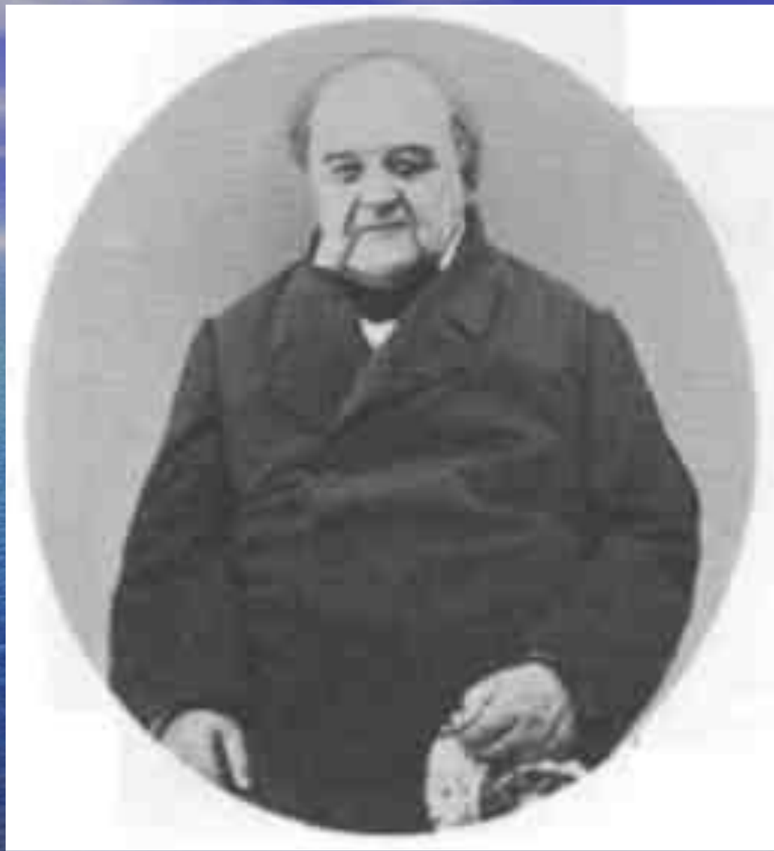
Михаил Семёнович Щепкин.