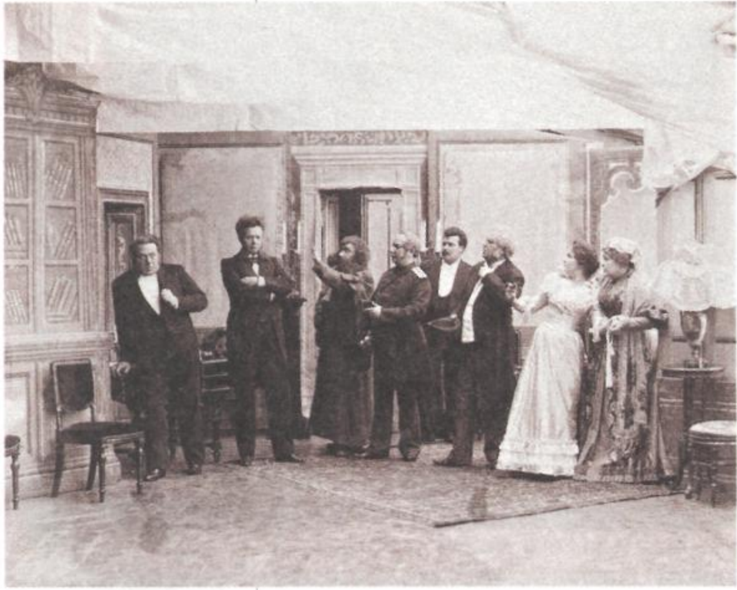
Сцена из спектакля «Свадьба Кречинского» (пьеса А. В. Сухово-Кобылина). Театр Корша, Москва. 1898 г.