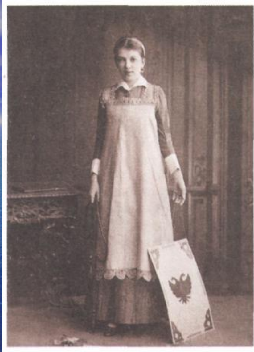
Мария Гавриловна Савина (1854—1915) в роли Верочки в спектакле «Месяц в деревне» (пьеса И. С. Тургенева). Актриса была организатором Русского театрального общества (ныне Союз театральных деятелей России).