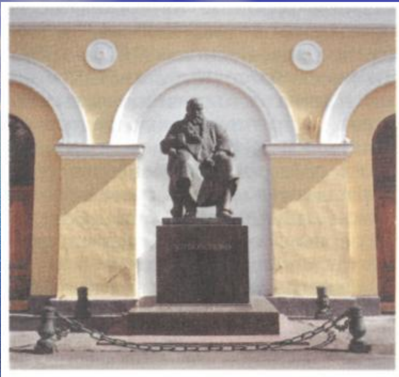
Памятник А.Н. Островскому у входа в Малый театр, Москва.