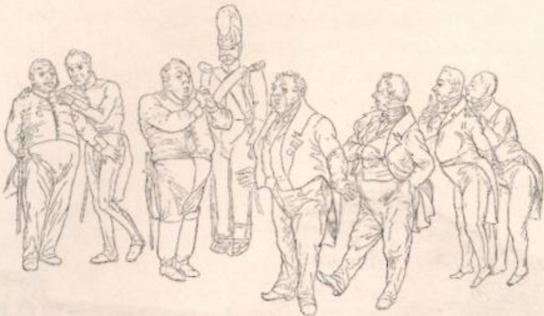
Сцена из спектакля «Ревизор». Рисунок Н.В. Гоголя. Вполне вероятно, что в фигуре Городничего автор изобразил М.С. Щепкина.