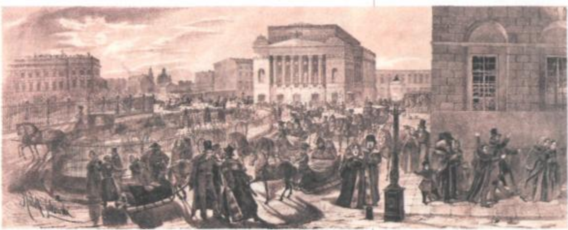
Разъезд зрителей из Александринского театра. Литография Р. Жуковского. 1824 г.