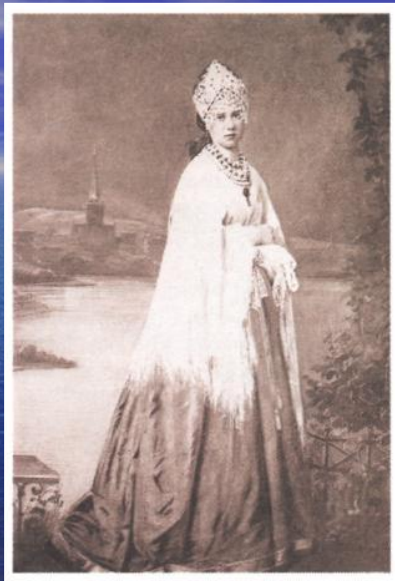
Г. Н. Федотова в роли Катерины (пьеса А. Н. Островского «Гроза»). Малый театр, Москва. 1866 г.