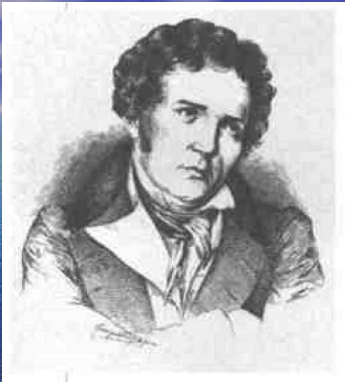
П.С. Мочалов в роли Мейнау (пьеса А. Коцебу «Ненависть к людям и раскаяние»).