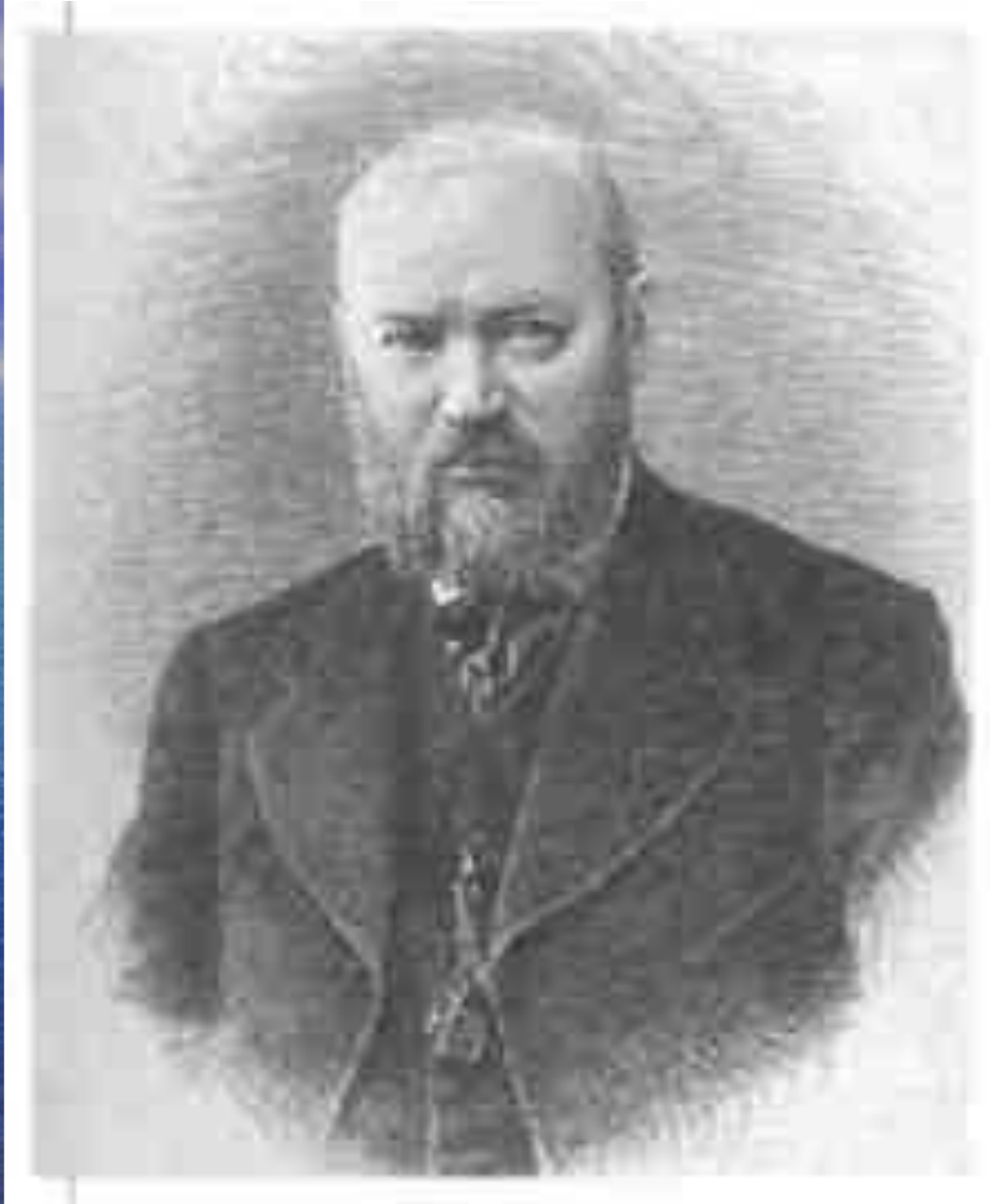
Александр Николаевич Островский.