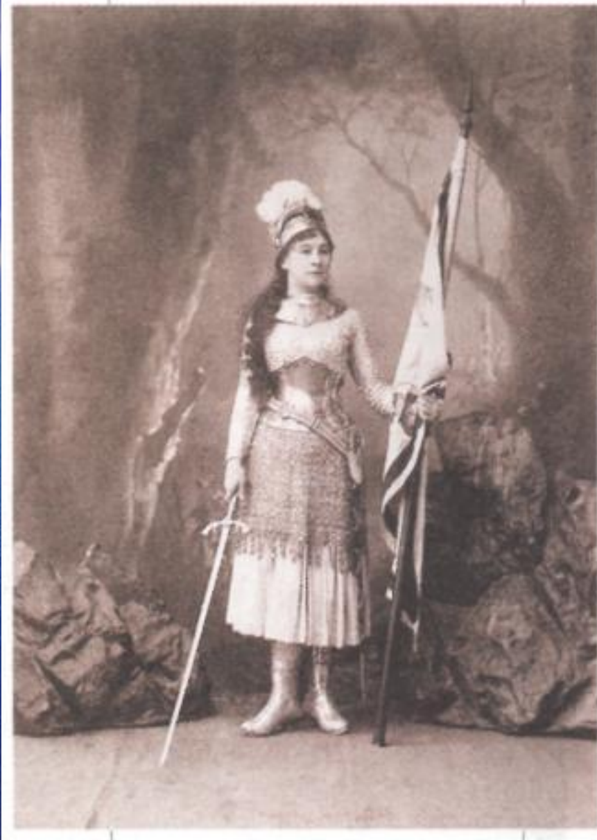
М.Н. Ермолова в роли Жанны д'Арк (пьеса Ф. Шиллера «Орлеанская дева»). Малый театр, Москва. 1884 г.