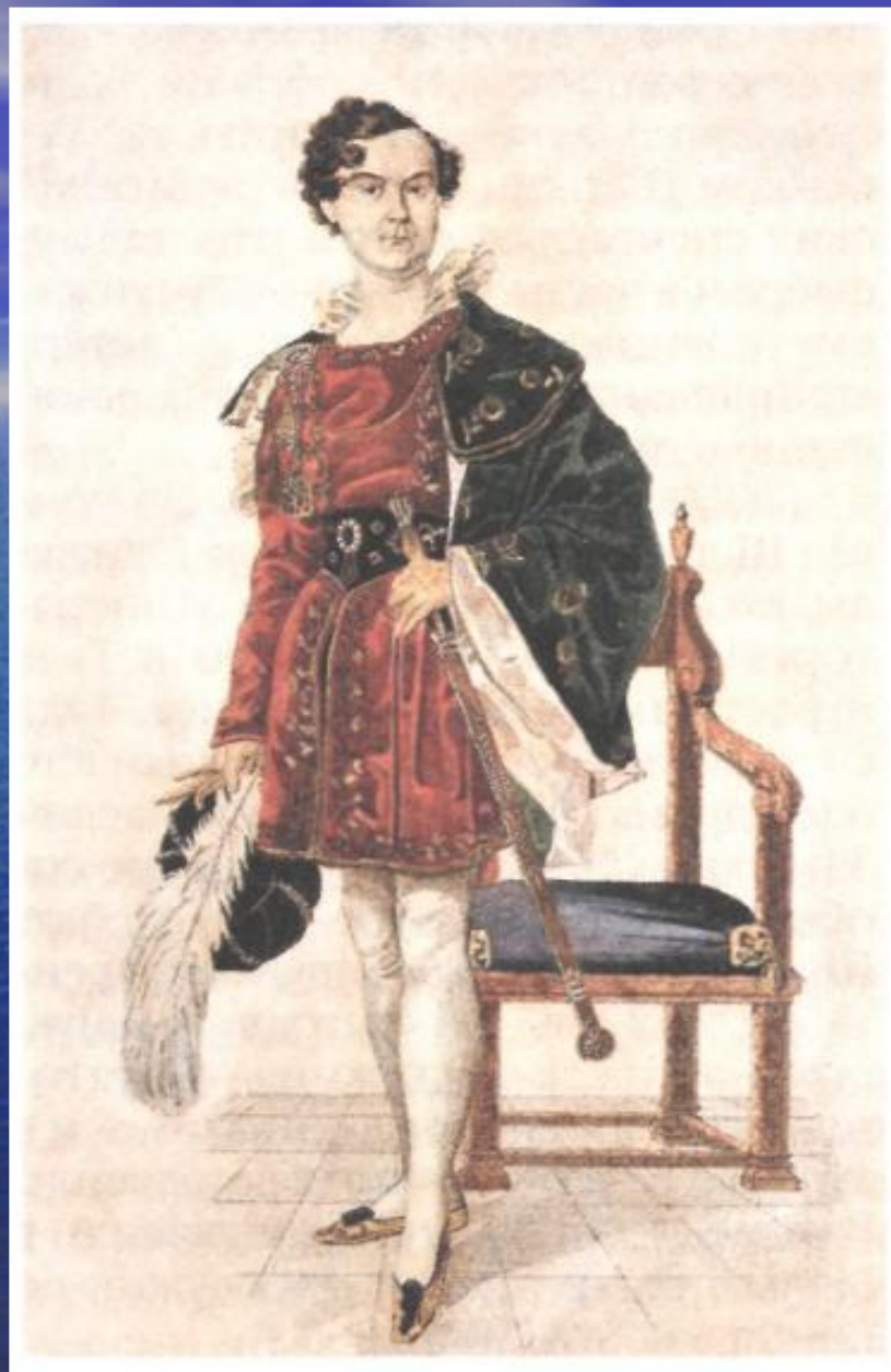
В.А. Каратыгин в роли Нино в спектакле «Уголино» (пьеса Н. Полевого). 1837 г.