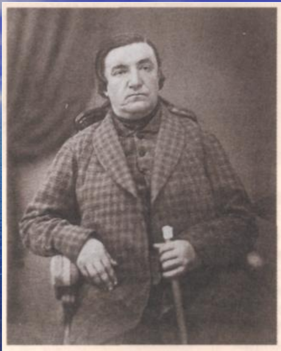
Пров Михайлович Садовский — основатель актёрской династии.