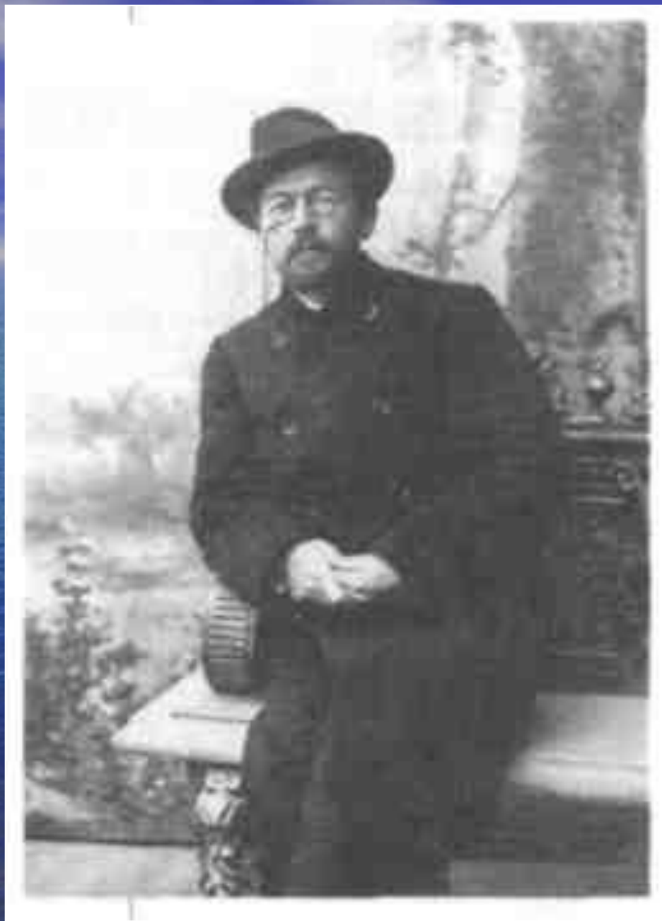
Антон Павлович Чехов. Фотография, подаренная Чеховым Станиславскому