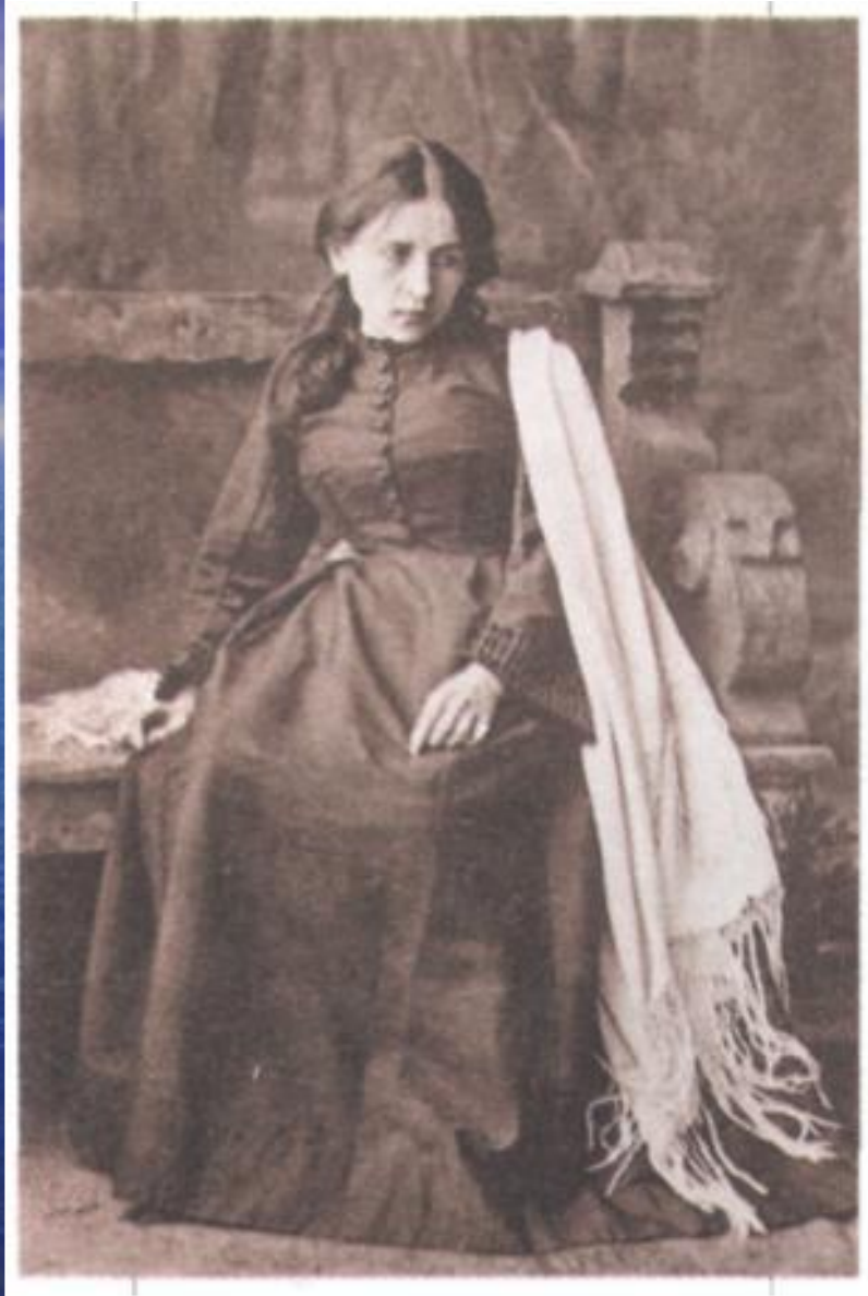
Пелагея Антиповна Стрепетова (1850— 1903), актриса Александринского театра, в роли Катерины (пьеса А. Н. Островского «Гроза»). Её дарование ярче всего проявилось в трагических ролях.