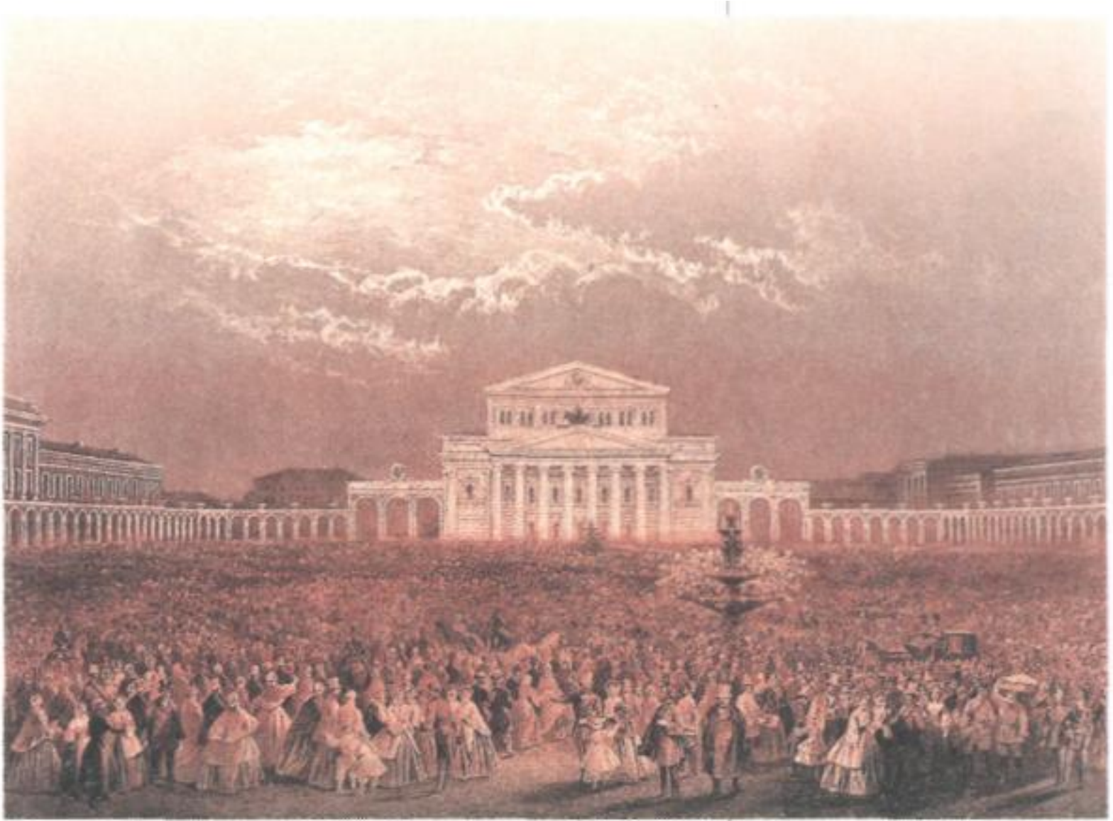
Большой театр. Праздничная иллюминация. По рисунку В.С. Садовникова.