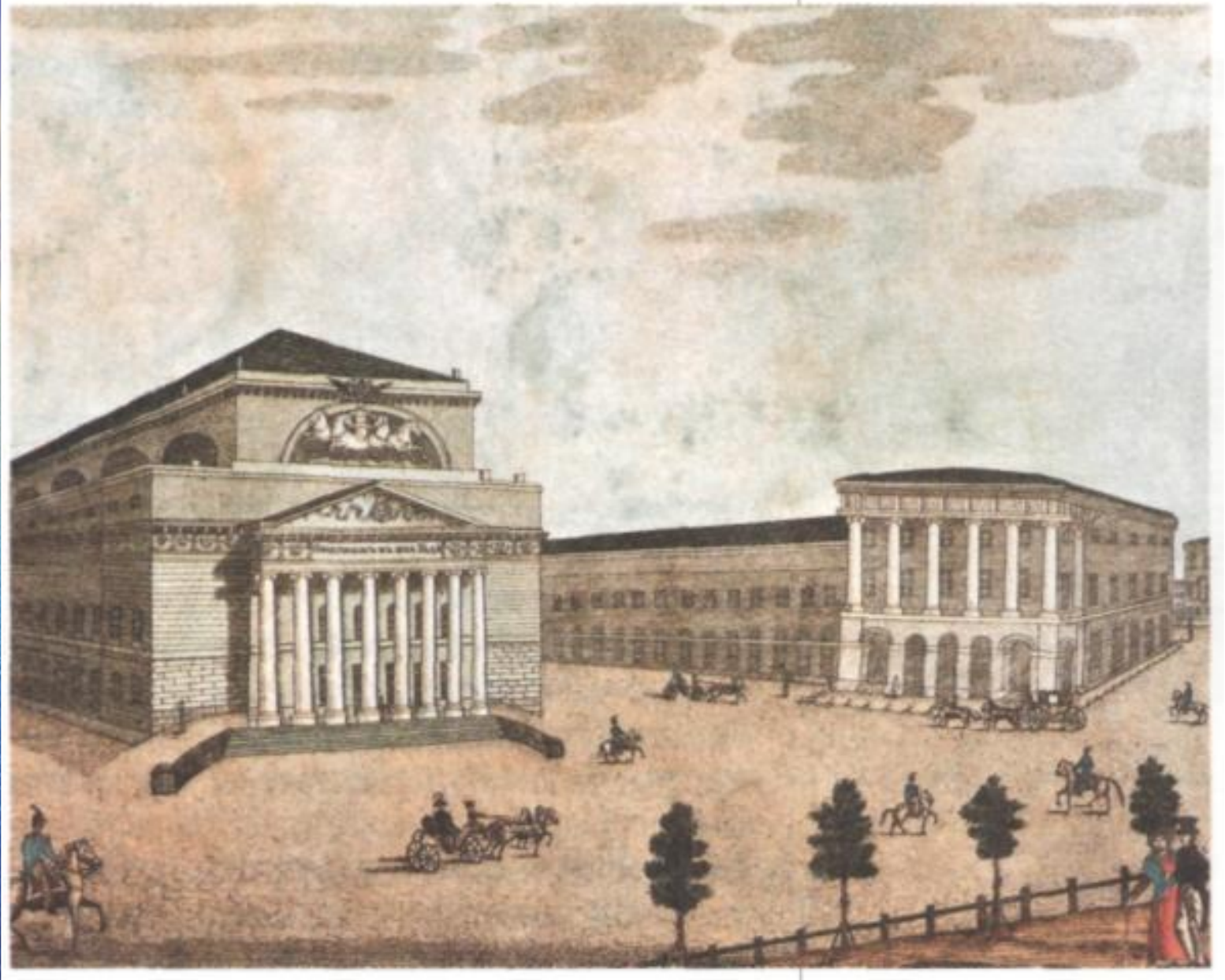
Театральная площадь, Москва. 1824—1825 гг.