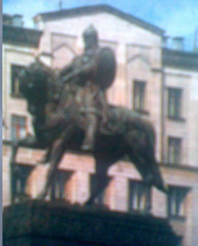
Сергей Орлов. Памятник Юрию Долгорукому.