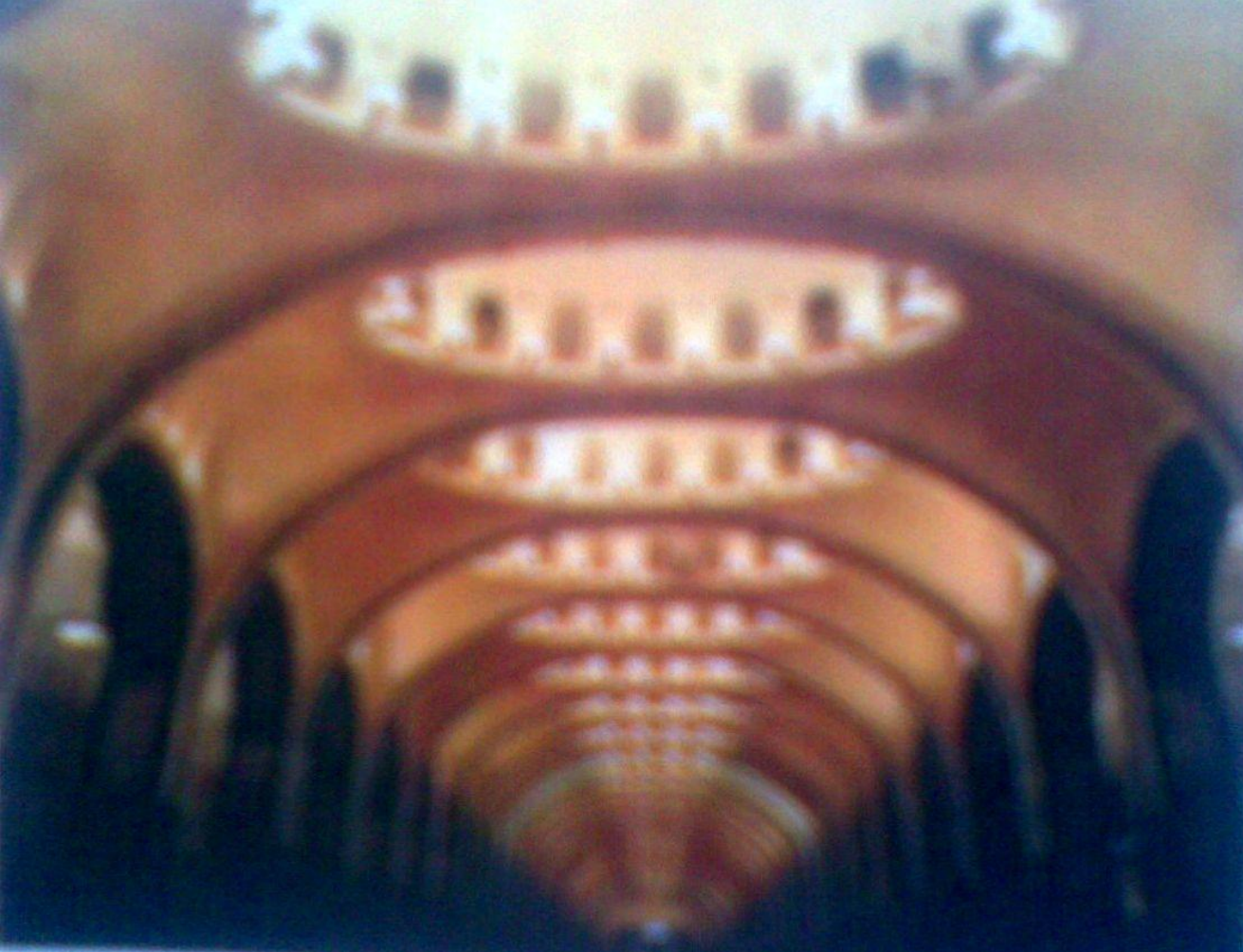
Станция метро «Маяковская» Интерьер. 1938 г.