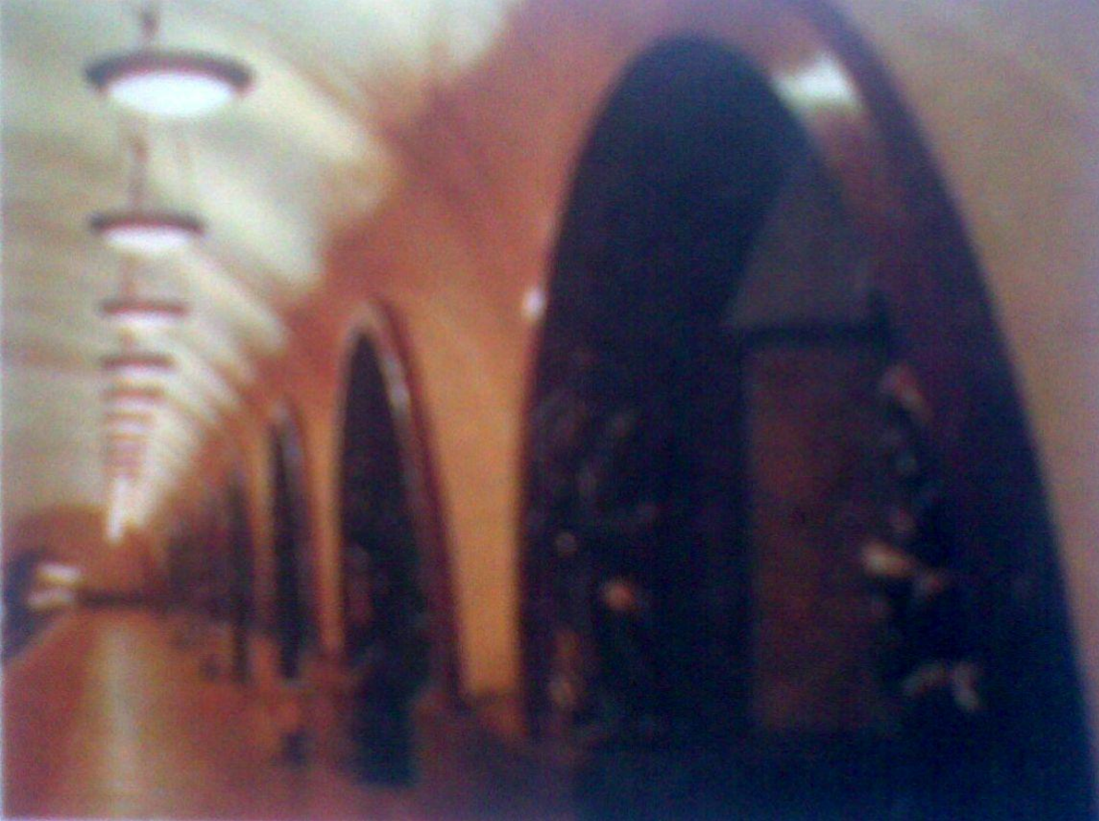
Станция метро «Площадь революции». Интерьер. 1938 г.