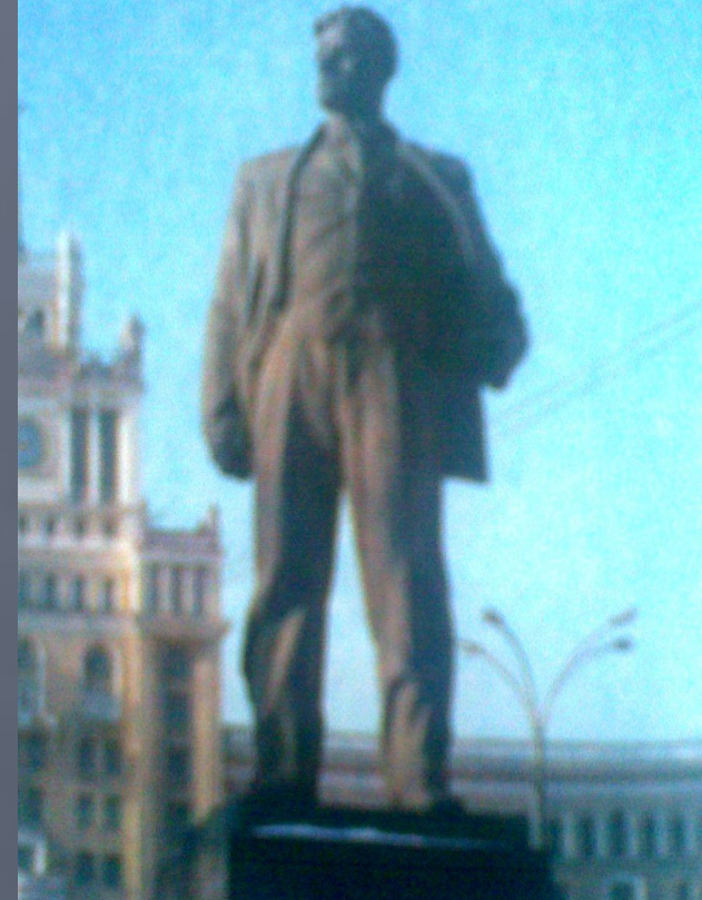
Александр Кибальников. Памятник В. В. Маяковскому.