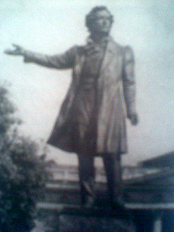
Михаил Аникушин. Памятник А. С. Пушкину.