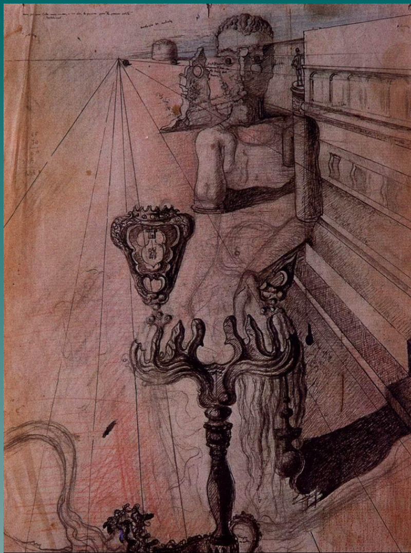
Незримый человек (этуд к картине), 1929. Карандаш.