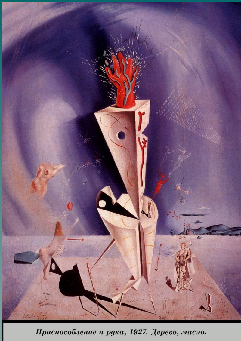
Приспособление и рука, 1927. Дерево, масло.