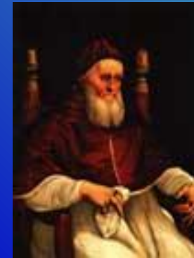
Папа Юлий II делла Ровере'