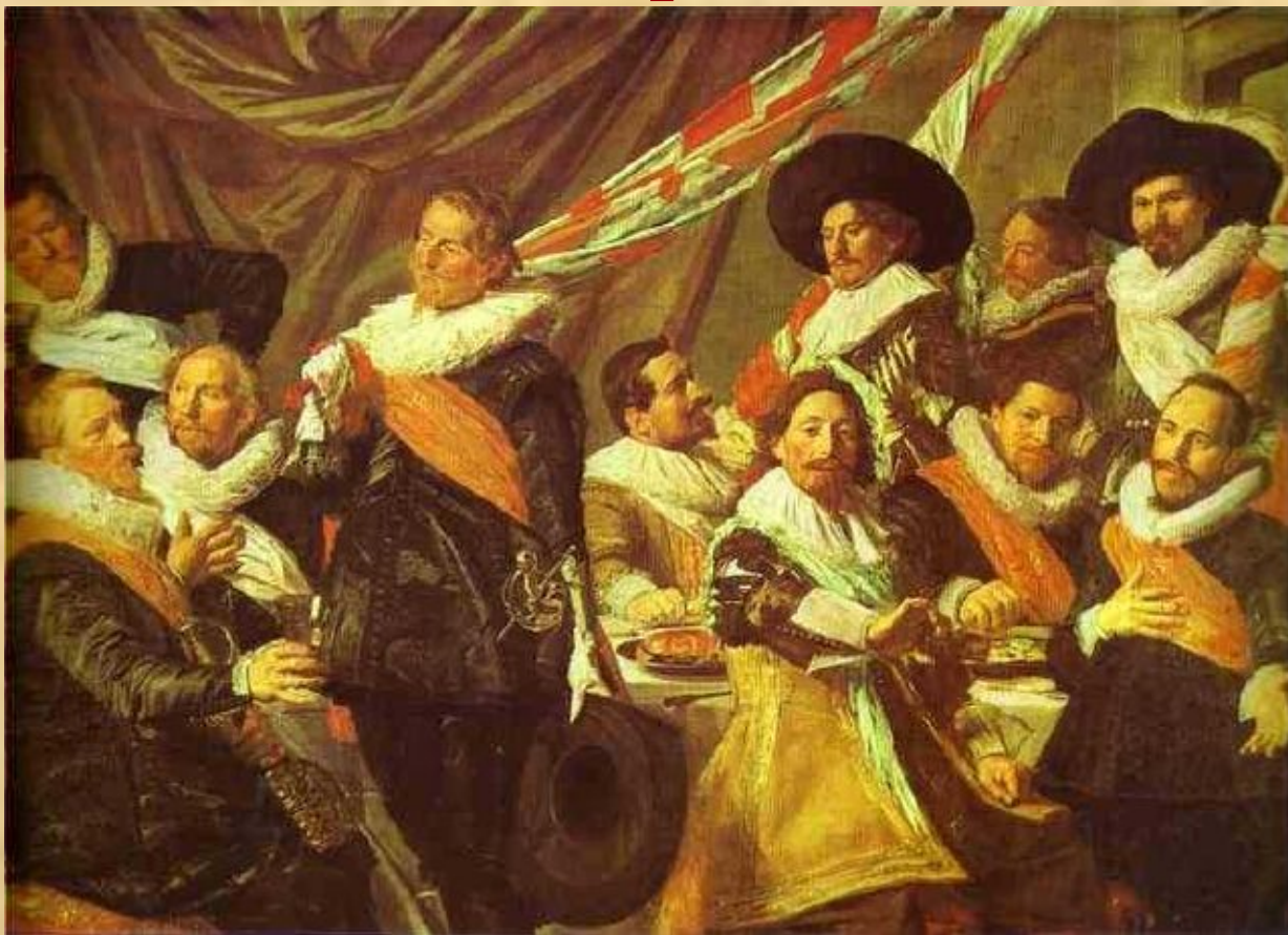
Банкет офицеров стрелковой роты Св. Георгия (Ф. Хальс)

И действительно их маленькие картины создают удивительный покой и уют и настраивают на добрые мысли и дела.