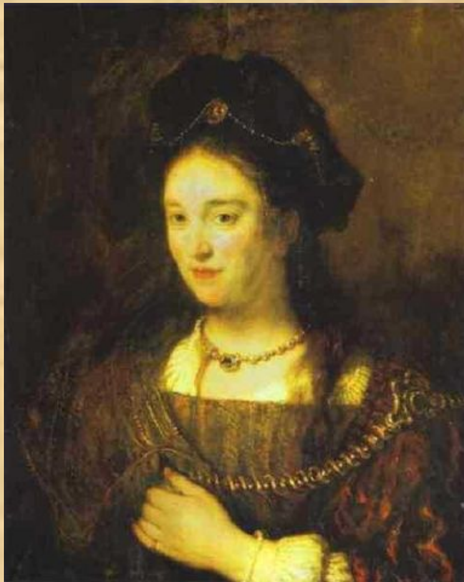
Жена художника Саския (Рембрандт)