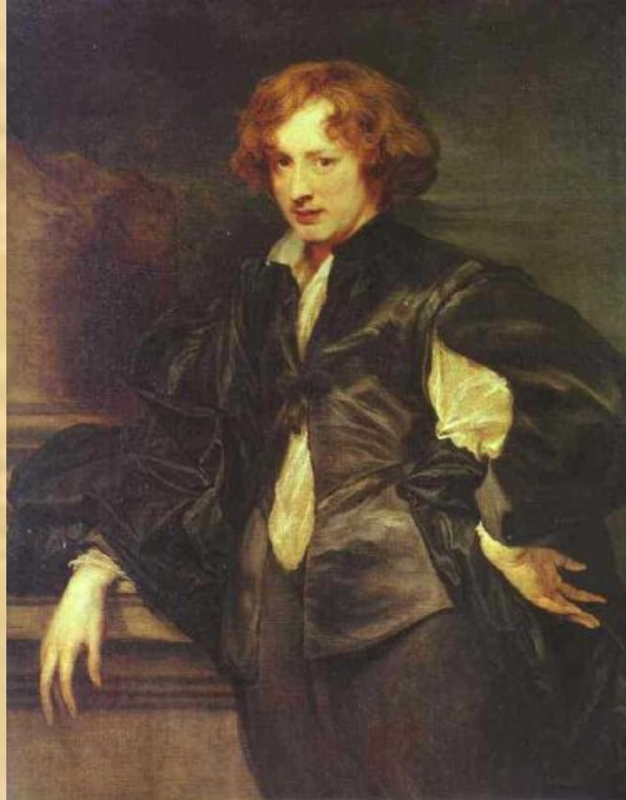
Автопортрет (Ван Дейк)