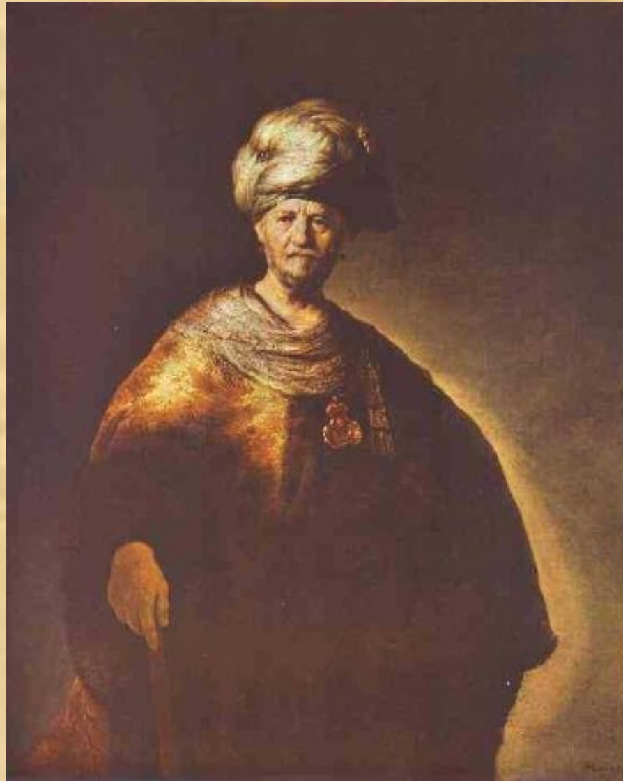
Портрет восточного вельможи (Рембрандт)