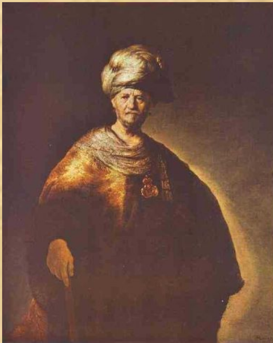
Портрет восточного вельможи (Рембрандт)