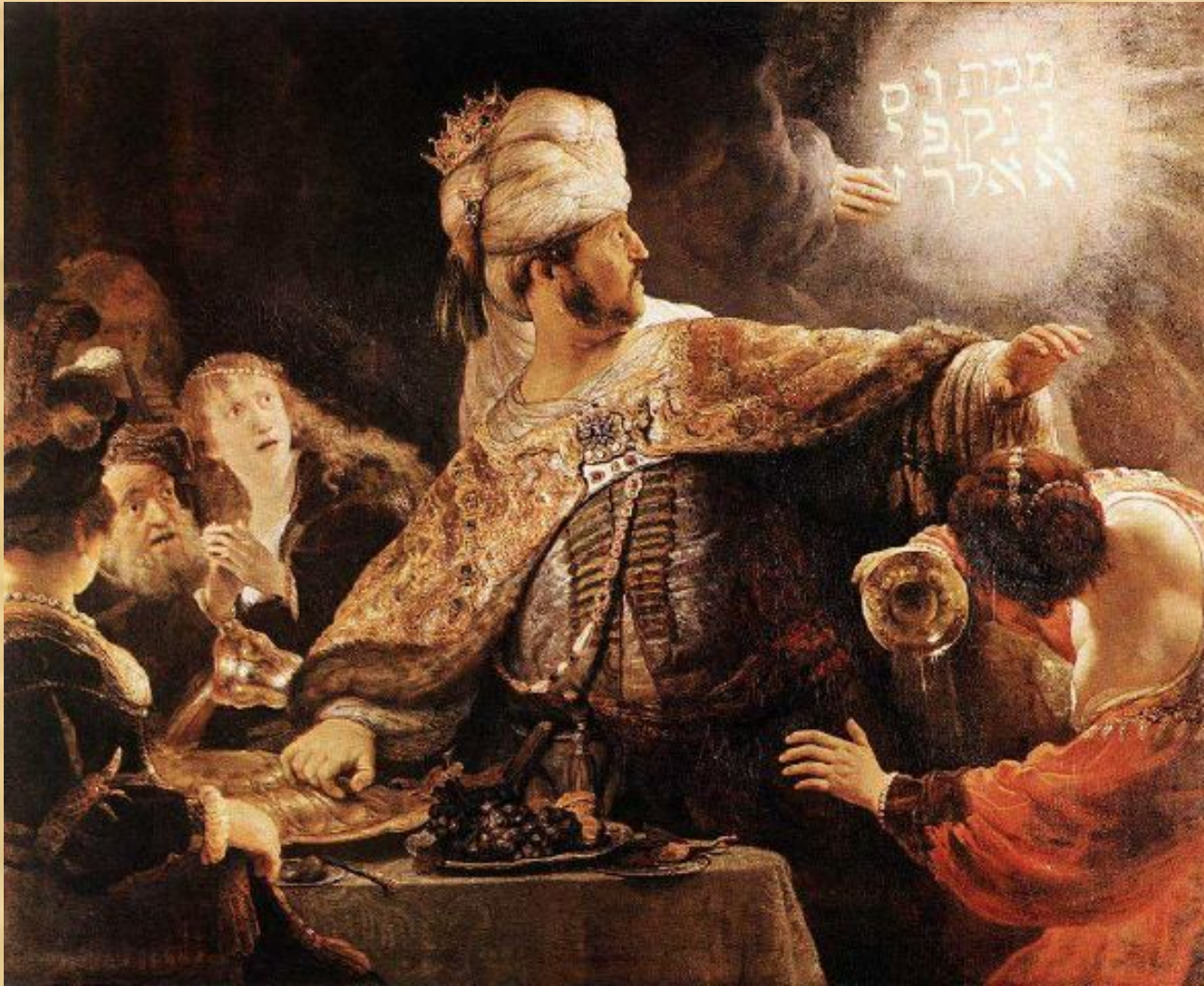
Пир Валтасара (Рембрандт)