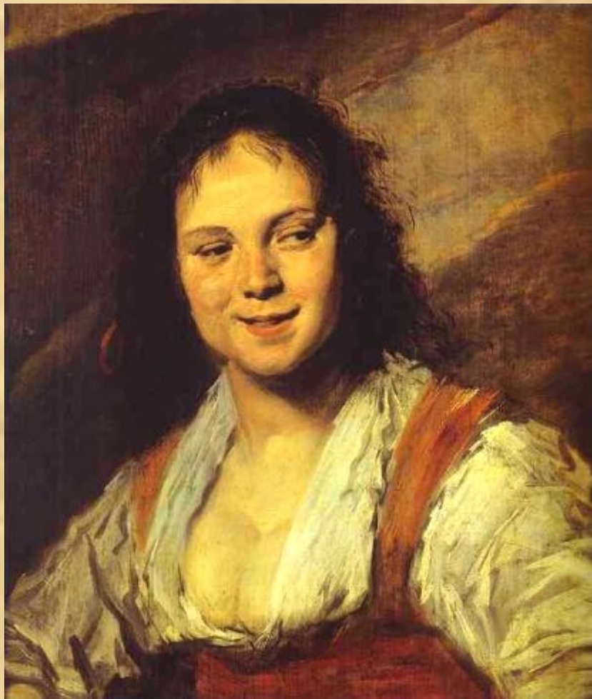
Цыганка (Ф. Хальс)