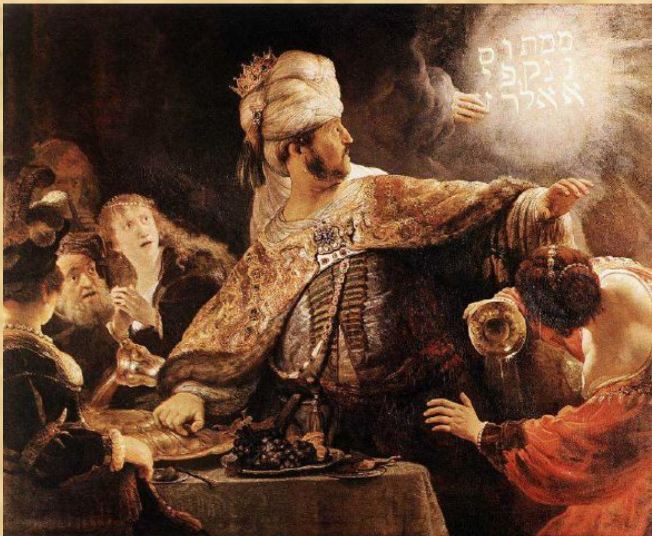
Пир Валтасара (Рембрандт)