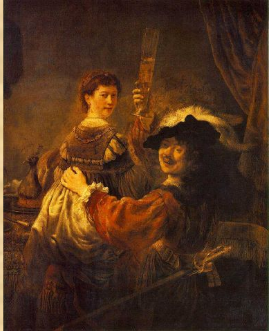
Автопортрет с Саскией на коленях (Рембрандт)

Здесь художник изобразил себя в романтическом костюме кавалера; одной рукой он поднимает бокал пива, а другой обнимает Саскию, сидящую у него на коленях. Яркость красок и свобода мазка полностью соответствуют настроению сцены.