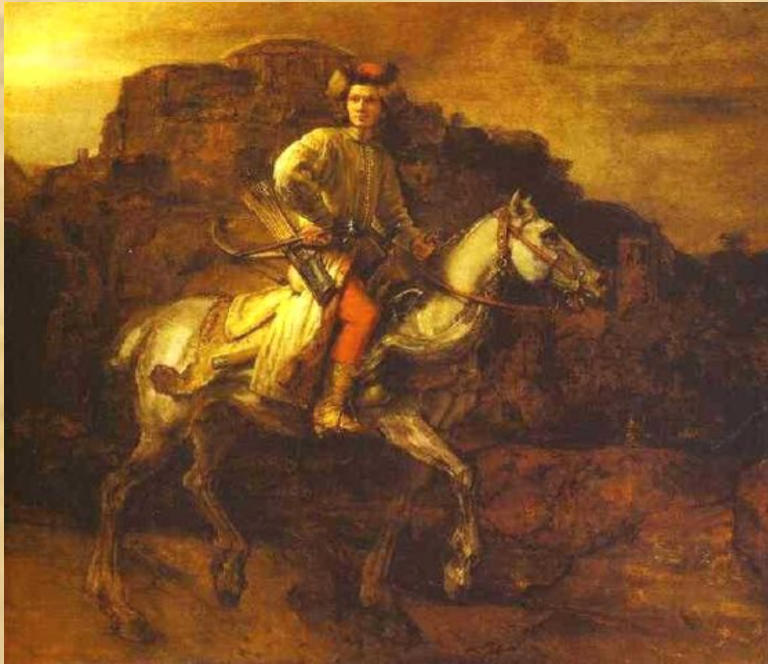
Польский всадник (Рембрандт)