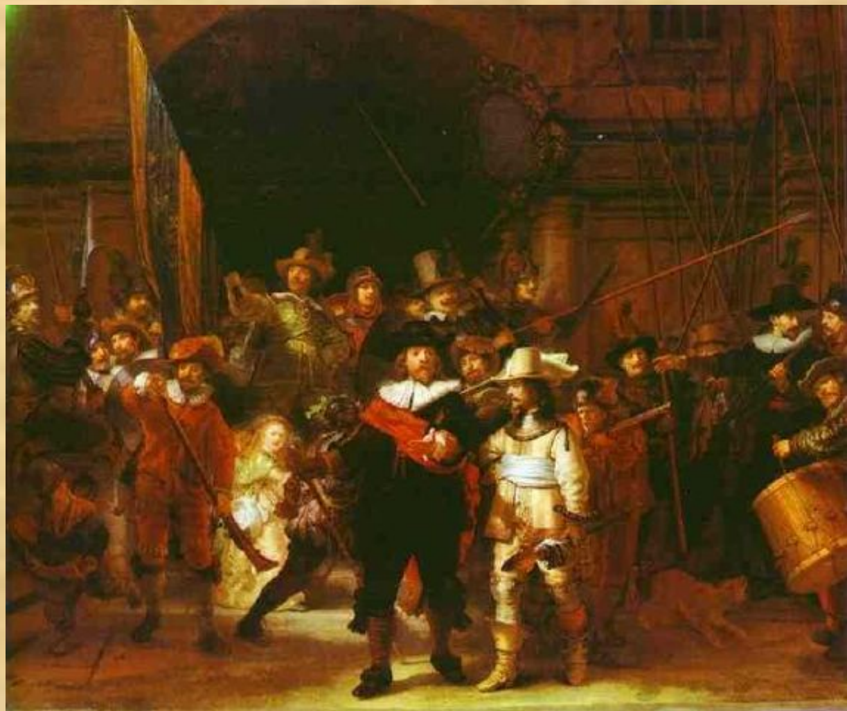
Ночной дозор (Рембрандт)

картина выходит за рамки традиционного группового портрета. На ней изображено 29 персонажей, из которых 16 - реальные исторические лица; их движения и расположение на картине подчинены единому общему действию, развивающемуся на глазах у зрителя. Дривки, знамена и мушкеты торчат в разные стороны, делая композицию более свободной и динамичной; ощущение усиливается игрой света и тени.