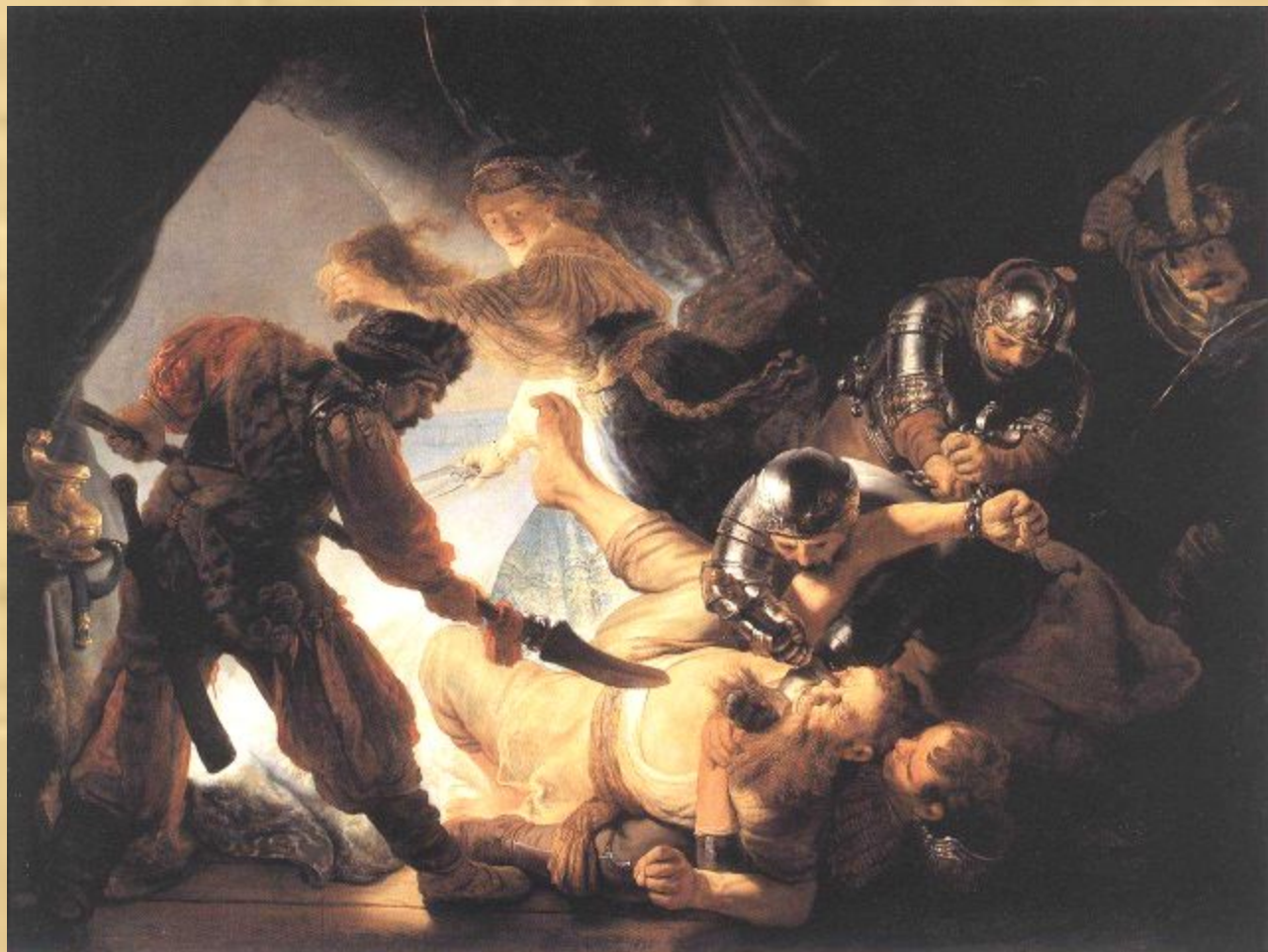
Ослепление Самсона (Рембрандт)

Среди картин на исторические сюжеты, выполненных Рембрандтом в 1630-е годы, особенно драматичным представляет ся Ослепление Самсона