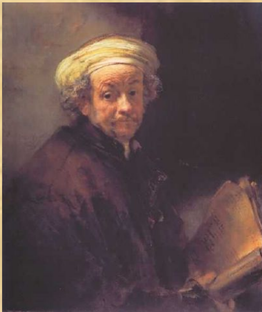
Автопортрет в виде апостола Павла (Рембрандт)