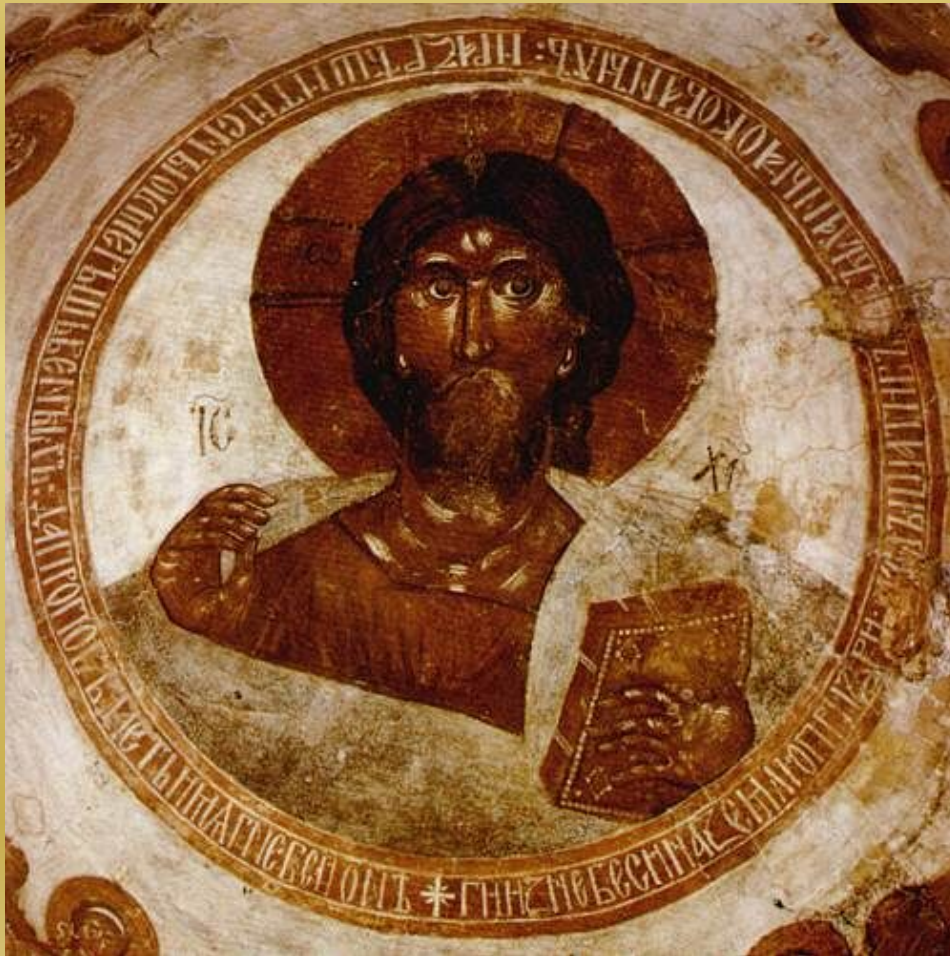
Спас Вседержитель. Роспись купола церкви Спаса Преображения на Ильине улице в Новгороде Великом. Феофан Грек. 1378 г