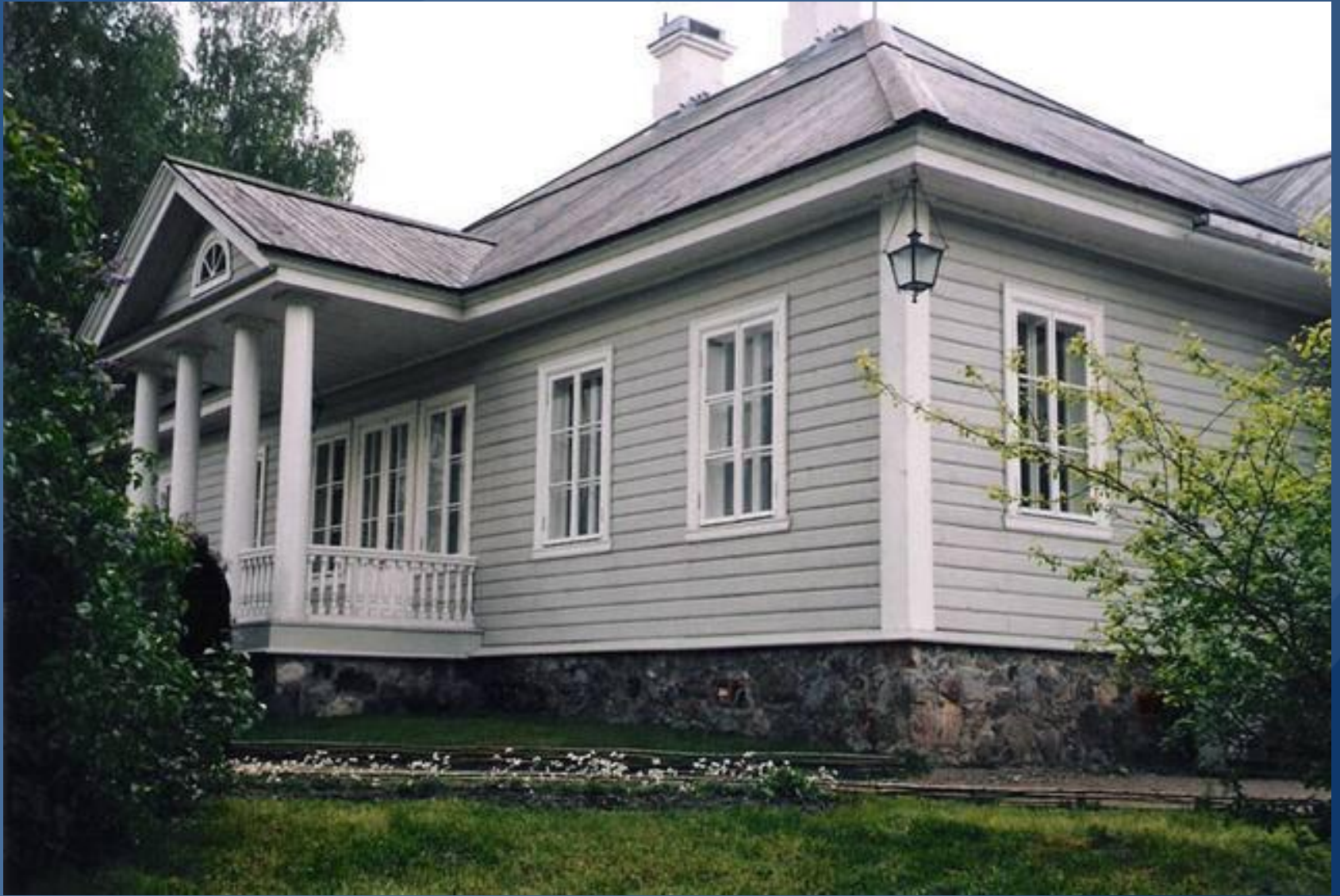
Усадьба Михайловское. Главный дом.