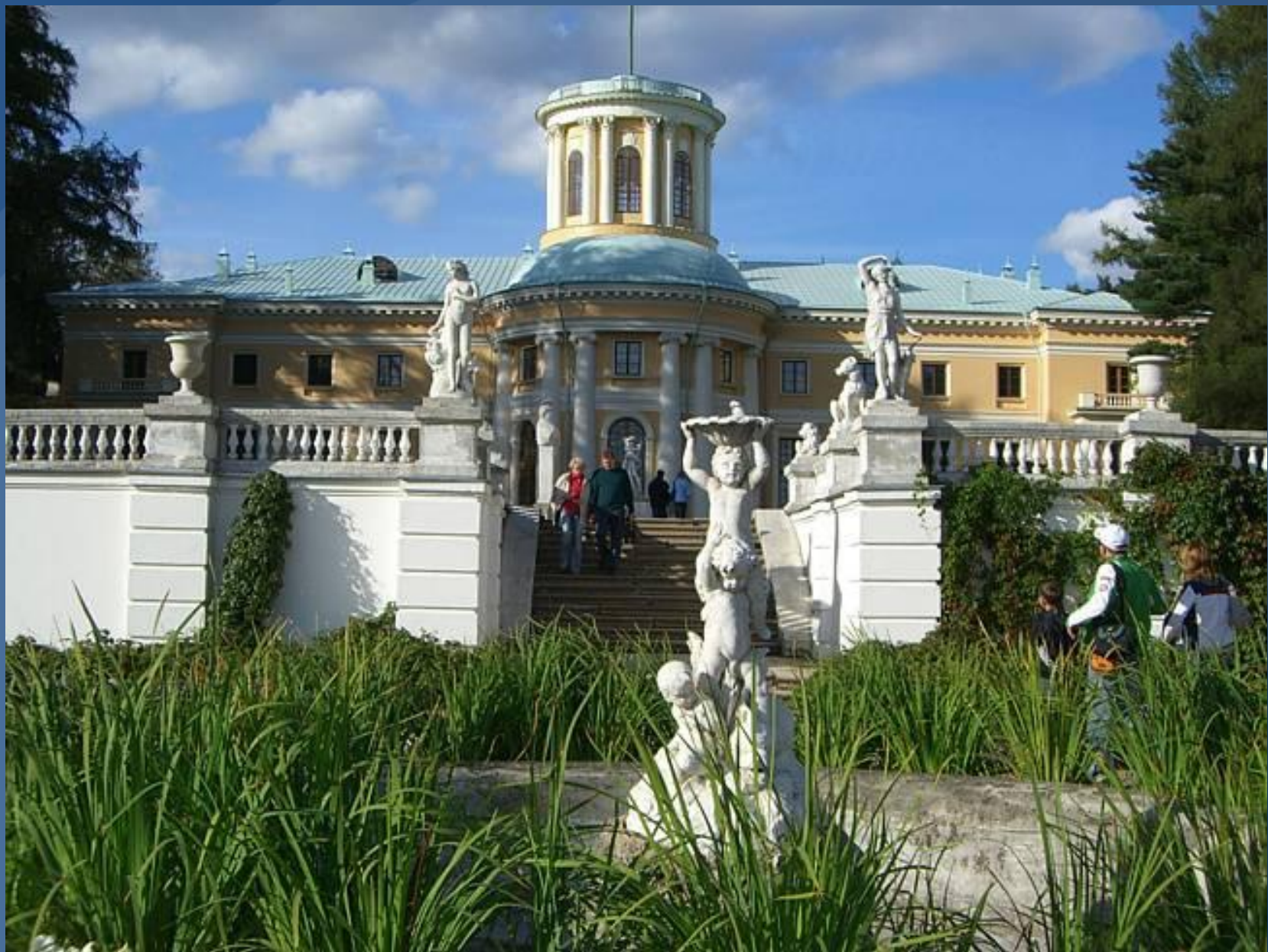
Усадьба Архангельское . Москва.