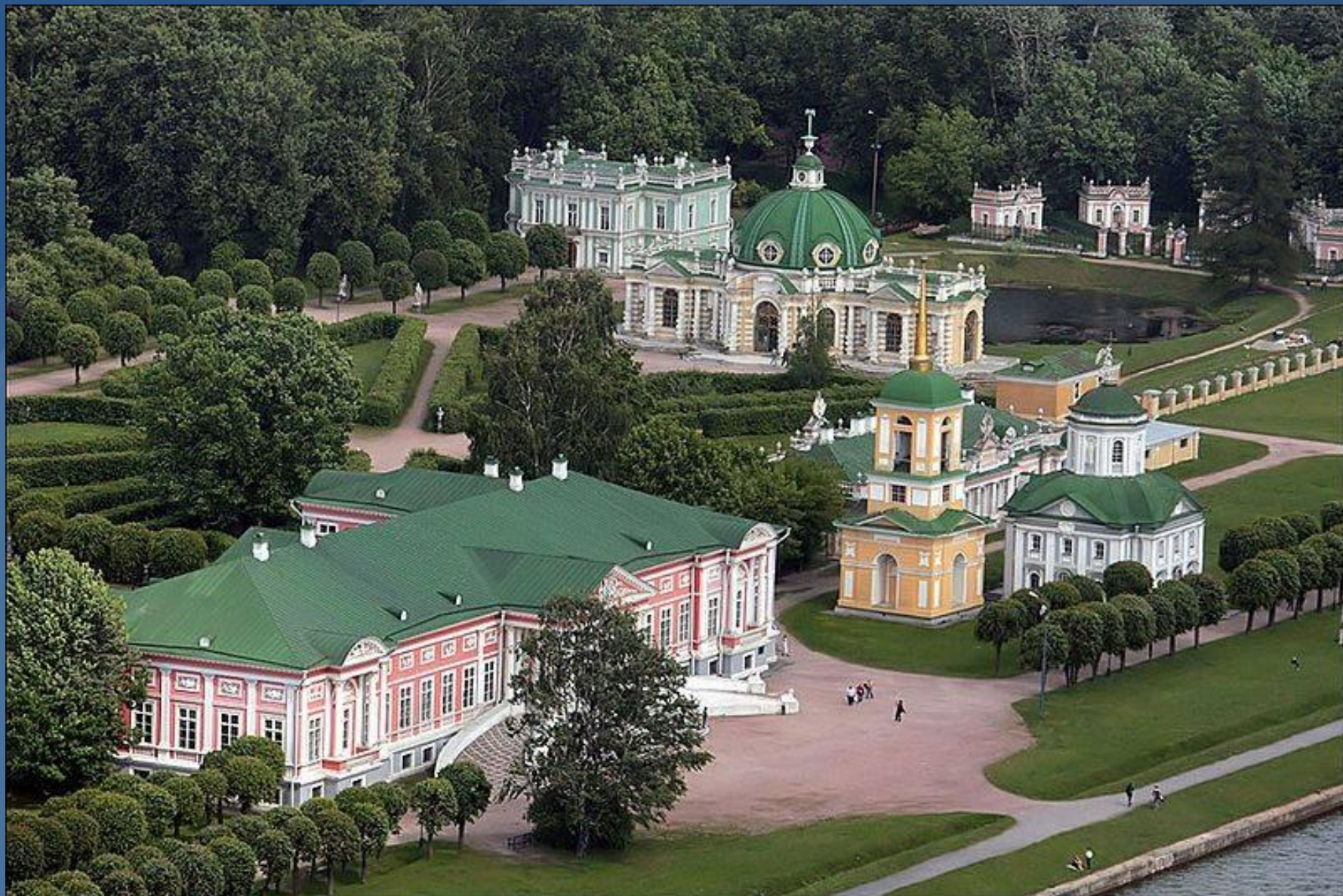
Усадьба Кусково. Москва.