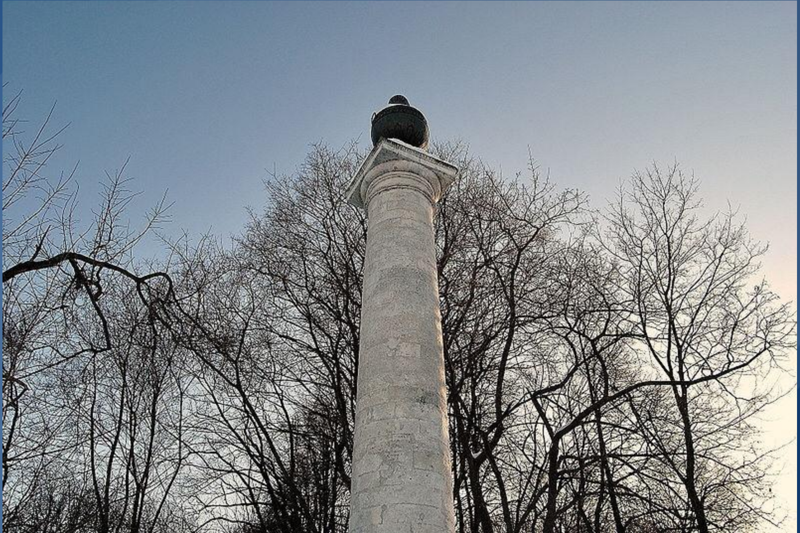
Маяк в Кусково