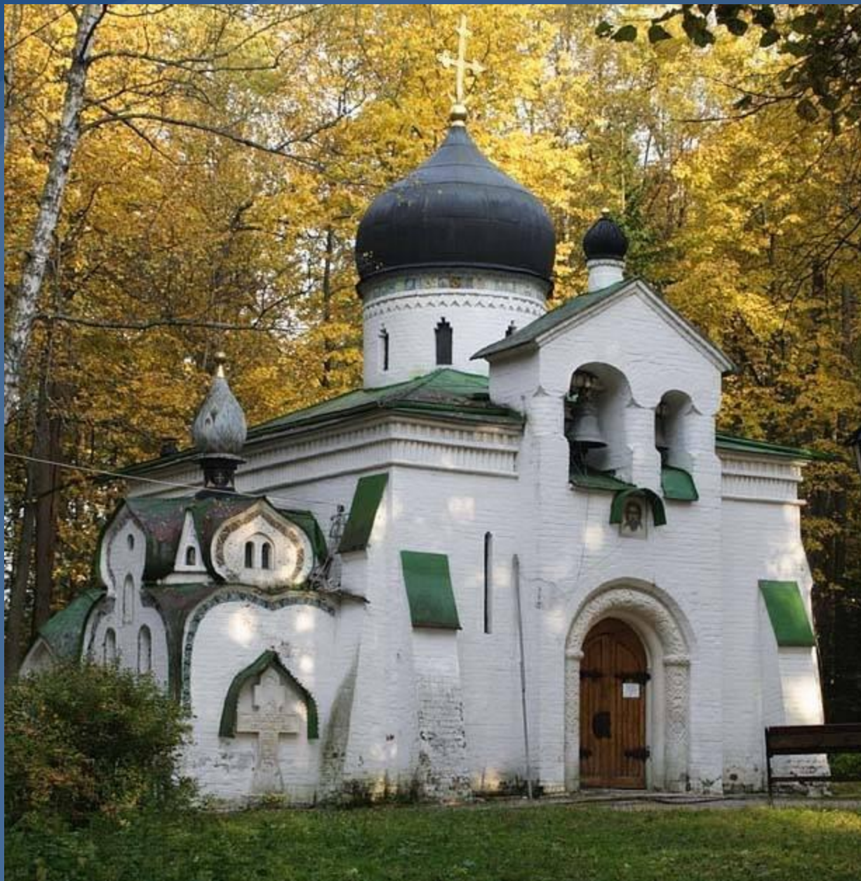
Спасская церковь в Абрамцево Московской области.