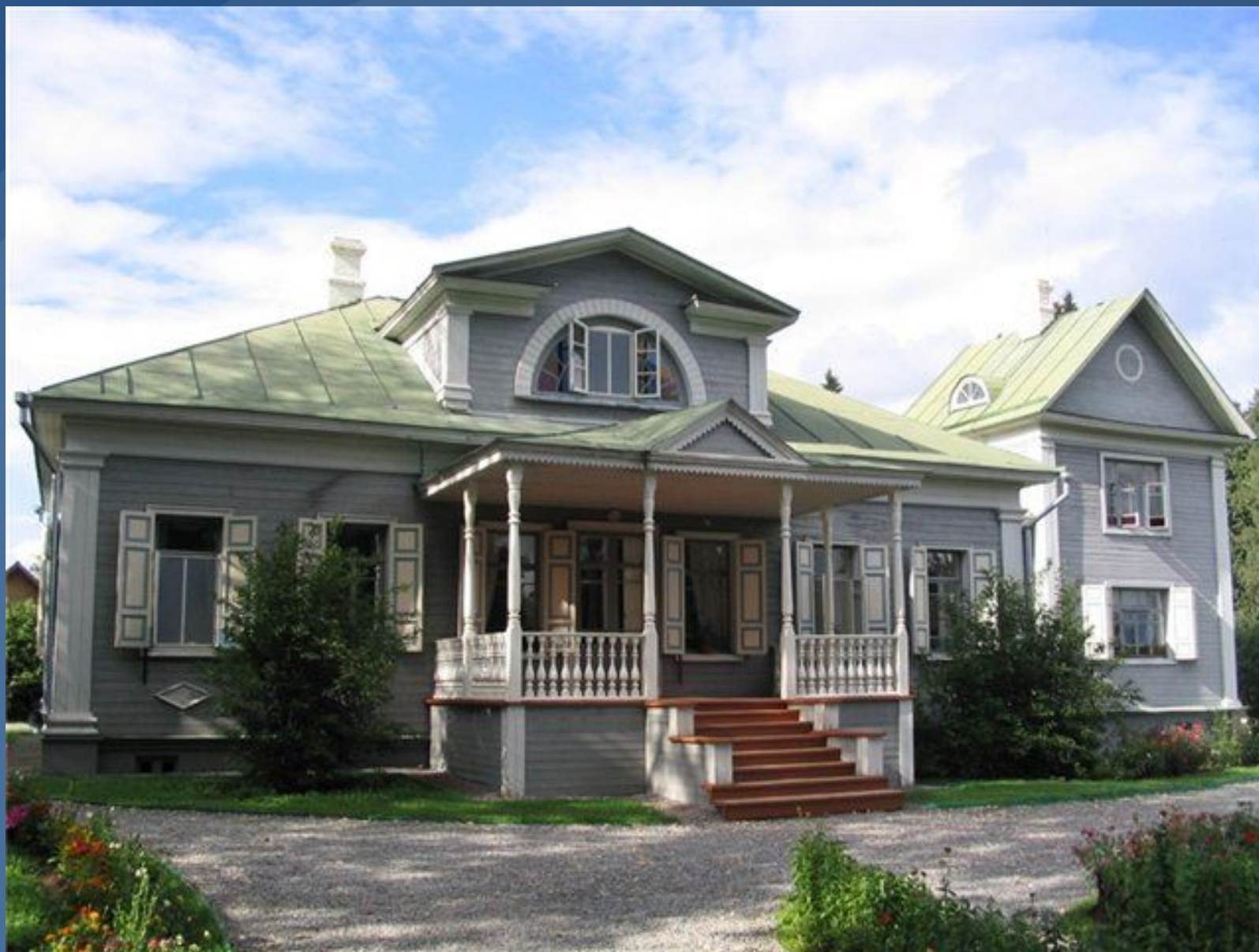
Усадьба в Шахматове. Подмосковье.