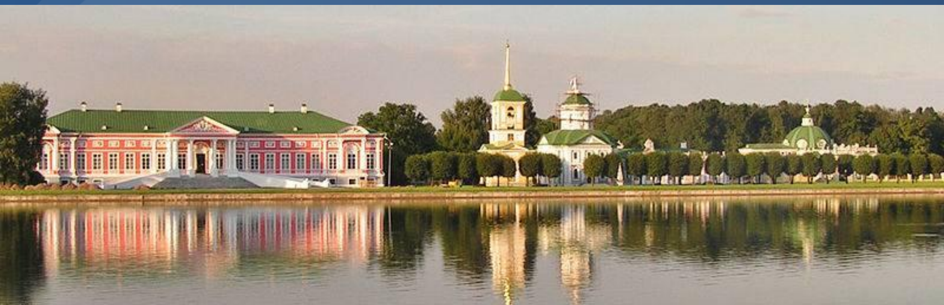
Вид на Дворец и церковь с колокольней