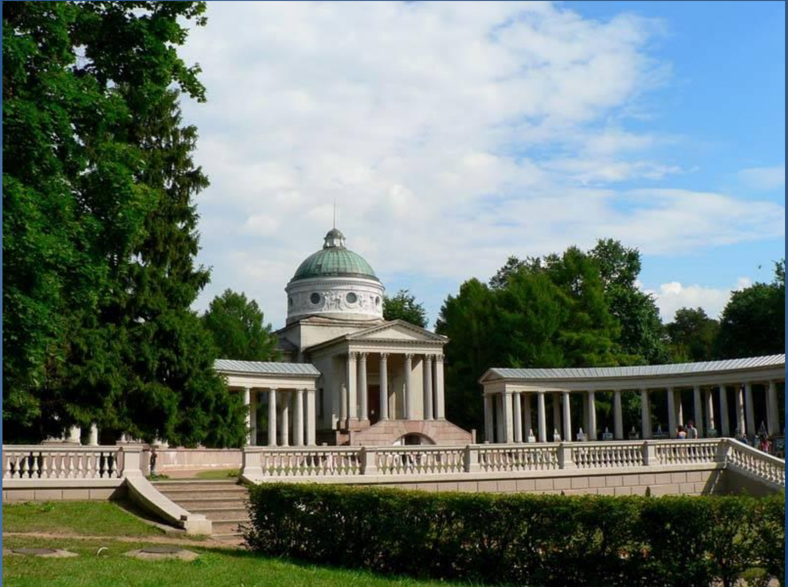
Усадьба Архангельское . Москва.