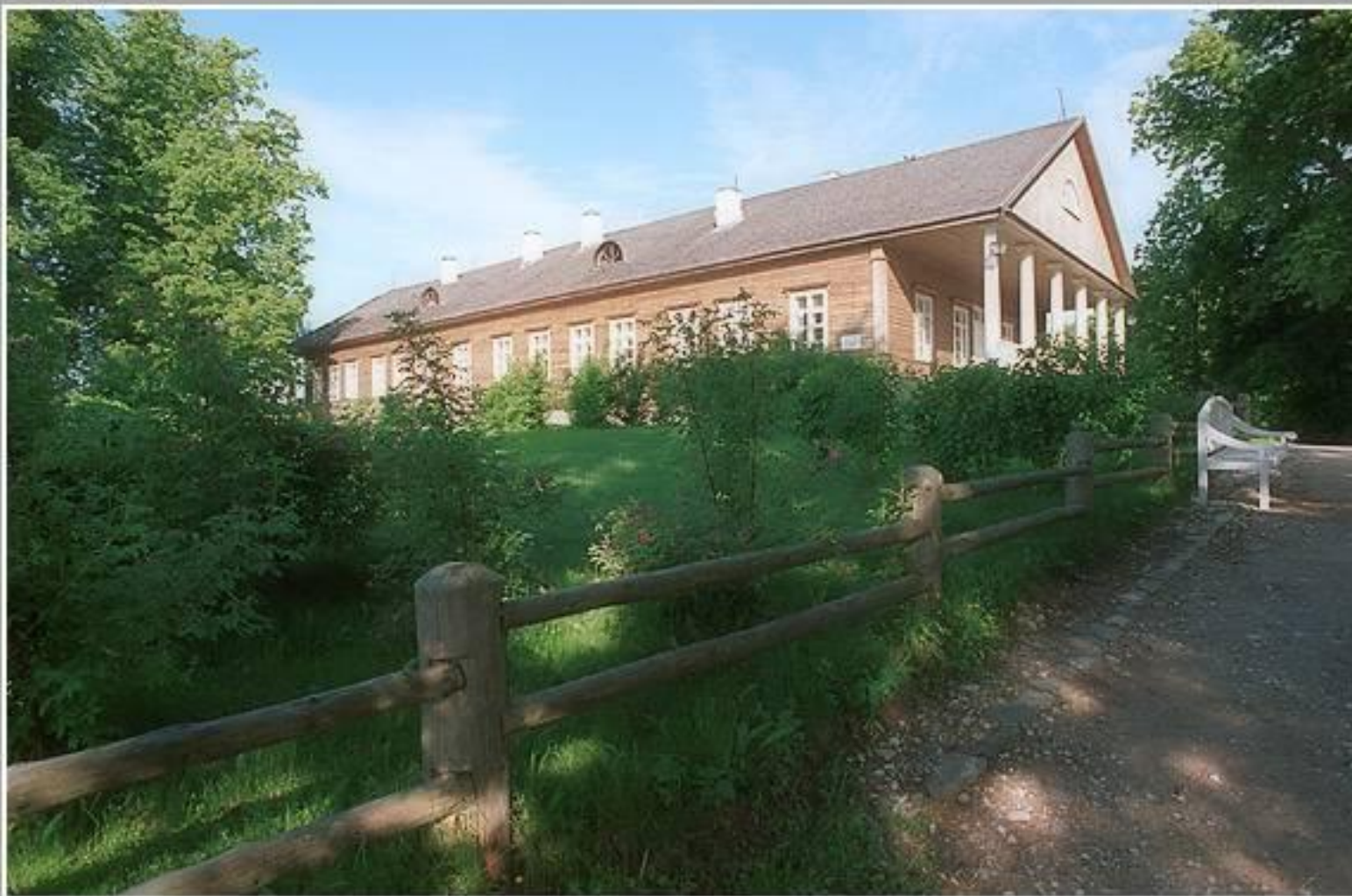
Тригорское. Усадьба. Псковская область.