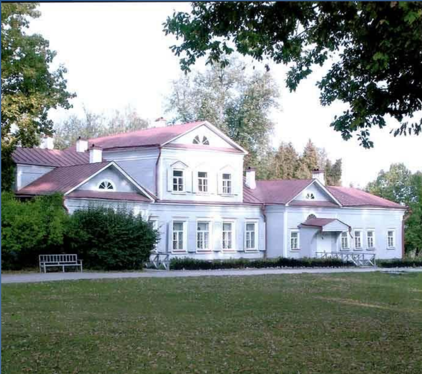
Абрамцево. Барский дом. Москва.