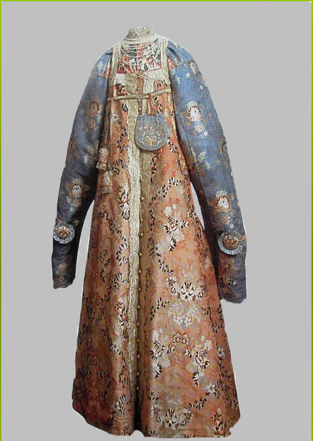
Дорогая нарядная одежда девушки из богатой семьи