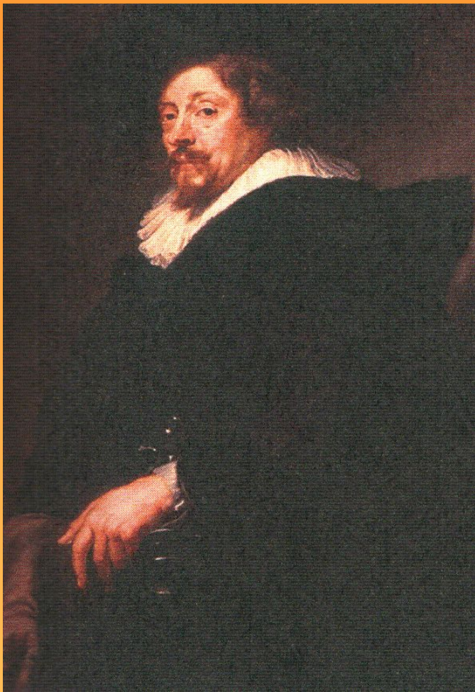
Автопортрет 1639 г.

Картина находится: Художественно – исторический музей, Вены