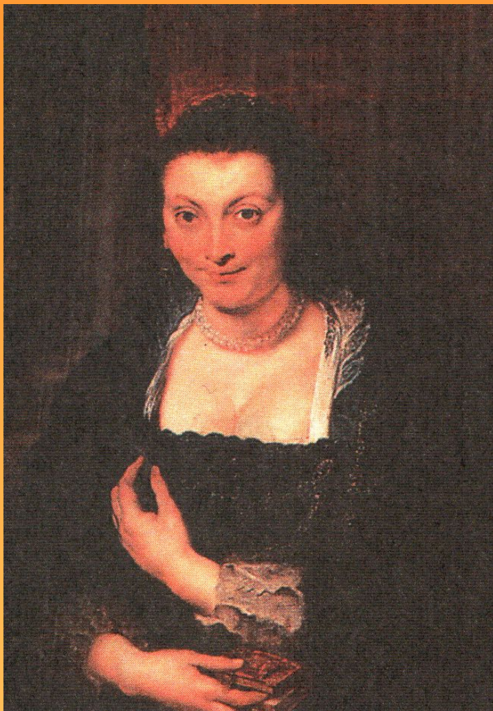
Портрет Изабеллы Брандт 1625 г.

Картина находится: Галерея Уффици, Флоренция