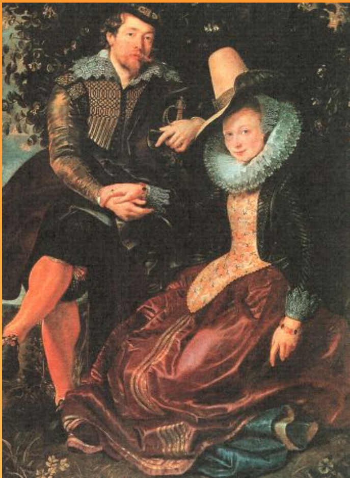
Автопортрет с женой Изабеллой Брандт (Жимолостная беседка) 1609г.