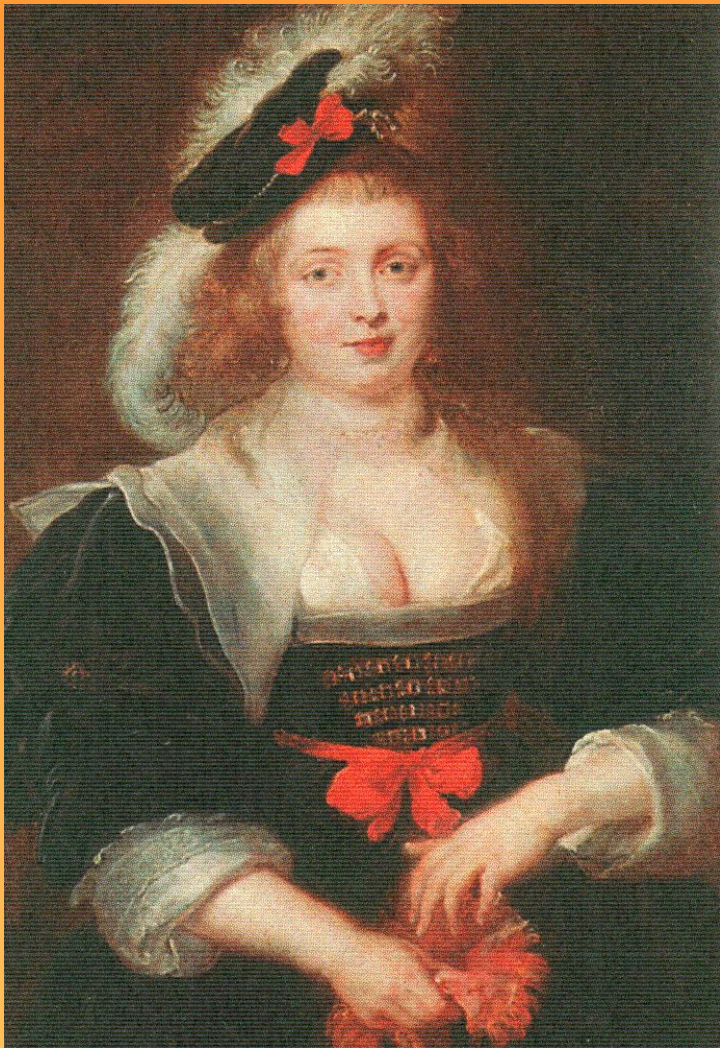
Портрет Елены Фоурмен 1633 г.

Картина находится: Старая Пинакотека, Мюнхен