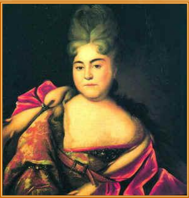
Портрет царевны Натальи Алексеевны