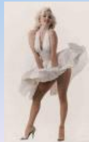
Кадры из знаменитого фильма «Зуд седьмого года»