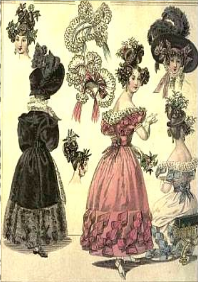
Alte. Fashion for February 1859