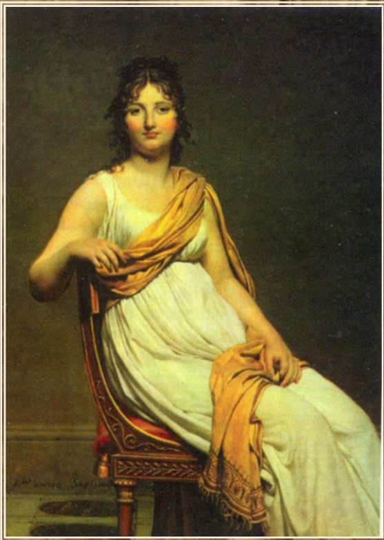
Жак-Луи Давид Портрет г-жи Вернинак. 1977 г.

Обращение к идеалам античного искусства вносит новое в понимание образа идеального человека, а также ясность, простоту, соразмерность в его одежду. Первоначально парижские модники и модницы старались точно копировать античные одежды. Мужчины носили короткую тунику, доходившую до колен и схваченную на талии поясом, поверх туники надевали плащ, также носили сандалии с завязанными вокруг ноги лентами. Женщины надевали длинную, разрезанную по бокам легкую тунику, перехваченную под грудью поясом и красиво задрапированную. Всем своим обликом женщина должна была напоминать мраморную скульптуру. Вот почему одежды носили исключительно белые. В моду в большом количестве вошла пудра, которой модницы покрывали не только лицо, но и шею, грудь, спину, руки.