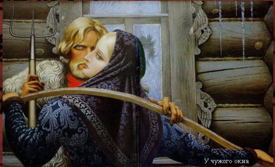
У чужого окна