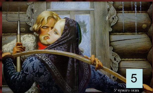
У чужого окна