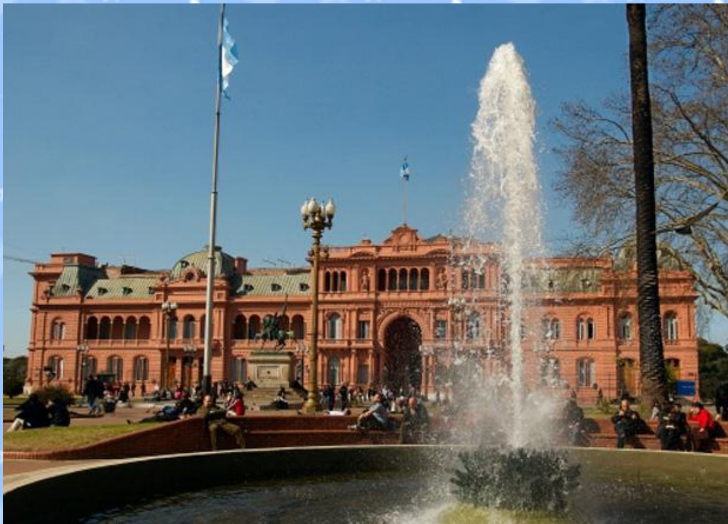
«Розовый дом» Резиденция президента