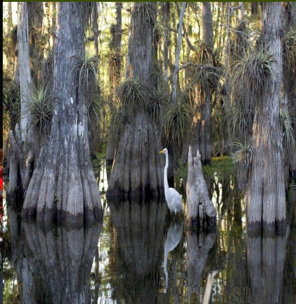
Национальный заповедник Эверглейдс