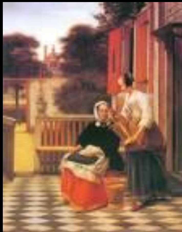
Питер де Хох Хозяйка и служанка