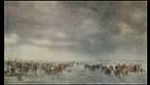
Ян ван Гойен