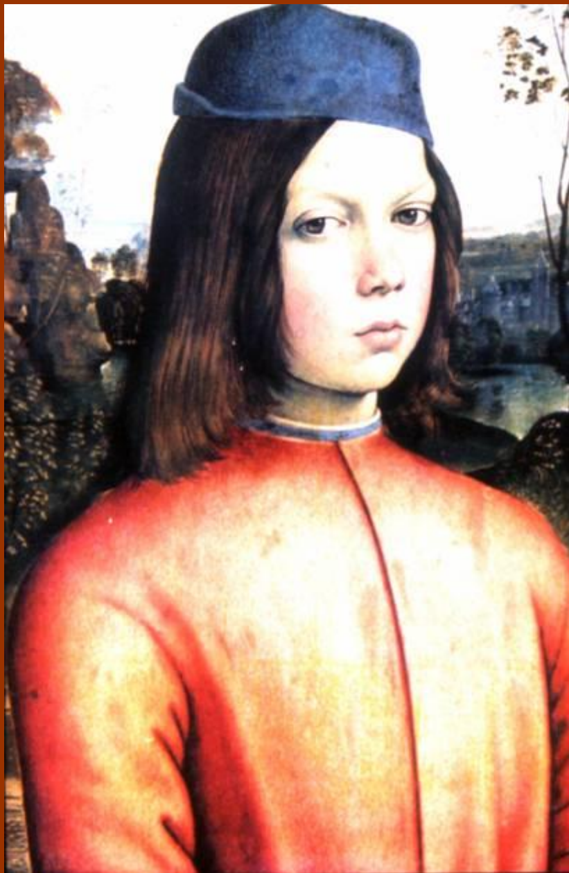
Пинтуриккьо 1454-1513, мастер умбрийской школы - тщательность письма, - тонкая поэтичность “Портрет мальчика”