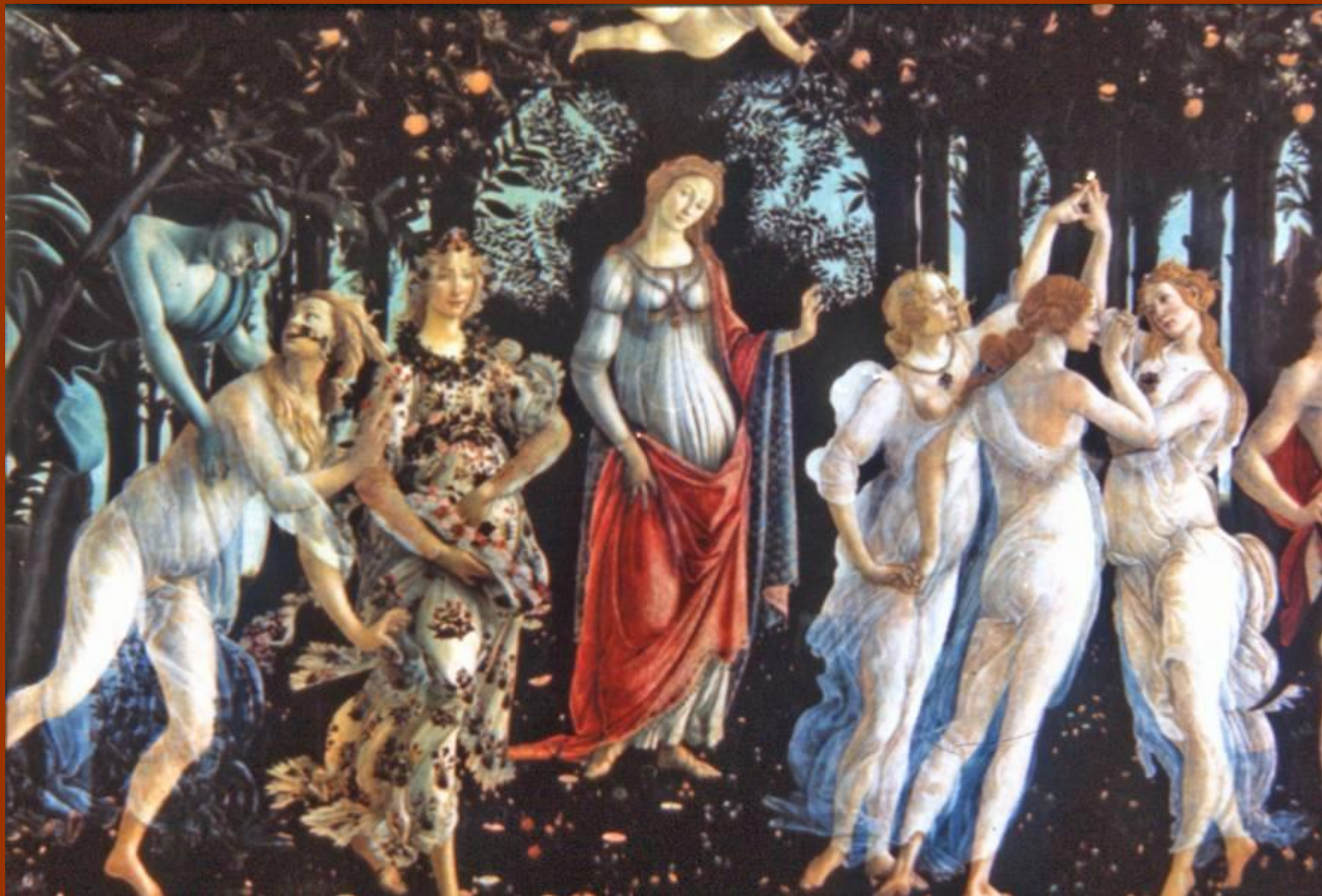
"Весна", около 1477–1478 г.