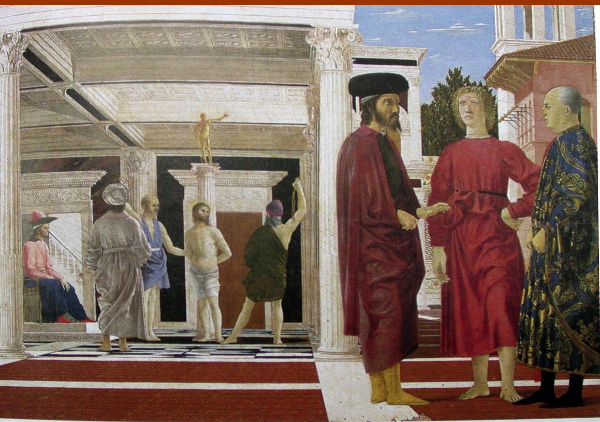
5. Пьеро делла Франческа: "Бичевание" (1456—57).