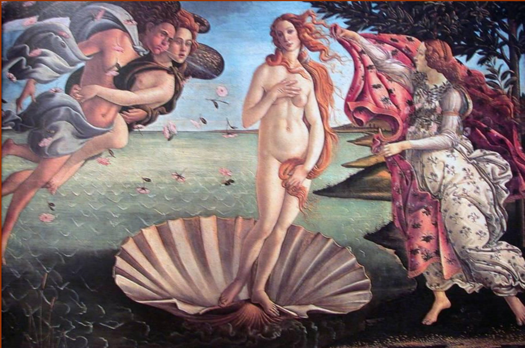
Алессандро ди Мариано Филлипепи, Рождение Венеры, 1483