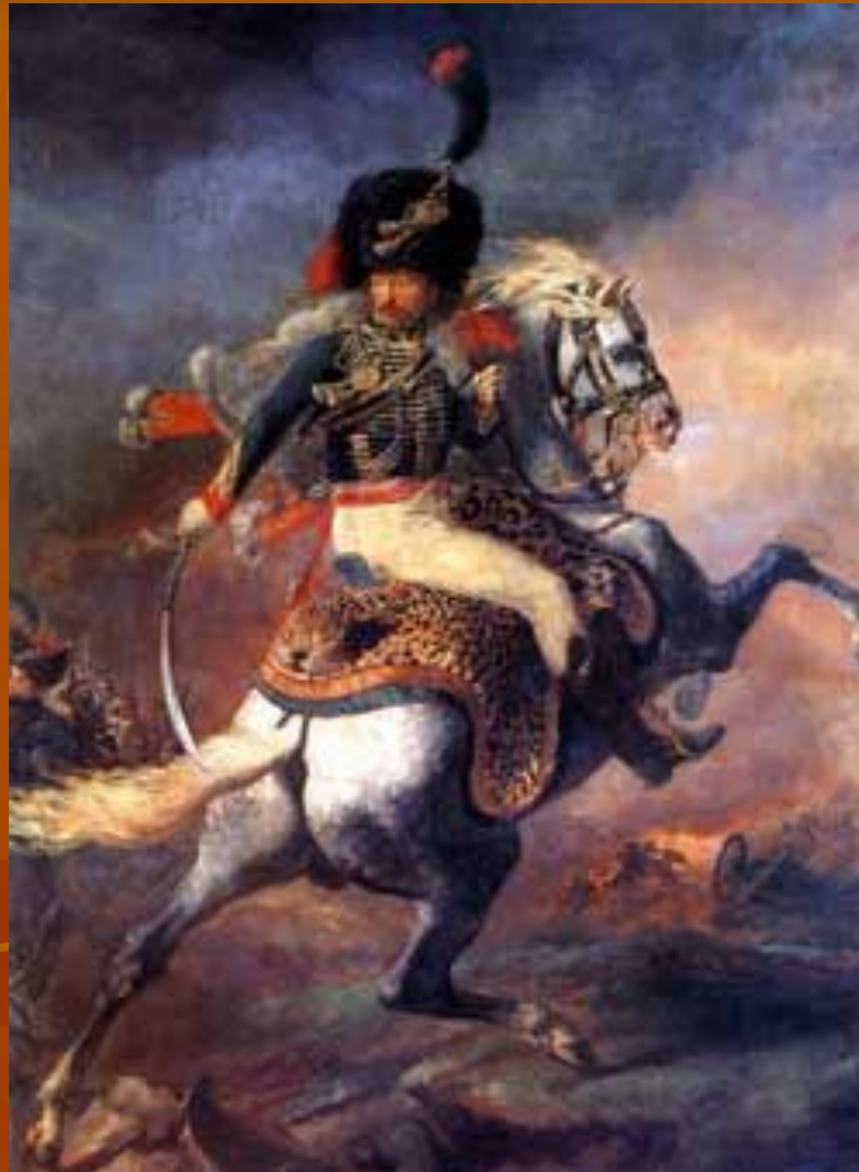
Теодор Жерико(1791-1824) Офицер конных егерей императорской гвардии, идущий в атаку. 1812 г.