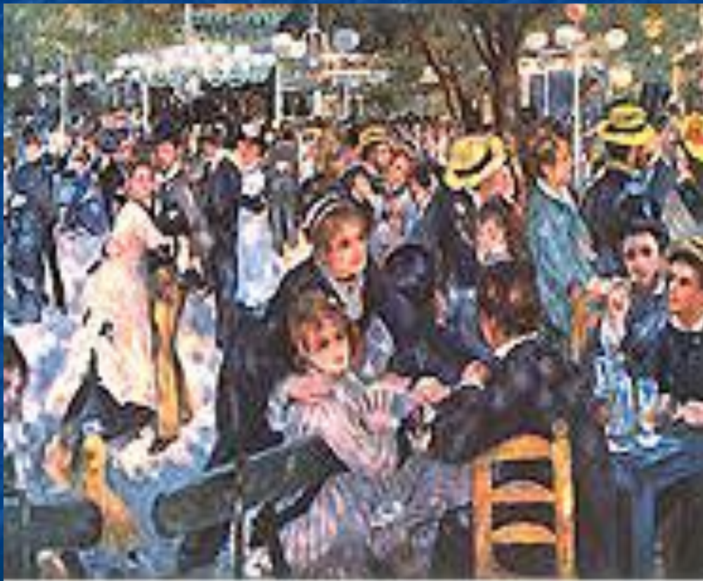
«Бал в Мулен де ла Галет». 1876.