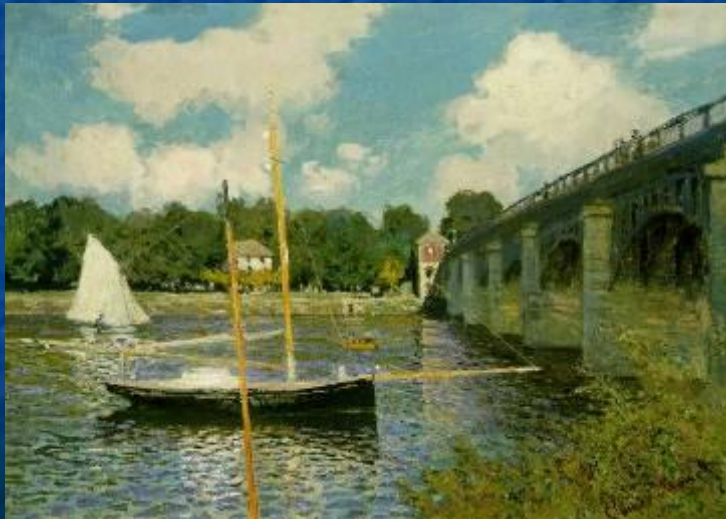
«Регата в Аржантее»

Одержимость Моне светом и цветом вылилась в многолетние исследования и эксперименты, целью которых было зафиксировать на холсте мимолетные, ускользающие оттенки природы.