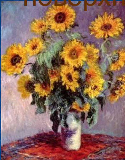
«Натюрморт с подсолнухами»