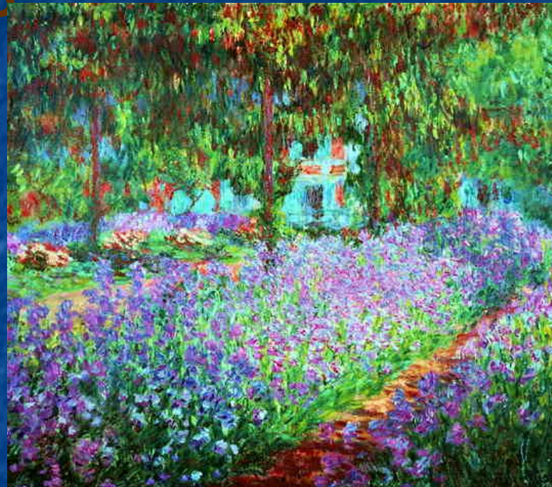
«Сад художника в Живерни»

Она представляла собой не гладкое письмо, с помощью тонких лессировок (так пишут ателье живописцев), а состояла из пастозных мазков.