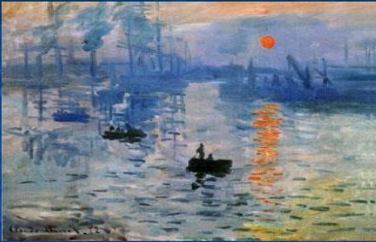
«Впечатления. Восход солнца.»