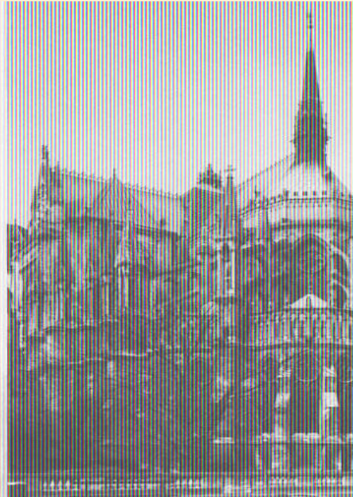
Собор в Реймсе

Готический стиль в основном проявился в архитектуре храмов, соборов, церквей, монастырей. Для готики характерны арки с заострённым верхом, узкие и высокие башни и колонны, богато украшенный фасад с резными деталями (вымперги, тимпаны, архивольты) и многоцветные витражные стрельчатые окна. Все элементы стиля подчёркивают вертикаль.