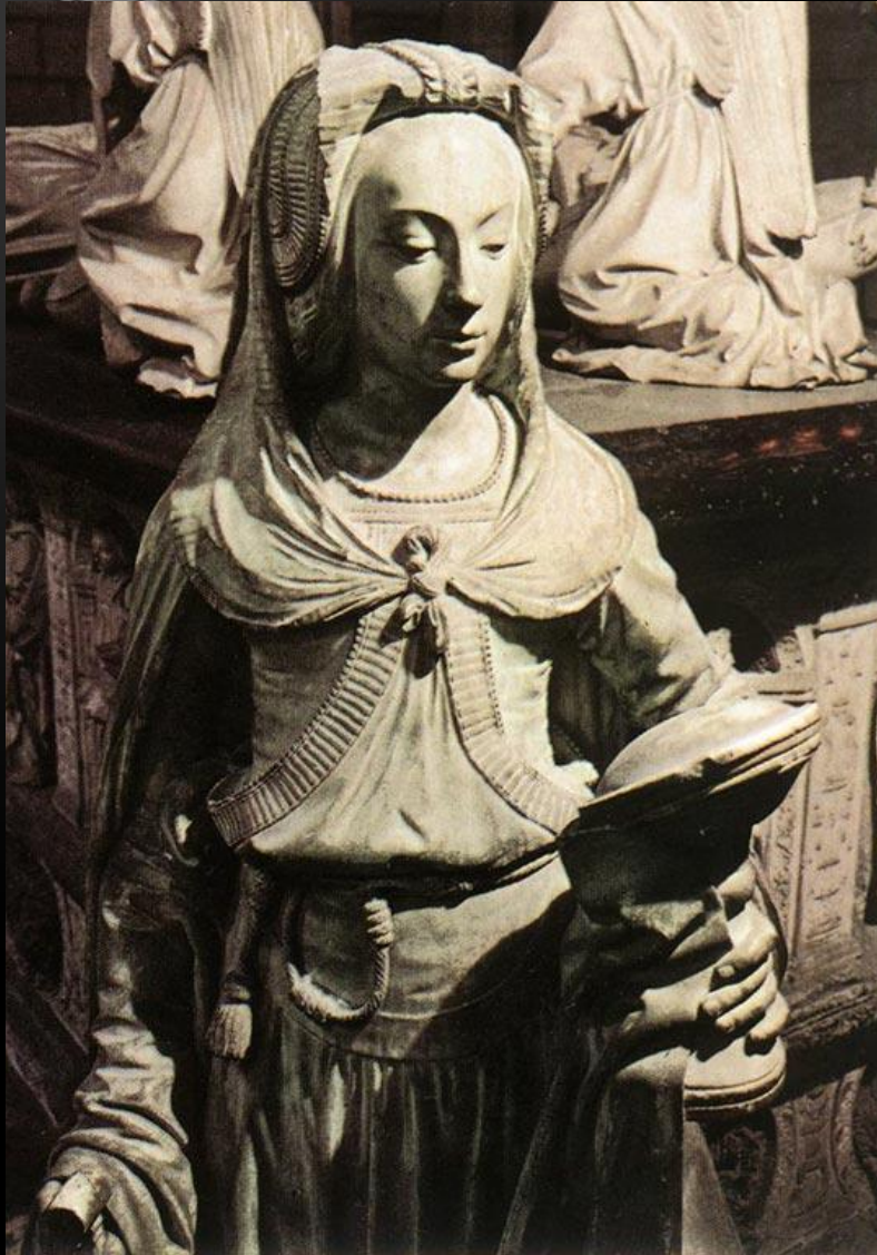
Мишель Коломб Надгробная плита Маргриты де Фой, 1502 собор в Нанте, Франция

Готическая скульптура — органическая часть архитектуры собора. Она включается в архитектурную конструкцию, входит в состав функциональных элементов постройки. В Реймском соборе она даже определяет его внешний облик. Взаимодействие архитектуры со скульптурой и живописью порождает то неповторимое разнообразие впечатлений, которым готика обогащала современников. Статуи сохраняют теснейшую связь со стеной, с опорой. Фигуры удлинённых пропорций как бы вторят вертикальным членениям архитектуры, подчиняясь динамическому ритму целого, образуя единый архитектурно-скульптурный ансамбль. Размеры их находились в точном соотношении с архитектурными формами, зависели от установленного религиозными канонами месторасположения. В готической архитектуре увеличилась не только степень подчинения скульптуры архитектуре, но и поднялось самостоятельное значение скульптуры. Готика продолжила начатое романскими ваятелями обособление человеческого образа от общего декоративного убранства. Стала более свободной трактовка художественной формы, усилилась роль статуарной круглой пластики, её взаимодействие с окружающей пространственной и световоздушной средой. Статуи часто отделялись от стены, помещались в нишах на отдельных постаментах. Легкие изгибы, повороты