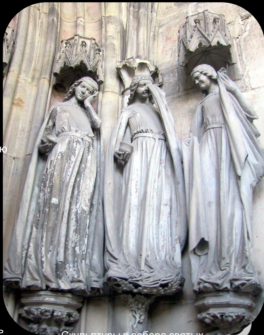
Скульптуры в соборе святых Мауритиуса и Катарины в Магдебурге, Германия

С готическим зодчеством неразрывно связано развитие пластики. Ей принадлежит первое место в изобразительном искусстве этого времени. Особенно богато украшался готический собор, который Виктор Гюго образно сравнивал с гигантской книгой. Главное место в его внешнем и внутреннем декоративном убранстве принадлежало скульптуре и рельефу. Композиционный и идейный замысел скульптурного декора был подчинен разработанной теологами программе. В храме - частице вселенной - стремились воплотить религиозную концепцию истории человечества с ее возвышенными и низменными сторонами. Тысячи скульптур и рельефов выполнялись в мастерских при соборах. В их создании часто принимали участие многие поколения художников и подмастерьев. Средоточием скульптурных композиций стали порталы, где большие по размеру скульптуры апостолов, пророков, святых следовали вереницами, как бы встречая посетителей. Тимпаны, арки порталов, промежутки между ними, галереи верхних ярусов, ниши башенок, вимперги украшались рельефами и скульптурами. Множество мелких фигур и сцен размещалось в архивольтах, трансептах, на консолях, цоколях, постаментах, контрфорсах, крышах. Капители заплетались листьями и плодами, по выступам карнизов, ребрам башенок,