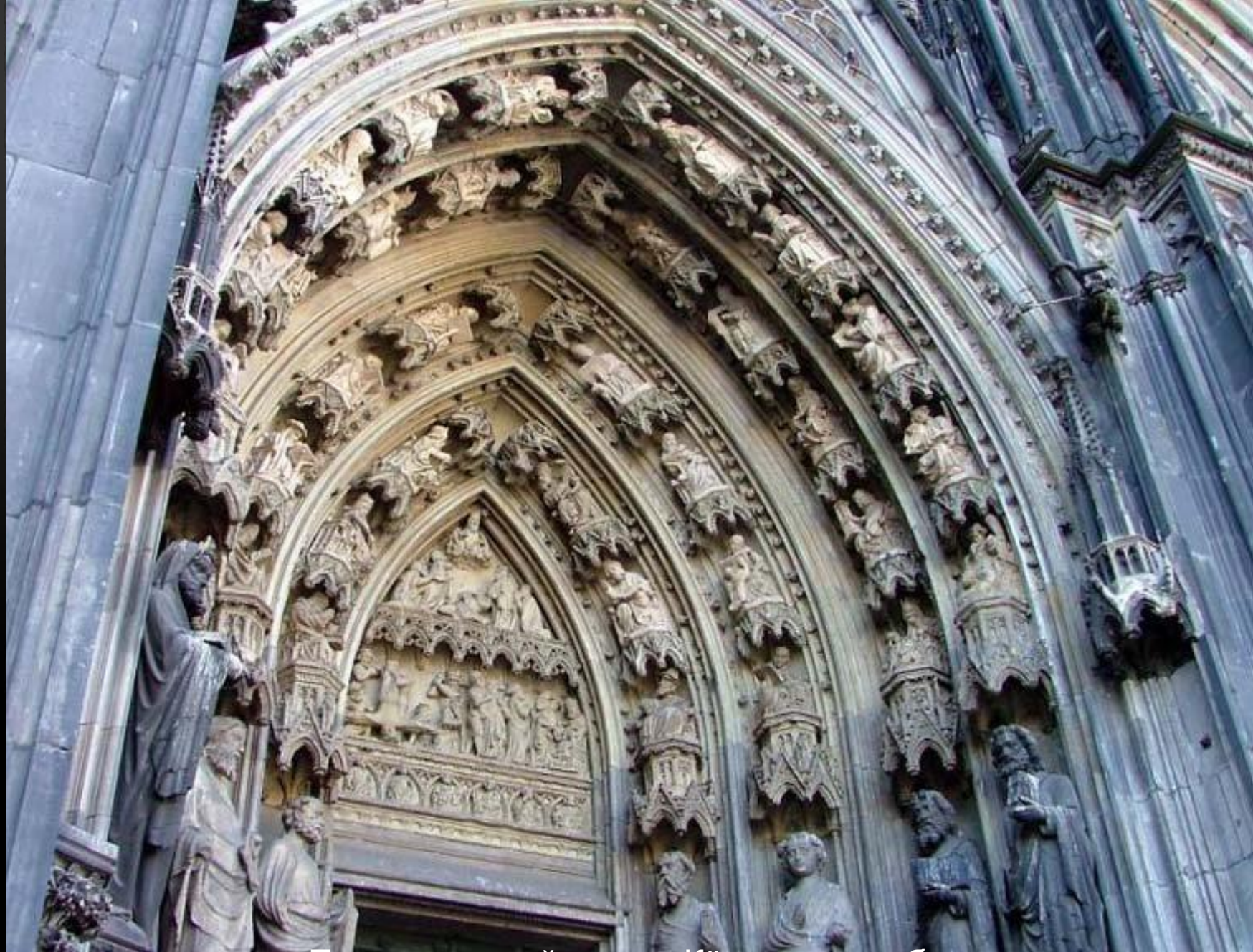
Перспективный портал Кёльнского собора