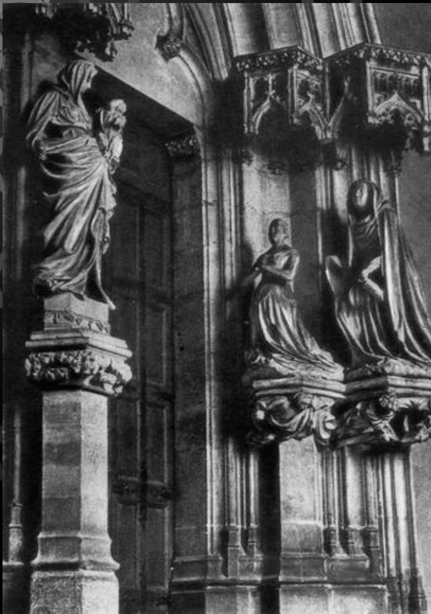
Портал церкви близ Дижона

Стремление усилить чувственную достоверность образа обнаруживало себя в острой наблюдательности и жадном интересе к единичному, частному, индивидуальному, портретному и даже необычному, случайному. Человеческое лицо, как красивое, так и уродливое, для средневекового мастера было отблеском вечной красоты и мудрости мироздания. Отсюда интерес к характерным жизненным деталям, которыми они обогащали пластику. Расцвет скульптуры начался на рубеже 12—13 столетий во Франции, когда процесс национального пробуждения был на подъеме. Простота и изящество четких форм, плавность и чистота контуров, ясность пропорций, сдержанные жесты служили во французской скульптуре выражением нравственной силы, духовного совершенства.