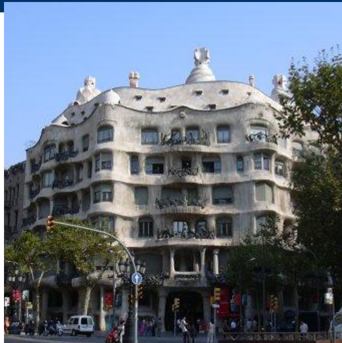
Дом Мила, Антонио Гауди, Барселона, Испания.