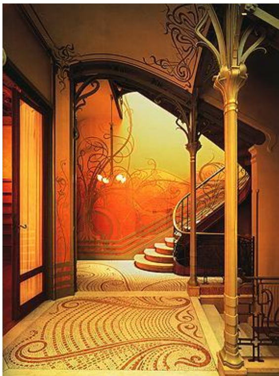
Виктор Орта, лестница в особняке "Тасселя", 1892-1893 гг.