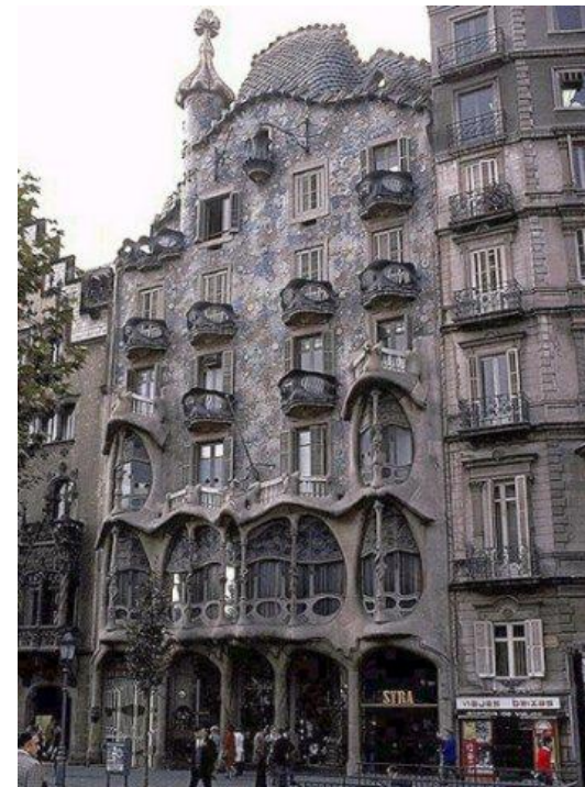
Дом Батльо, Антонио Гауди, Барселона, Испания