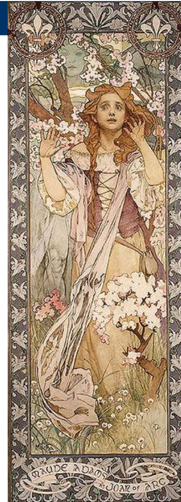
Афиша «Мод Адамс как Жанна д'Арк», Альфонс Муха, Чехия, 1909 г.