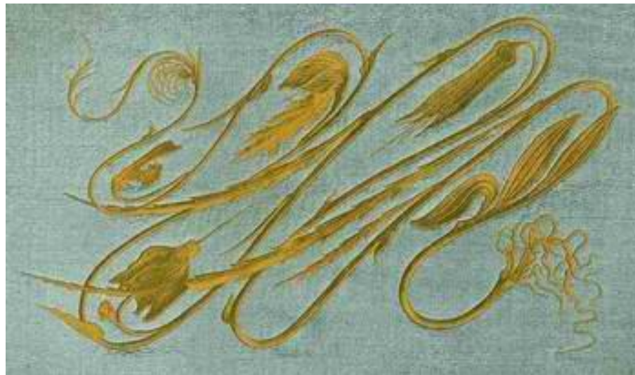
Герман Обрист, «Удар бича», вышивка золотым шелком по шерсти, 1895 г.