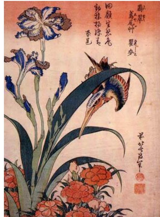
Гравюра «Ирисы и птица», Кацусик Хокусай, 16 век, Япония