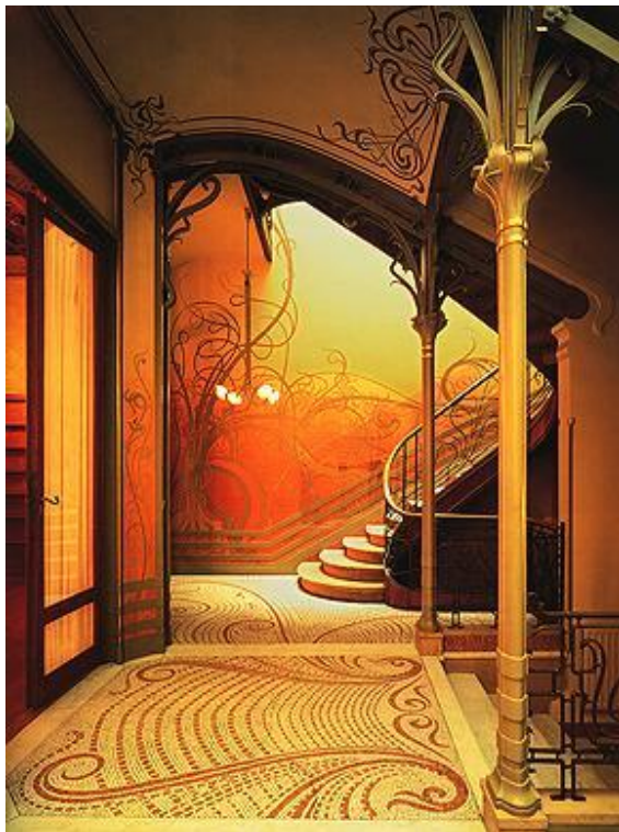
Виктор Орта, лестница в особняке "Тасселя", 1892-1893 гг.