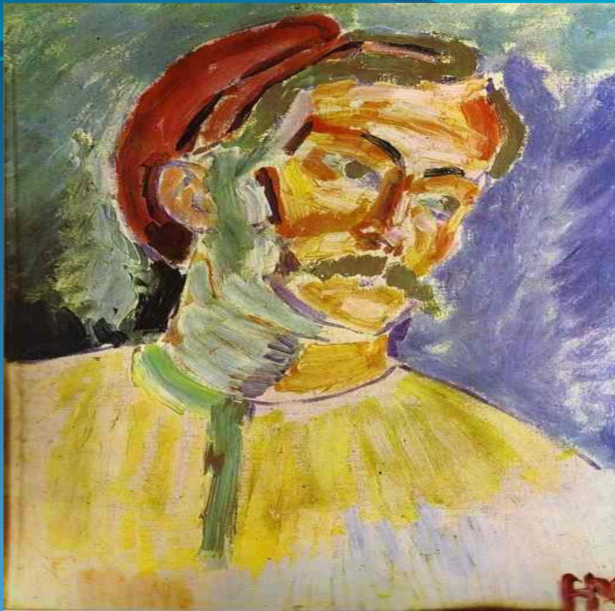
Портрет Андре Дерена - 1905