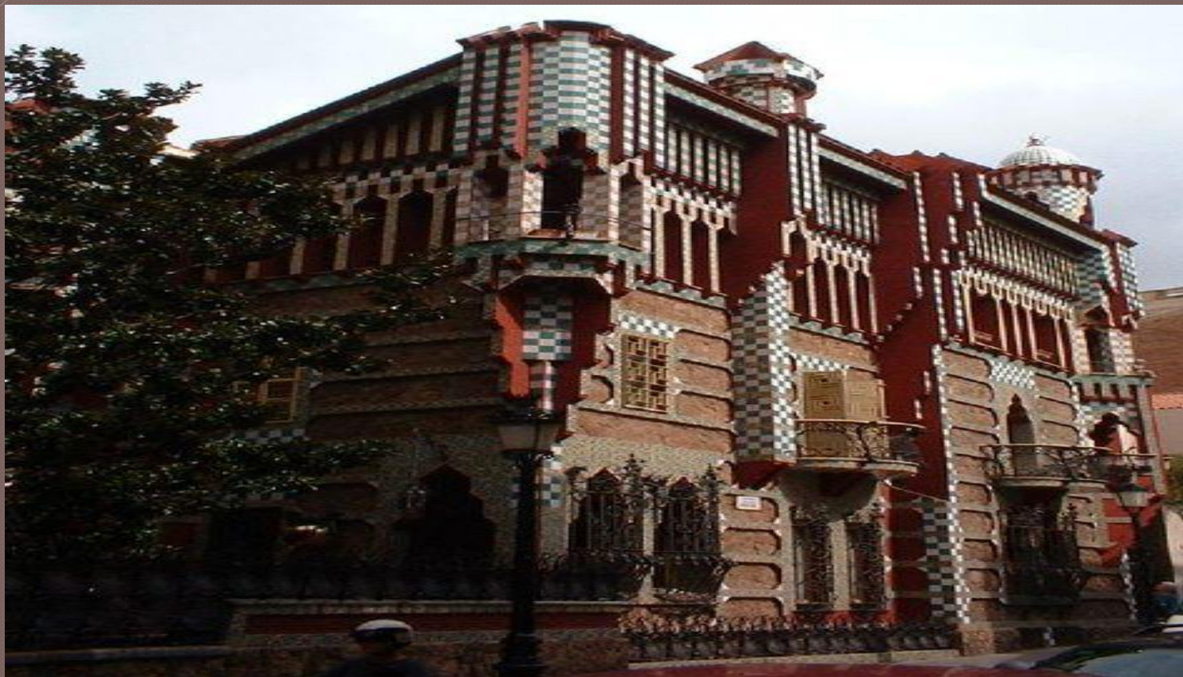
Дом Висенс (Барселона) « Всемирное наследие ЮНЕСКО »