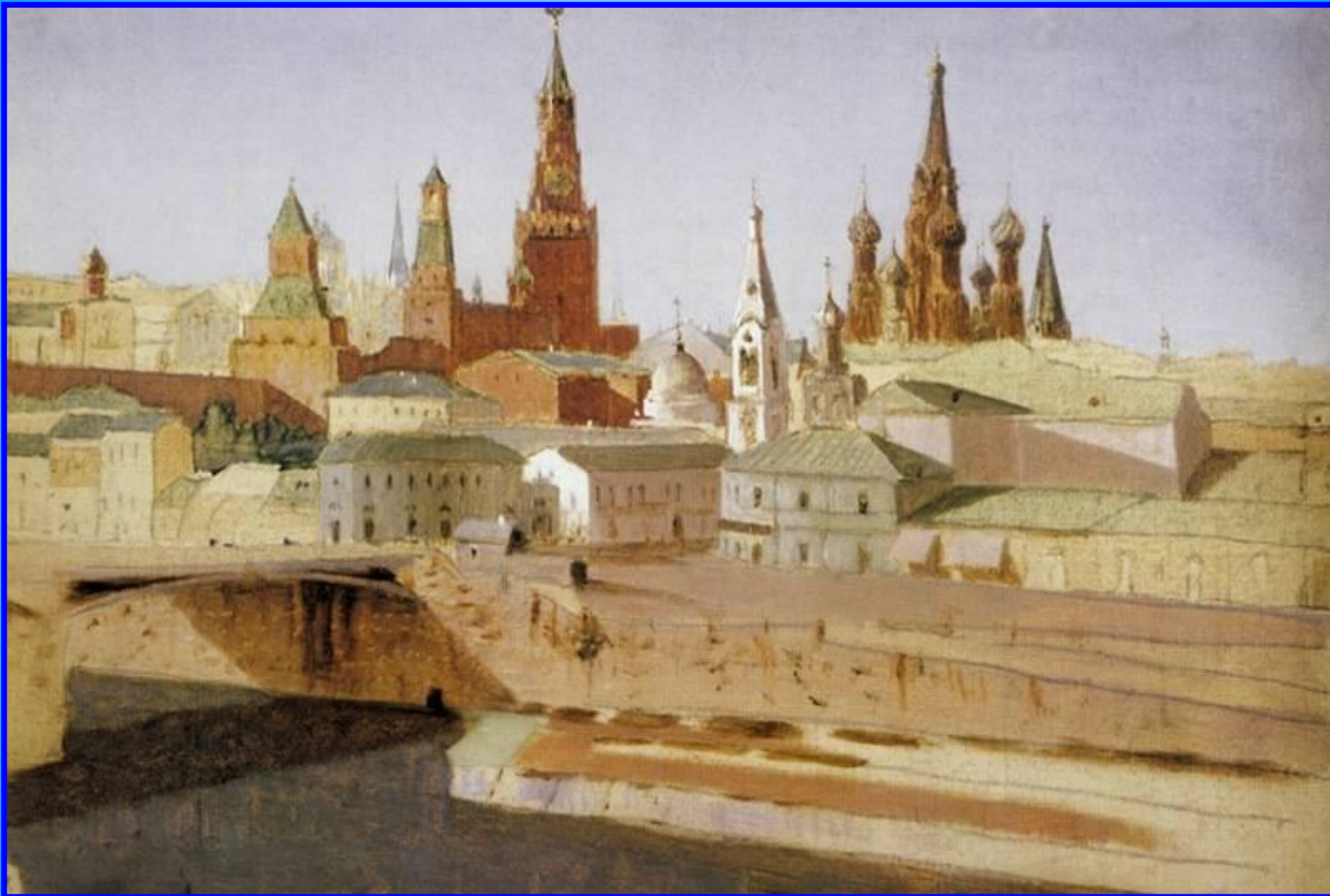
Вид на Москворецкий мост, Кремль и храм Василия Блаженного