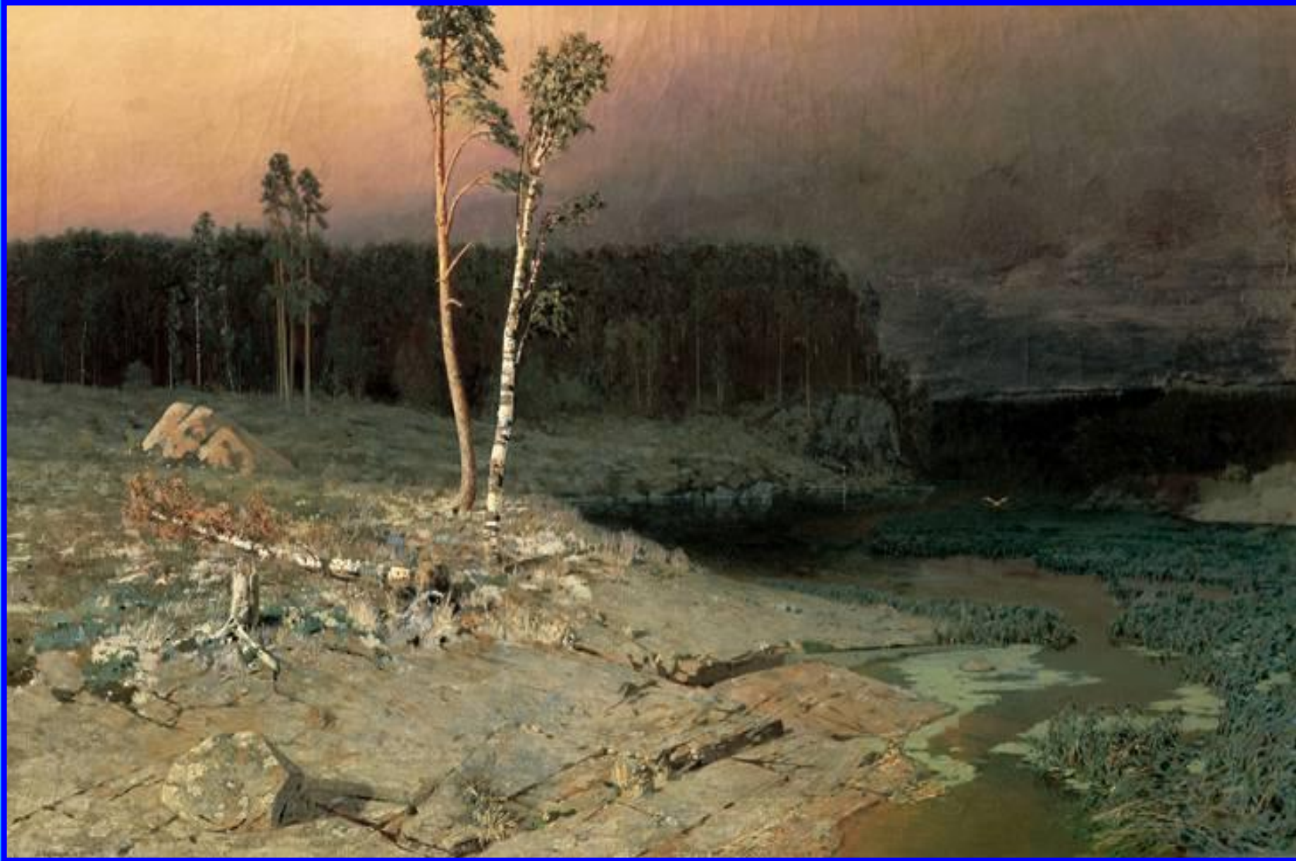
На острове Валааме