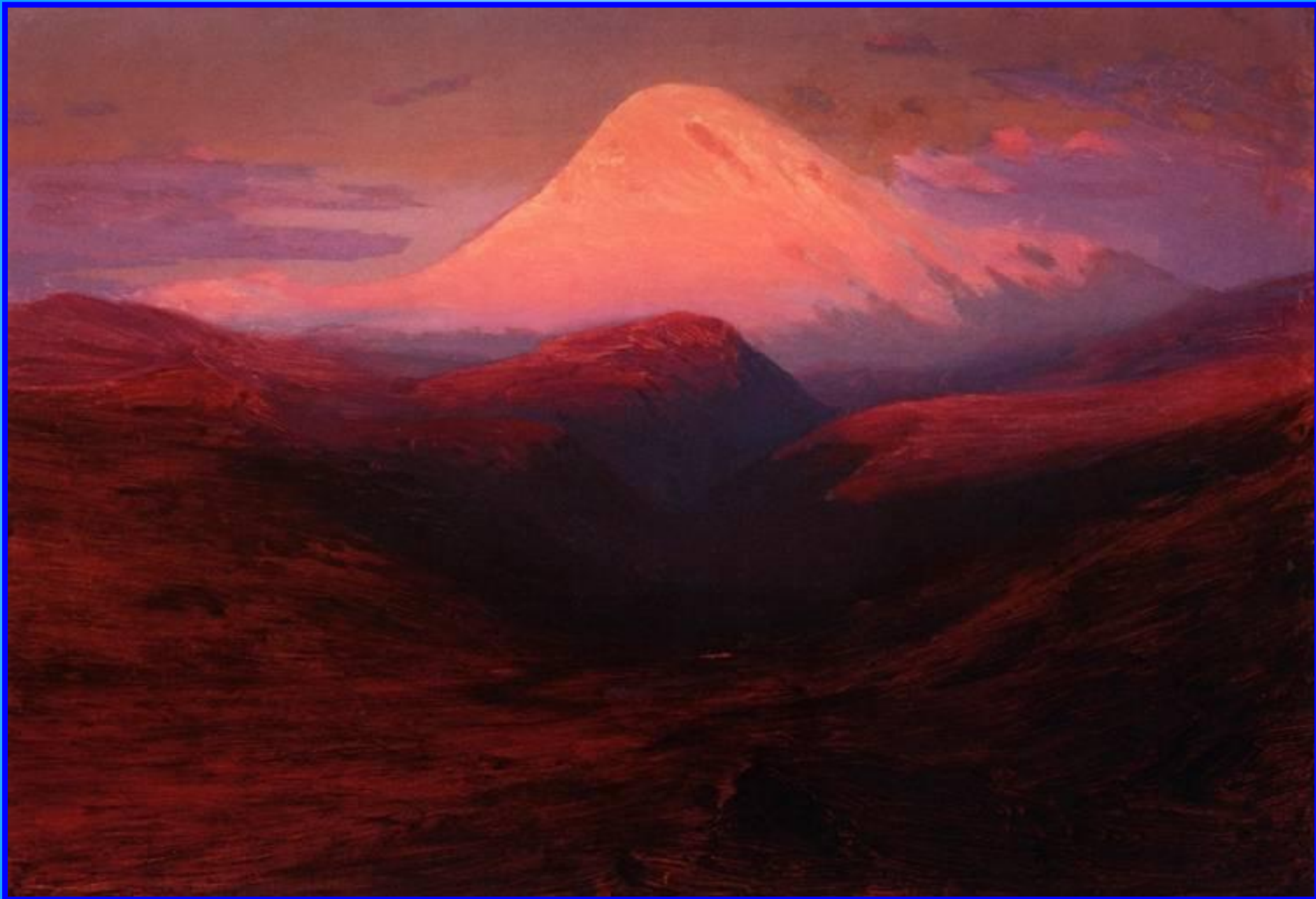
Эльбрус на закате