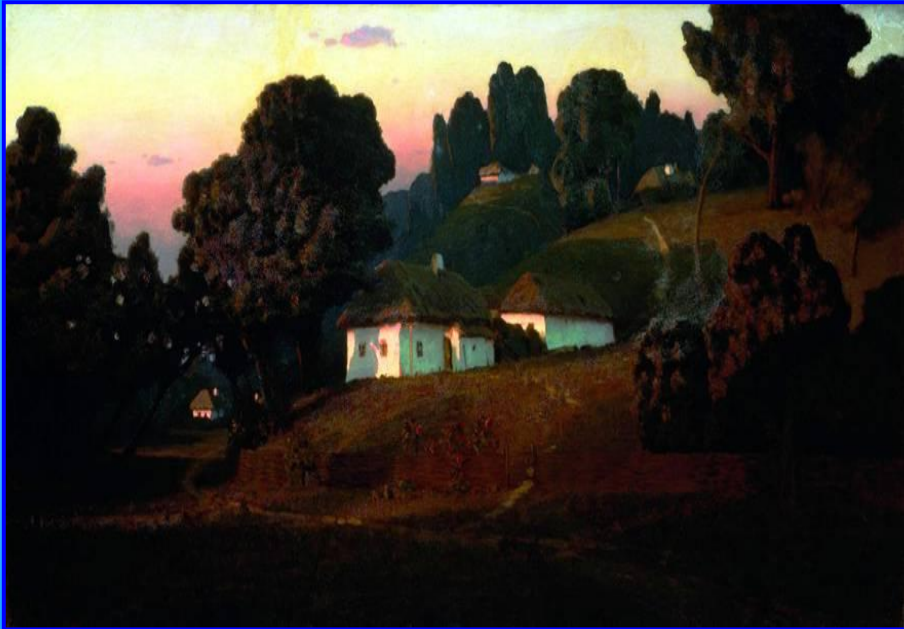
Вечер на Украине