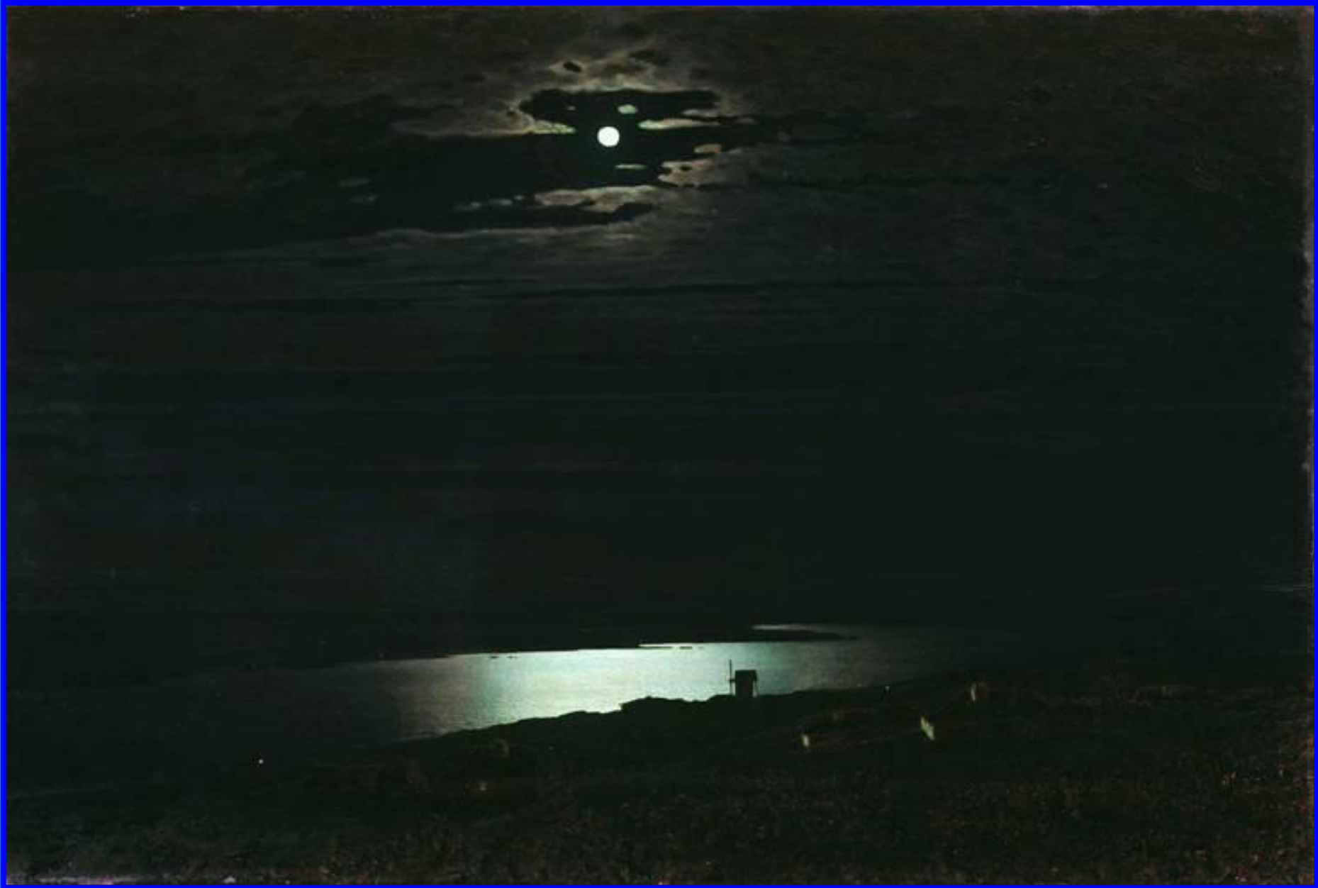
Лунная ночь на Днепре