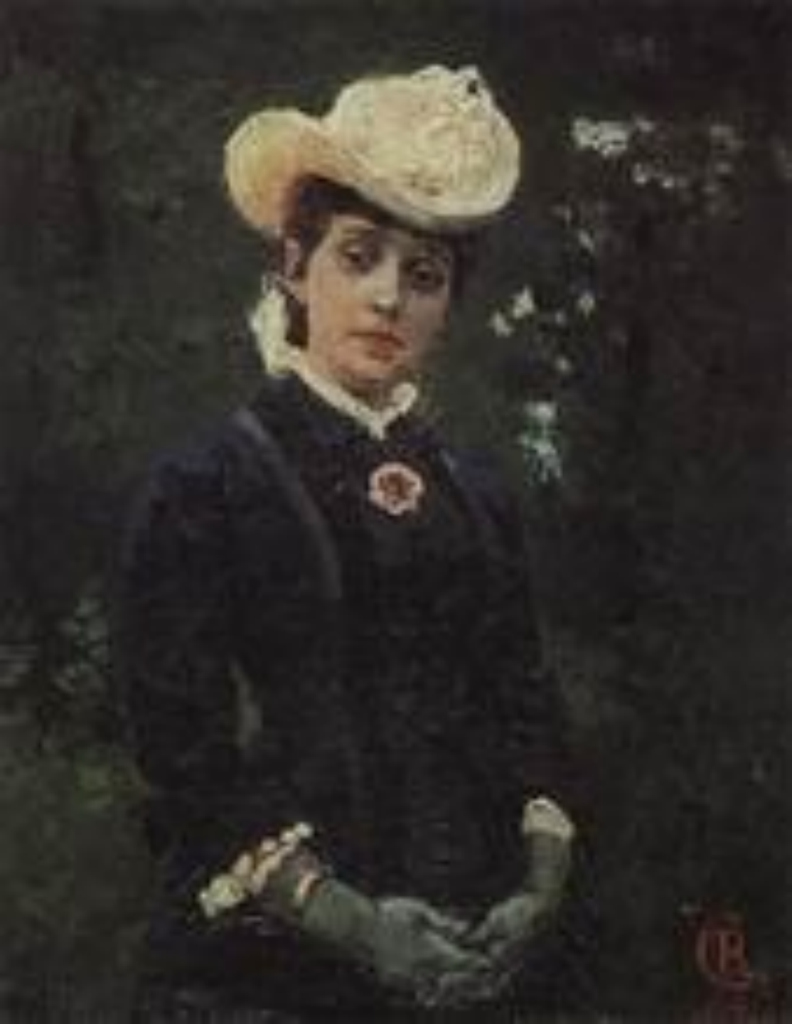
Портрет Е.К. Дерягиной. 1879