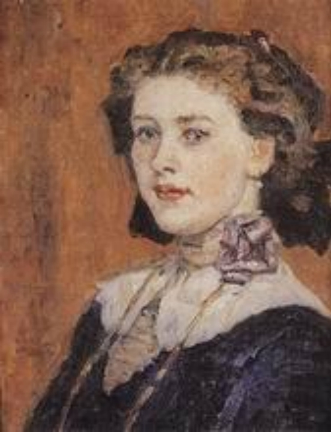
Портрет молодой женщины. 1911