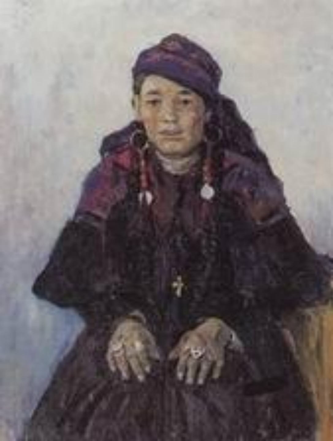
Портрет хакаски. 1909