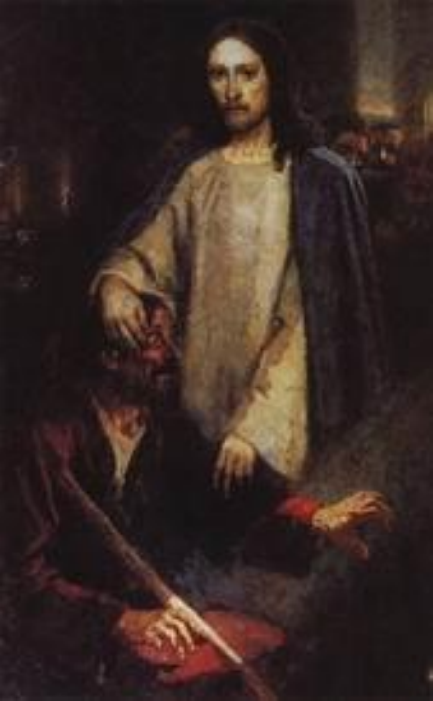
Исцеление слепорожденного Иисусом Христом. 1888