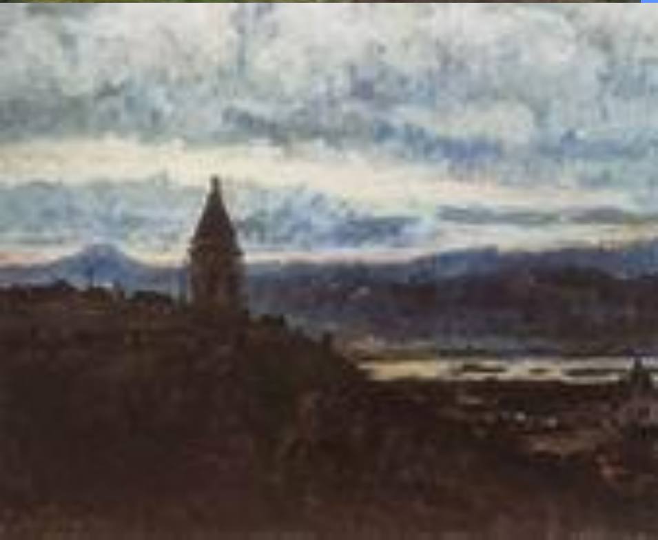
Вид Красноярска. 1887