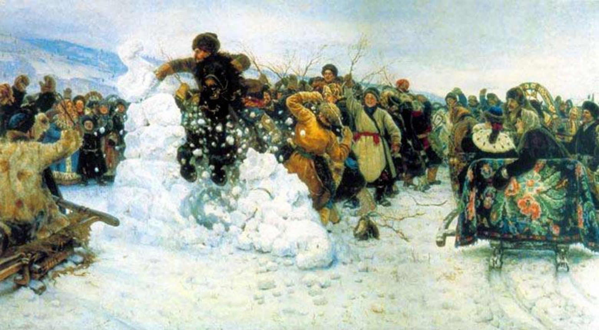
Взятие снежного городка. 1891