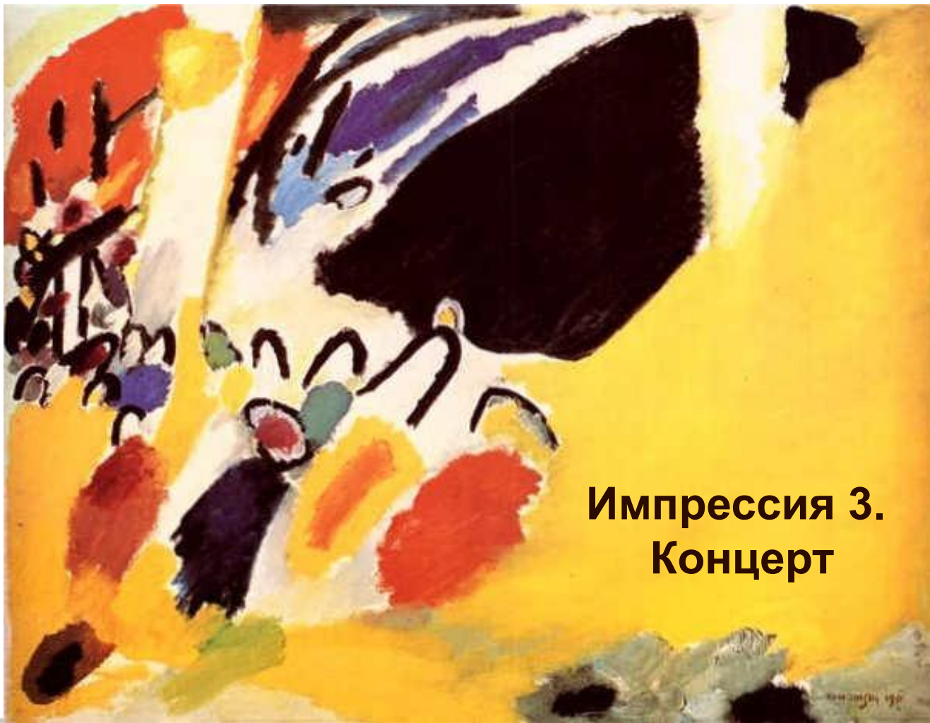
Импрессия 3. Концерт