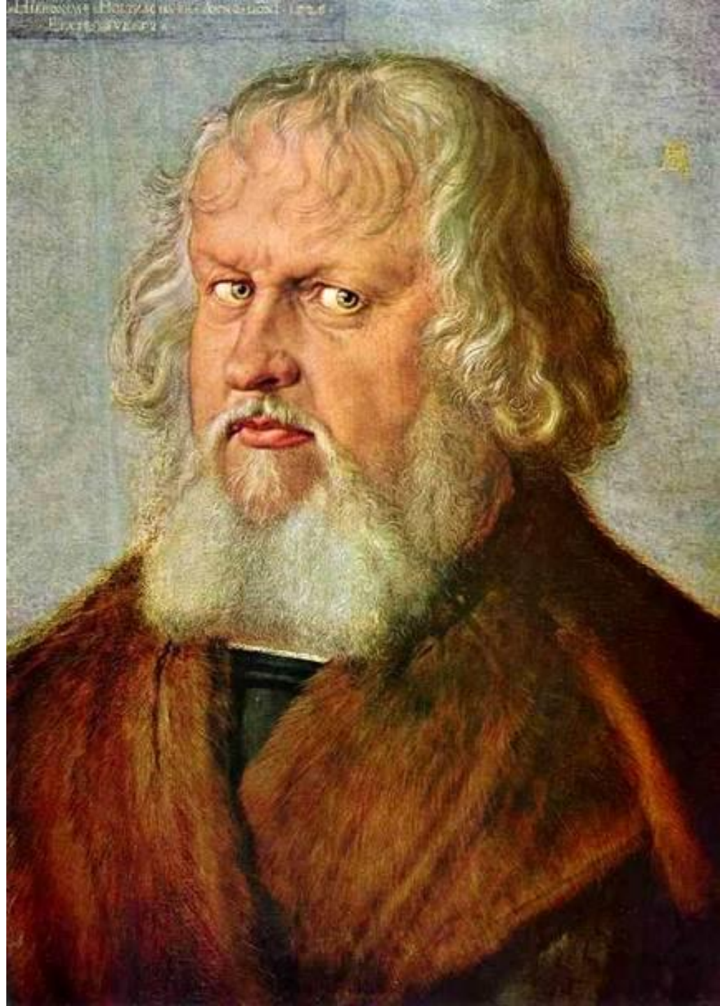
Портрет Иеронима Хольцшюэра