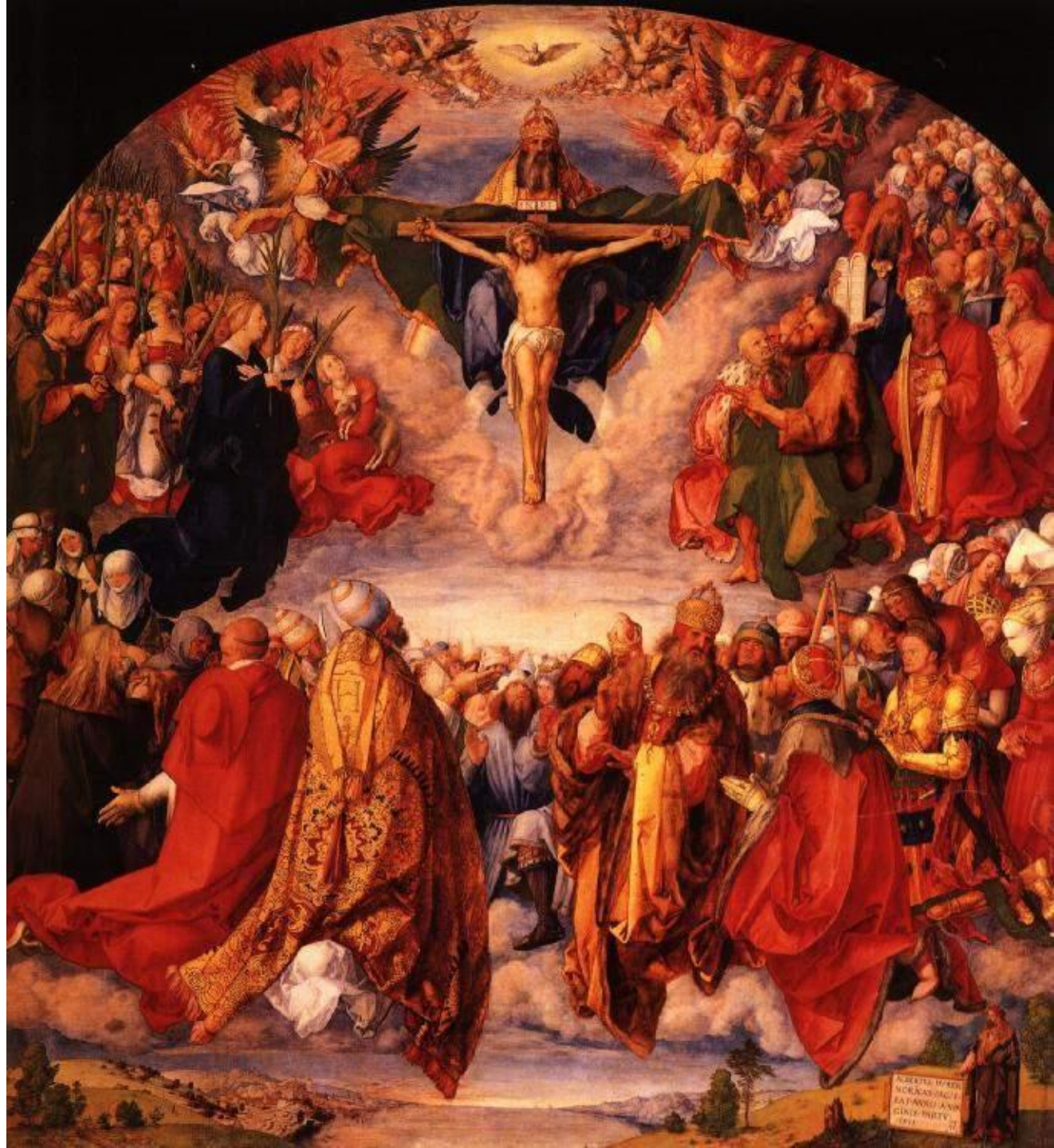
Алтарь всех святых