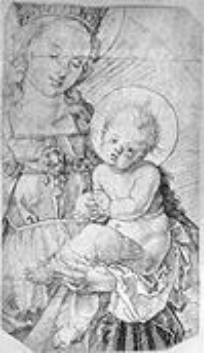
Мадонна с младенцем