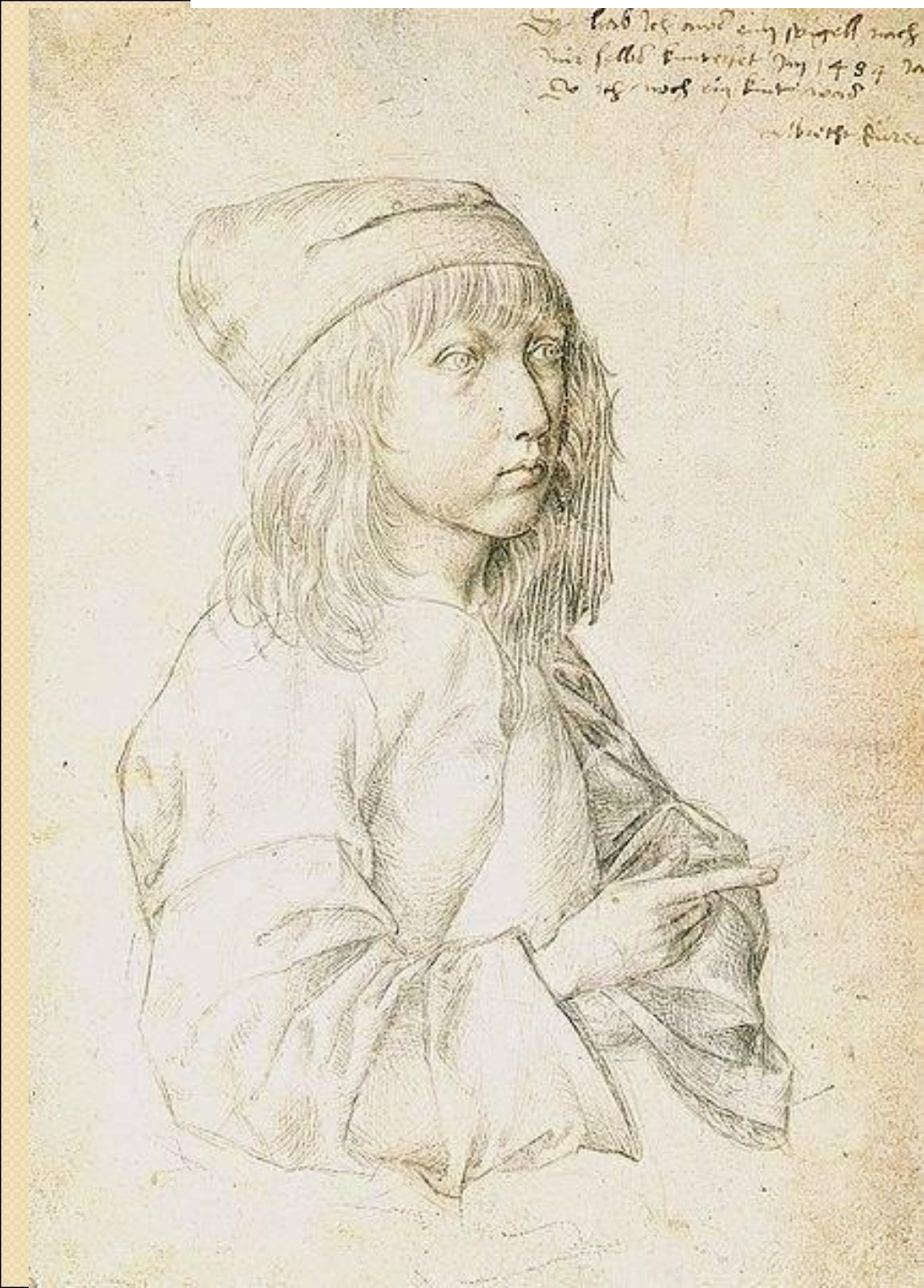
Автопортрет. Рисунок серебряным карандашом