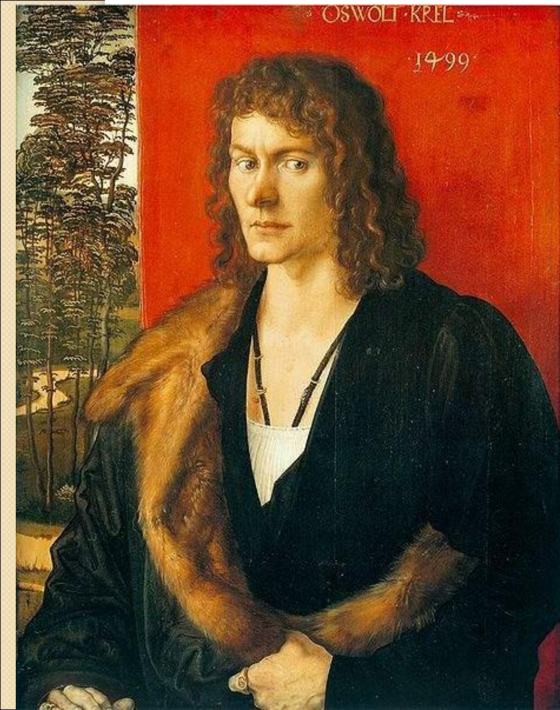
Портрет Освольта Креля. 1499.