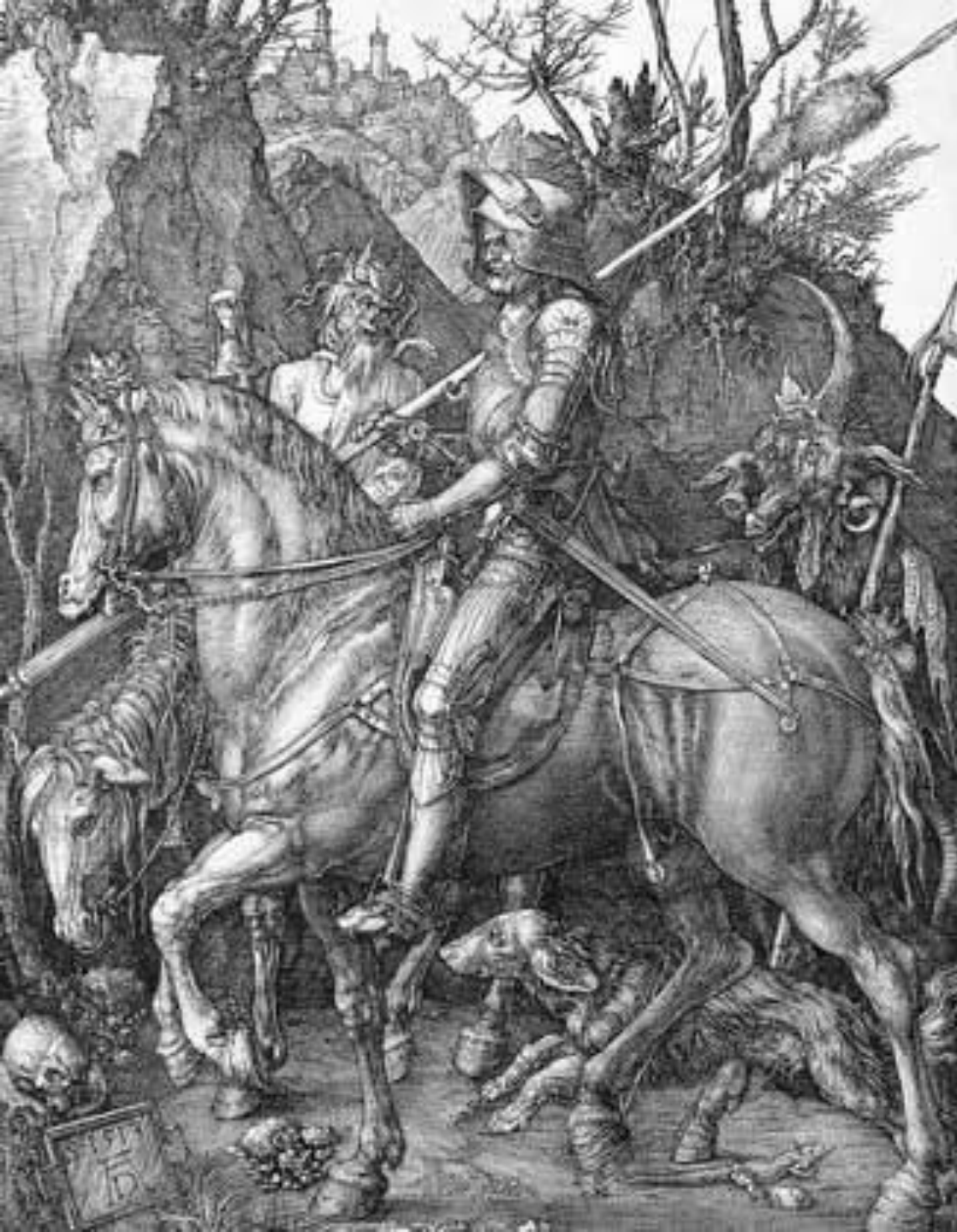
Рыцарь, смерть и дьявол