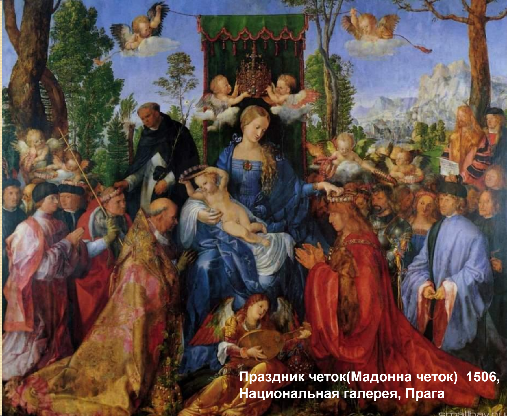
Праздник четок(Мадонна четок) 1506, Национальная галерея, Прага