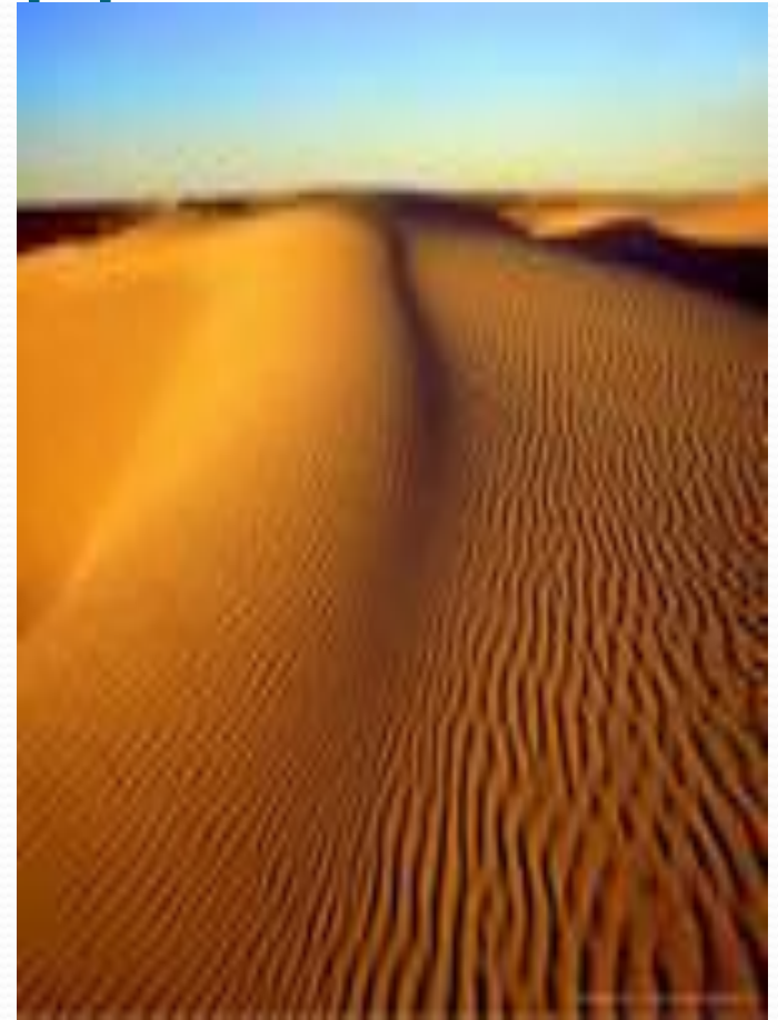
Ветры в пустыне

И природа вносит изменения в состав атмосферы Земли, в основном, запыляя её. «Огромные массы пыли поднимают в воздух ветры пустынь. Она заносится на большую высоту и может разнестись очень далеко. Мельчайшие частицы каменистых пород, поднятые в воздух, закрывают горизонт.