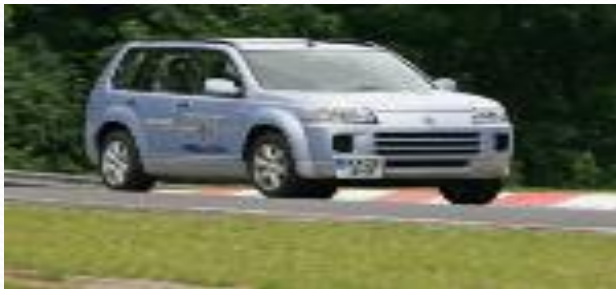
Выхлопные газы автомобилей

Деятельность человека оказывает разрушающее действие на химический состав атмосферы. При производстве в окружающую среду выбрасывается углекислый газ и ряд других парниковых газов. Так же губительное воздействие оказывают выхлопные газы автомобилей, содержащие оксид азота, свинец, а также большое количество диоксида углерода (углекислого газа).