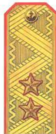
Генерал-лейтенант (парадная форма одежды, береговые войска)