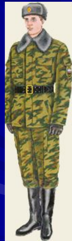
парадная для строя