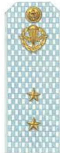
Прапорщик (парадная форма одежды, ВДВ)