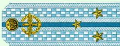
Старший лейтенант (парадная форма одежды, ВВС)