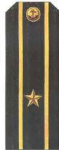
Капитан 3 ранга (повседневная форма одежды)