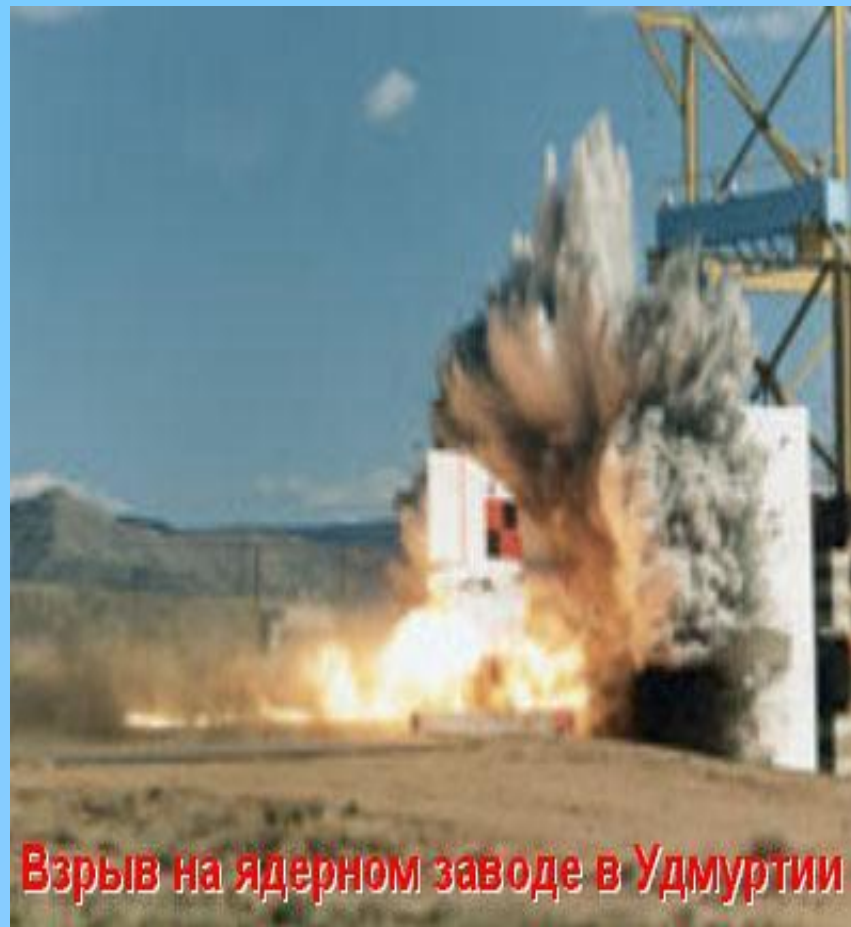
Взрыв на ядерном заводе в Удмуртии