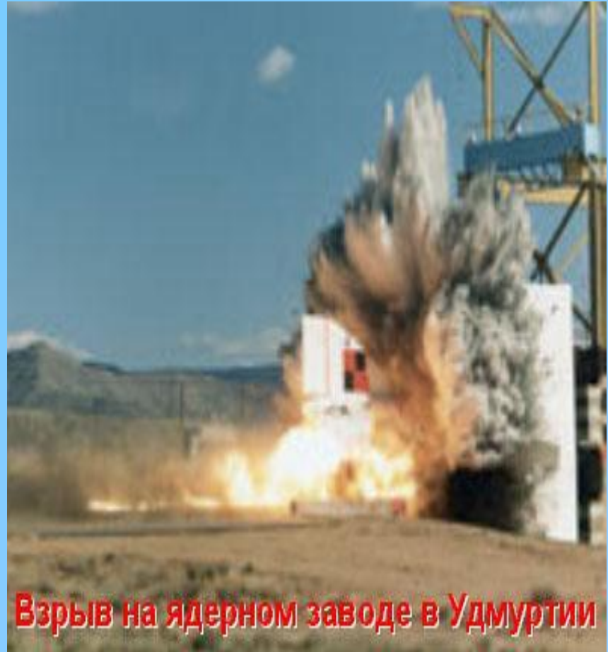
Взрыв на ядерном заводе в Удмуртии