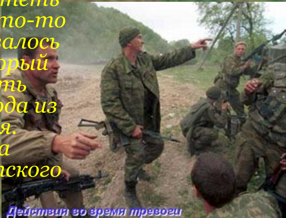
Действия во время тревоги