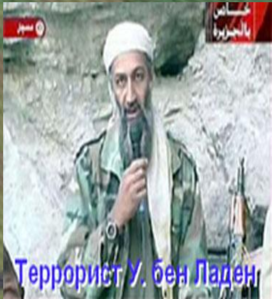
Террорист У. бен Ладен