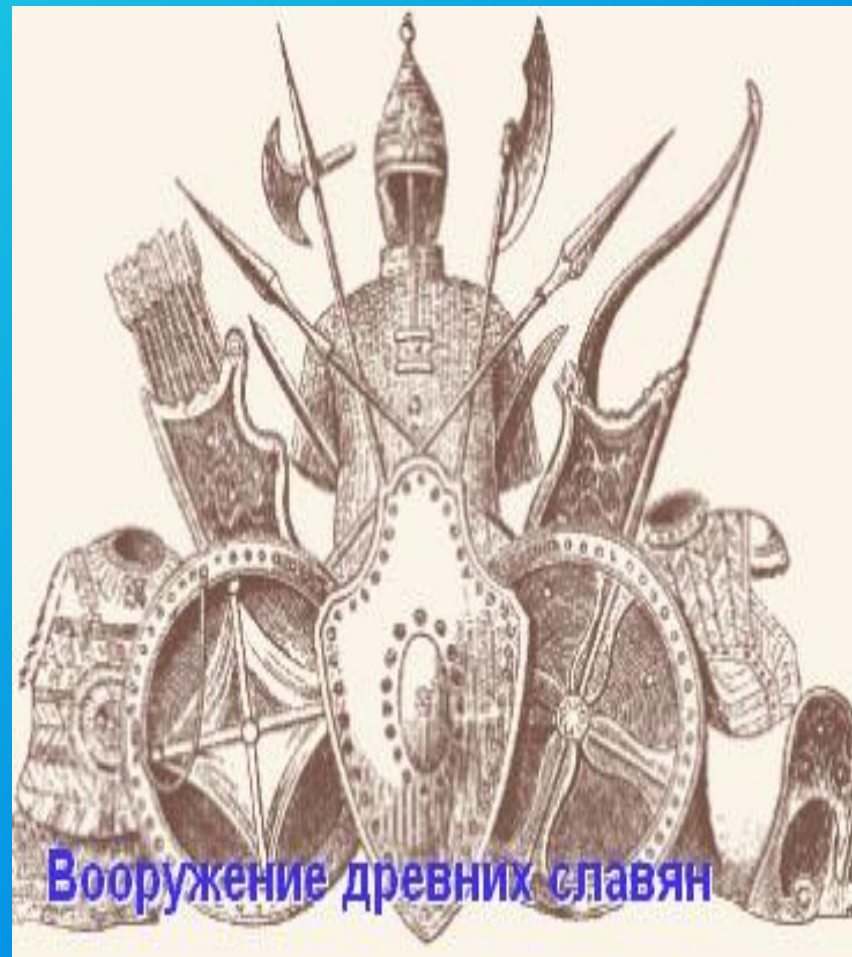
Вооружение древних славян