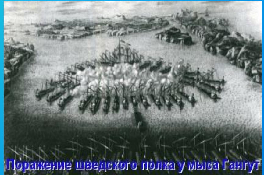
Поражение шведского полка у мыса Гангут